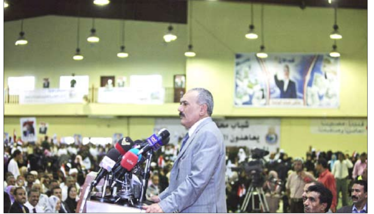
■ رئيس الجمهورية يلقي كلمة في الملتقى الوطني الأول لشباب الوحدة