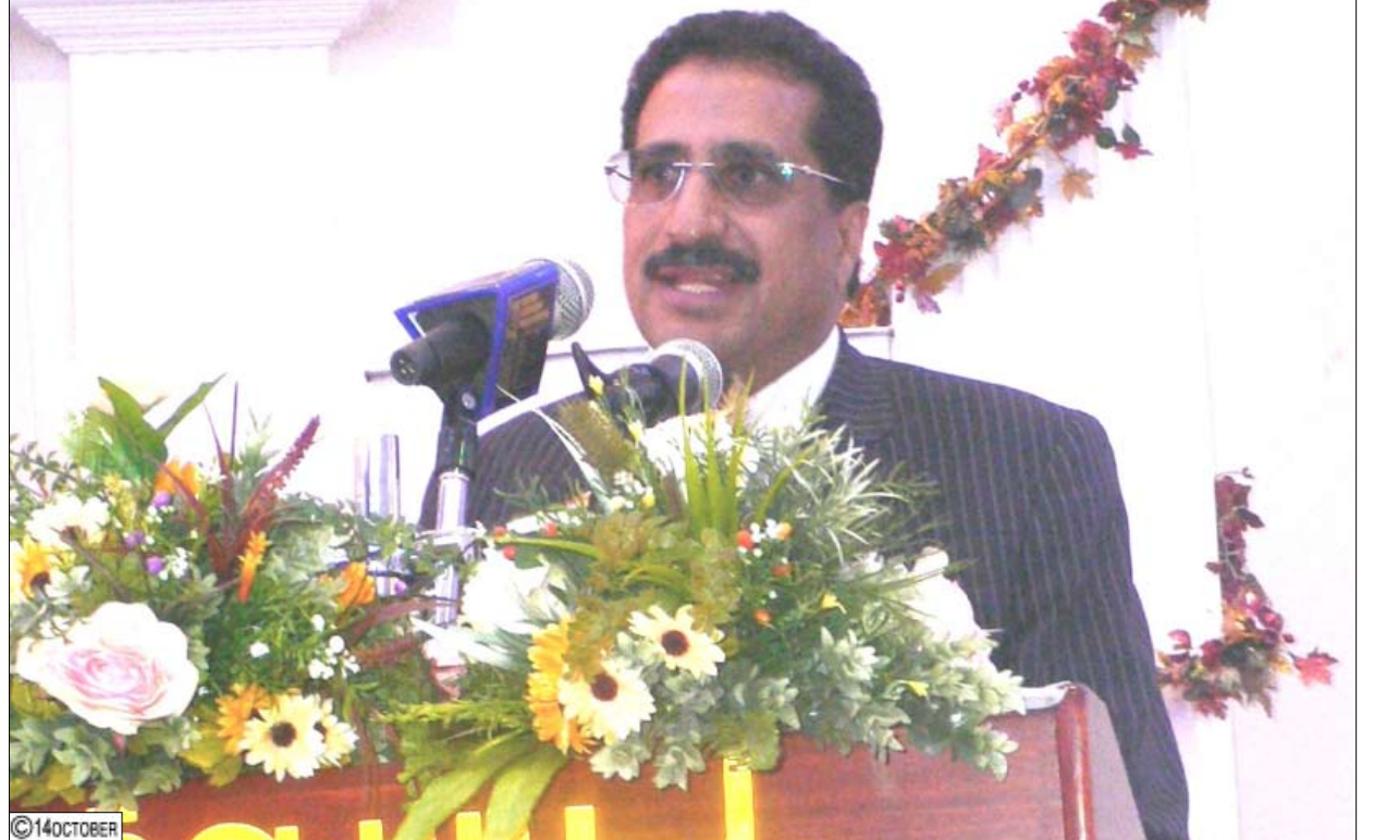
وزير التربية والتعليم لدى إلقائه كلمته