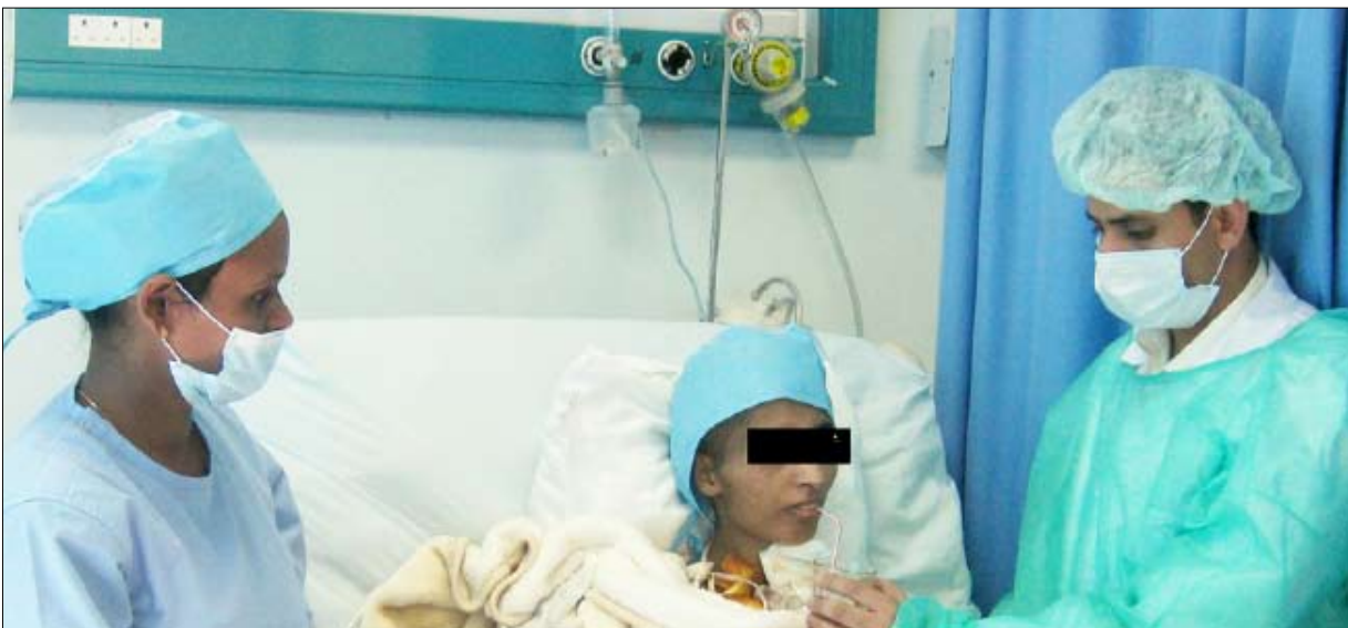
في إحدى غرف الملاحظات الطبية

ما هي الكلمة الأخيرة التي تودون قولها في نهاية هذا اللقاء؟ - العمل الطبي له خصوصيته ونحن حريصون على أداء المهام والمسؤوليات المنوطة بنا على الوجه الأمثل ومن الطبيعي أن توجد بعض الهفوات البسيطة وغير المقصودة وغير الضارة والمهم أن يتعاون الجميع على تقديم خدمات طبية تلبى حاجة المرضى ومن الخطأ أن يسعى البعض إلى محاربة المصلحة العامة طمعاً في تحقيق منافع ومكاسب شخصية. وبالمناسبة لا يفوتني ومعني كل المبركين لمصلحة المستشفى تقديم الشكر الجزيل لكل من مد لنا يد العون لإنجاح عملنا وتطوير مستوى الخدمات الطبية وعلى رأسهم فخامة الرئيس علي عبدالله صالح رئيس الجمهورية واللواء يحيى الراعي رئيس مجلس النواب واللواء يحيى العمري محافظ دمار والأستاذ مجاهد شايف العنسي الأمين العام والدكتور أحمد الحضرائي رئيس جامعة دمار والعقيد أحمد المصقري مدير عام مديرية جهران ومعهم كل المخلصين والغيورين على المصلحة الوطنية على وقوفهم معنا وإشرافهم المباشر على عملنا وهو ما جعلنا نزيد من نشاطنا ونضاعف الجهود والشكر لكم ولصحتكم الغراء على هذه الفرصة وآتيني لكم المزيد من التوفيق والنجاح في أداء الرسالة الإعلامية المنوطة بكم.