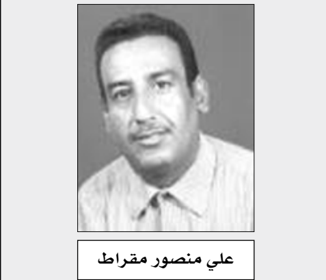
علي منصور مقراط

ما حظيت به مدينة عدن أو بالأصح محافظة عدن الأبية الباسلة من اهتمام ورعاية مباشرة من قبل فخامة الأخ الرئيس علي عبد الله صالح رئيس الجمهورية منذ استعاد الوطن وحدته في 22 مايو 1990م الأغر الذي رفع علمها من هذه المدينة التاريخية العظيمة قد مثل الحب العميق لهذا القائد الوحدوي الرمز لعدن وأبنائها الشرفاء، والأرجح أن ذلك الاهتمام قد تجسد بلغة العطاء والفعل من خلال النهضة التنموية الشاملة التي شهدتها عدن في مختلف المجالات في سنوات الوحدة المباركة التي أعادت لها مكانتها واعتبارها الحقيقي كمنطقة عصرية حضارية في قلب التاريخ المعاصر والواقع أو المشهد الراهن في عدن التي يتحدت بالإنجازات والصوره البهية الزاهية لما وصلت إليه من تطور هائل لا يقبل الشك والمزايدة.