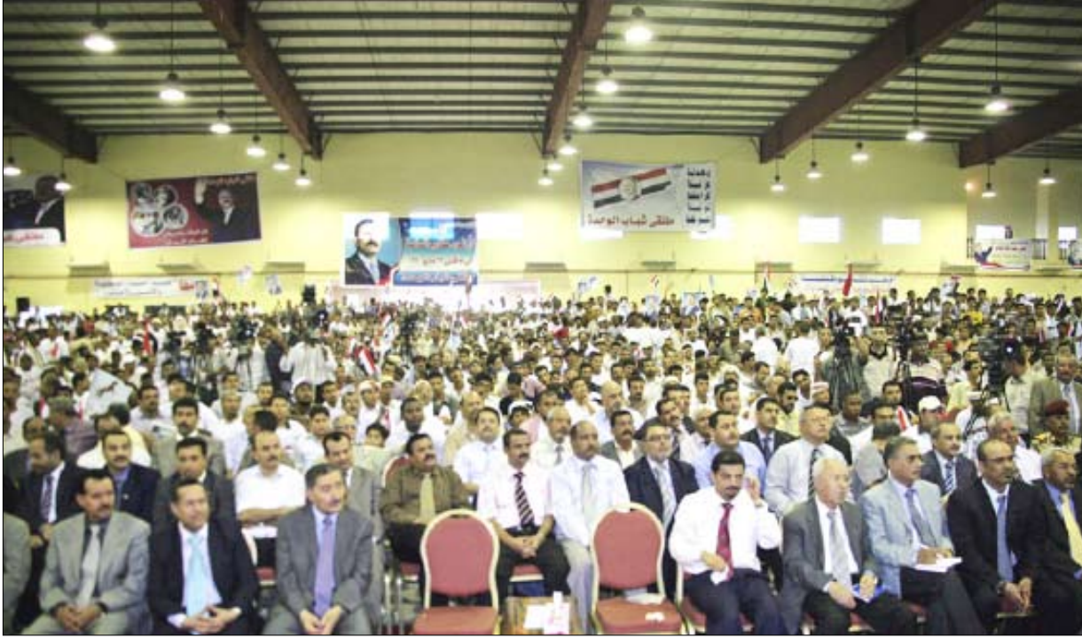
■ جانب من المشاركين في الملتقى