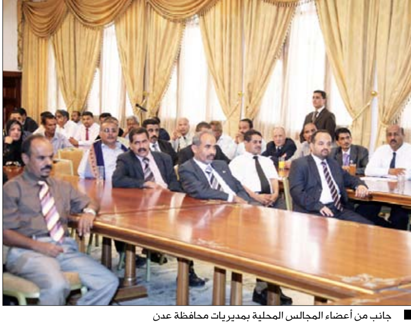
جانب من أعضاء المجالس المحلية بمديريات محافظة عدن

ويتلقى اتصالين هاتفين من أمير دولة قطر وخالد مشعل عدن/ سيا | تلقى فخامة الأخ الرئيس علي عبدالله صالح رئيس الجمهورية مساء يوم أمس الخميس اتصالاً هاتفياً من أخيه صاحب السمو الشيخ حمد بن خليفة آل ثاني أمير دولة قطر الشقيق. جرى خلاله بحث العلاقات الأخوية ومجالات التعاون المشترك وسبل تعزيزها وتطويرها وعلى مختلف الأصعدة وبما يخدم المصالح المشتركة للبلدين والشعبين الشقيقين. كما جرى التشاور وتبادل وجهات النظر إزاء المستجدات العربية والإقليمية التي تهم البلدين والأمة العربية. كما تلقى فخامة الأخ الرئيس علي عبدالله صالح رئيس الجمهورية أمس اتصالاً هاتفياً من رئيس المكتب السياسي لحركة المقاومة الإسلامية الفلسطينية (حماس) خالد مشعل. وهنا رئيس المكتب السياسي لحركة حماس فخامة الأخ الرئيس خلال الاتصال بالعيد الوطني العشرين للجمهورية اليمنية (22 مايو)، وأطلعته على تطورات الأوضاع على الساحة