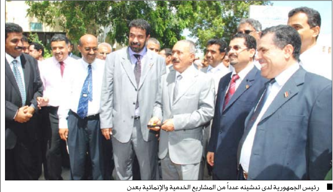
رئيس الجمهورية لدى تدشينه عدداً من المشاريع الخدمية والإنمائية بعدن

عدن/ سيا | دشّن فخامة الرئيس علي عبدالله صالح رئيس الجمهورية أمس في العاصمة الاقتصادية والتجارية عدن عدد المشاريع الإنمائية بكلفة 29 ملياً و66 مليوناً و12 ألفاً و394 ريالاً. وقد أراح فخامة الأخ الرئيس اللوحة التذكارية للمشروع التي أقيمت في مبنى محافظة عدن.. ويبلغ عدد المشاريع التي تم افتتاحها ووضع الحجر الأساس لها 119 مشروعاً في مجالات الصحة العامة والسكان والتربية والتعليم والثروة السمكية والتعليم الفني والمهني والأشغال العامة والطرق والمؤسسات العامة للاتصالات وتقنية المعلومات والمؤسسة المحلية للمياه والصرف الصحي وصندوق النظافة والتحسين العام والإرشاد والتعليم العالي «جامعة عدن» والنقط والمعادن وبرامج تطوير مدن الموانئ والأمن.