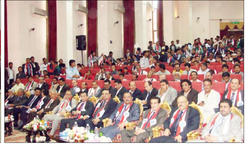
رئيس الوزراء يشهد العرض