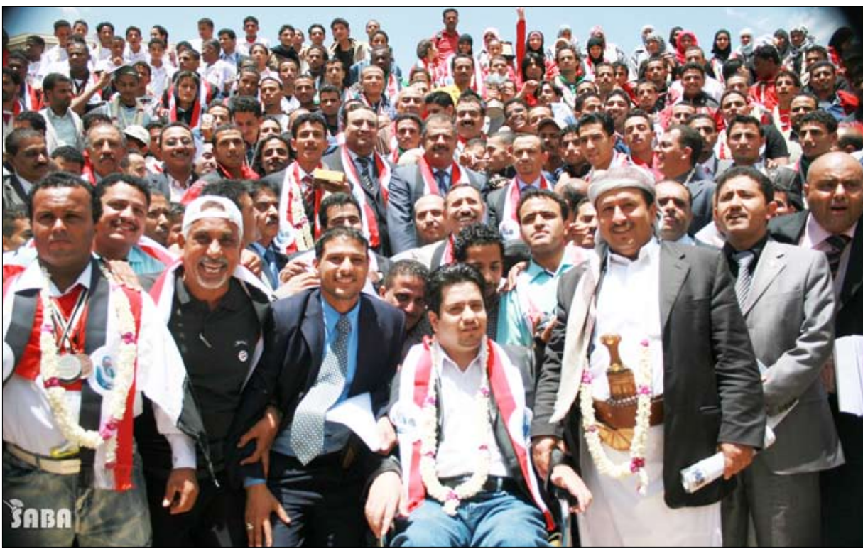
جانب من الحاضرين

حضرت رئيس مجلس الوزراء الدكتور علي محمد مجور يوم أمس الخميس حفل تكريم الأبطال الحاصلين على المراكز المتقدمة في المشاركات الخارجية خلال النصف الثاني من 2009 والربع الأول من 2010 في مختلف الألعاب الرياضية.