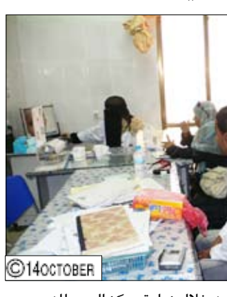
شباب وطلاب مركز اليمن خلال زيارة مركز السرطان

يتم حالياً إنشاء مركز الأورام الوطني للسرطان في مستشفى الوحدة بناء على توجيهات من فخامة الأخ الرئيس بنسحاء مراكز وطنية للسرطان في عدد من محافظات الجمهورية، لافتاً إلى أن مركز أورام السرطان للأطفال يعتبر ثروة لاستكمال المركز الوطني للأورام في عدن والذي سيكون للأطفال والنساء والرجال، بهدف الحد من سفرهم إلى الخارج للعلاج.