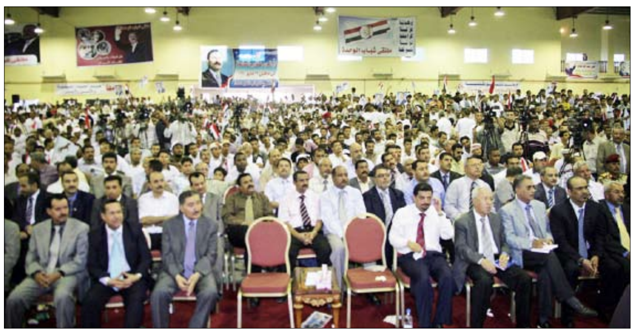
جانب من المشاركين في الملتقى