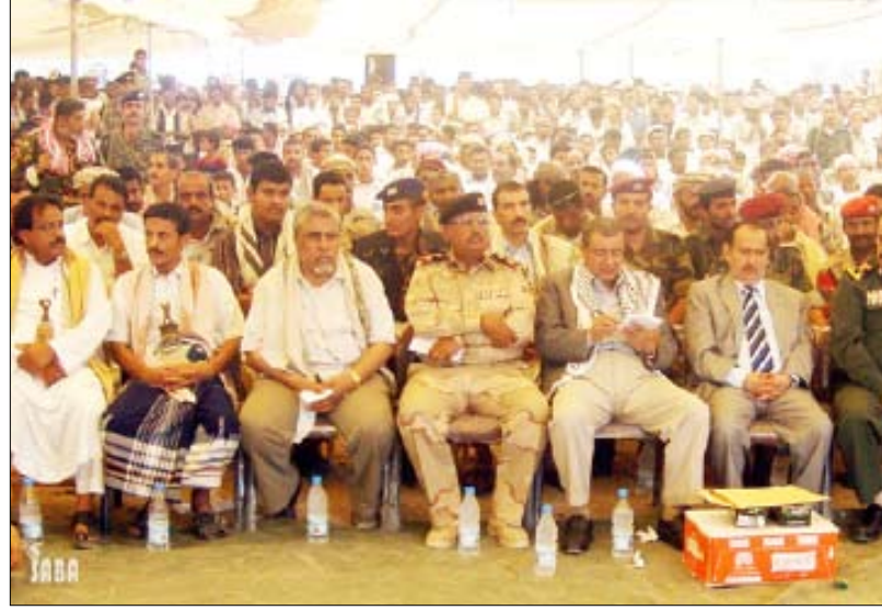
أبو رأس يشارك أبناء شبوة احتفالهم بالعيد الوطني العشرين