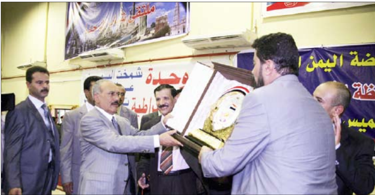
■ ملتقى الشباب يكرم رئيس الجمهورية بدرع الملتقى الماسي