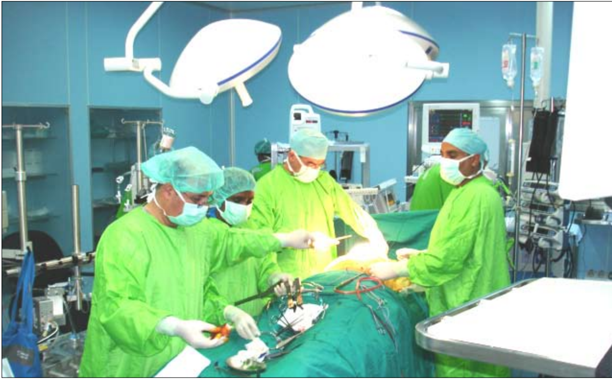
في غرفة العمليات