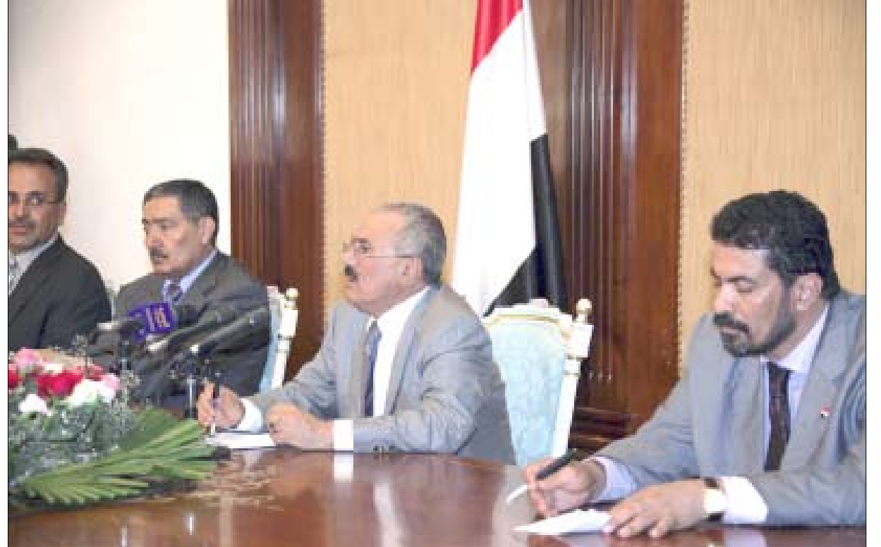
رئيس الجمهورية يلقى كلمة لدى لقائه أعضاء المجالس المحلية في عدن