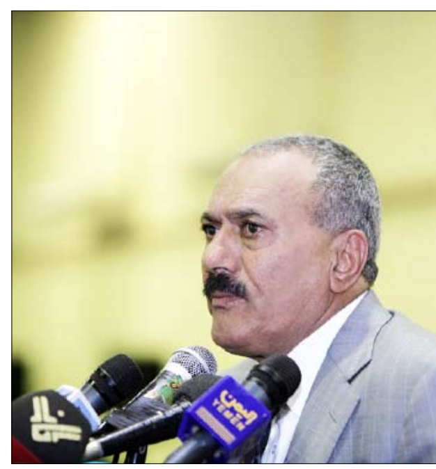
رئيس الجمهورية يلقي كلمته في الملتقى الوطني الأول لشباب الوحدة