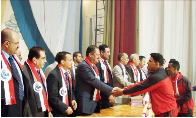
رئيس الوزراء يكرم أحد الأبطال