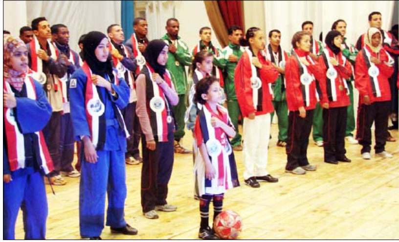
رئيس الوزراء يشهد العرض