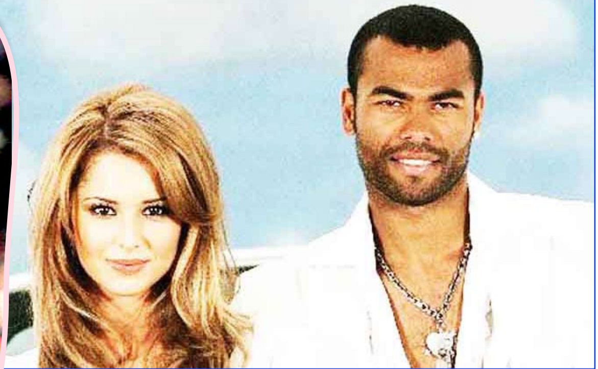
أشلي كول وطليقته شيريل كول

الأخير بنجم الإنجليز ديفيد بيكهام في برنامجهم الأسبوعي قبل عامين ونيف ليلة الملك رقم 10.