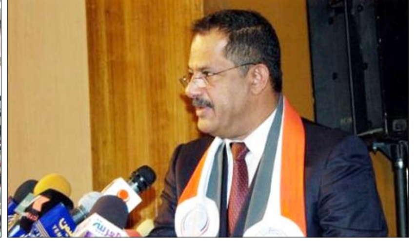
رئيس الوزراء يلقي كلمته أمام أبطال اليمن الرياضيين