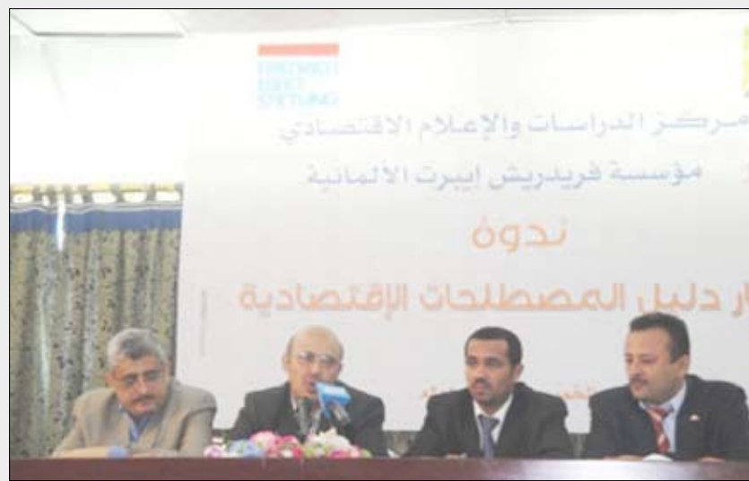
خلال افتتاح ندوة إظهار دليل المصطلحات

لم يعد فيها الاقتصاد بمفاهيمه ومؤشراته شأنًا يخص فئة محدودة بل أصبح هما يومياً للكثير من الناس. واعتبر أن الفكرة نوعية وتستحق