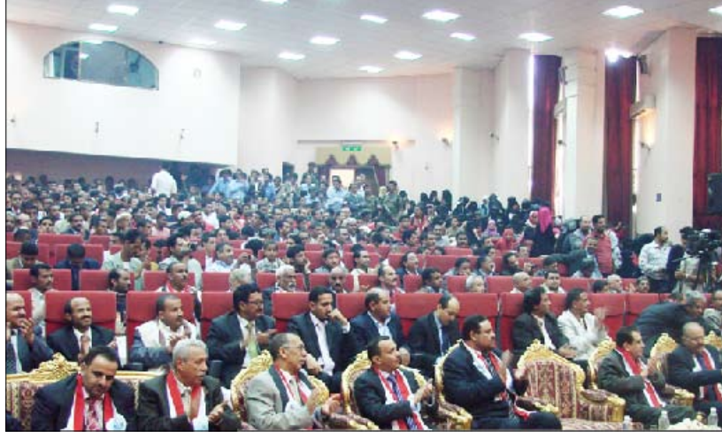
جانب من المشاركين في حفل التكريم