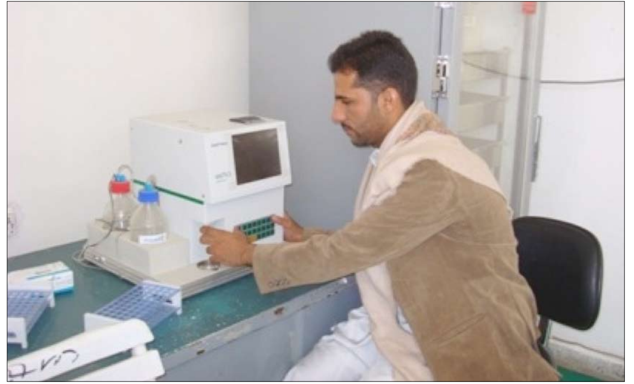
أحد العاملين الصحيين في المختبر