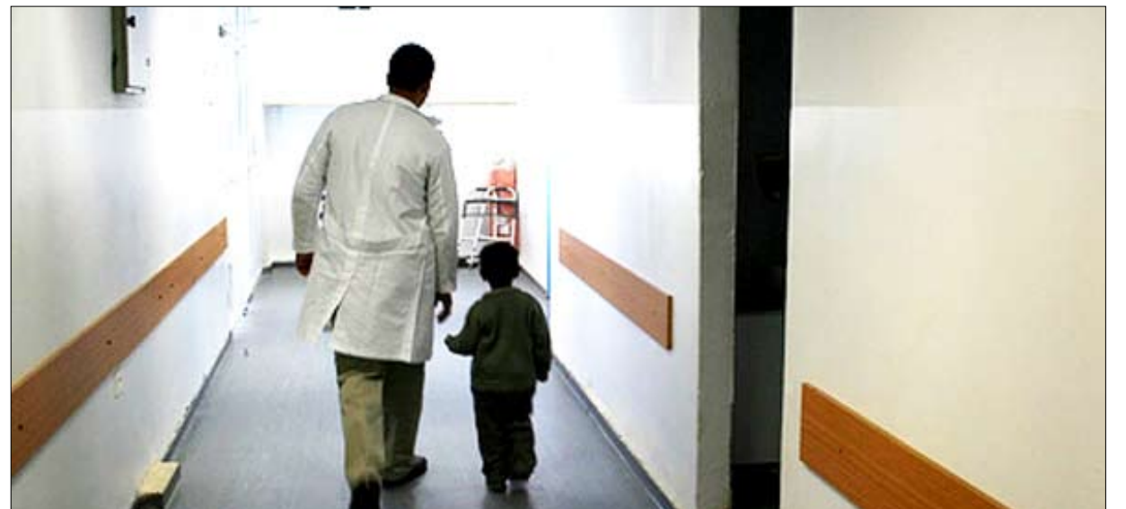
أحد ممرات المستشفى من الداخل

ما هي الآلية التي تواجهونها بما الحوادث المرورية؟ - المستشفى يمتلك قسم طوارئ قادراً على استيعاب عشرات المصابين في وقت واحد ونحن قمنا بإنشاء صيدلية خاصة بالطوارئ تقدم خدماتها مجاناً لهذه الحالات وفي حال وقوع حوادث مرورية مؤسفة فإننا نعلن حالة الطوارئ في المستشفى وينداعى جميع الأطباء والمرضى وحتى الإداريين لمواجهة ذلك، وقد حصلنا على رسائل شكر من العديد من