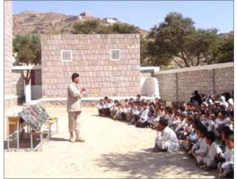
توعية طلاب المدارس