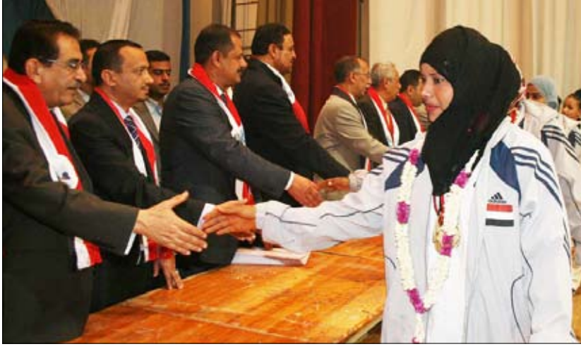
رئيس الوزراء يكرم إحدى البطلات