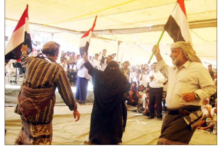
رقصة شعبية معبرة عن موروث المحافظة