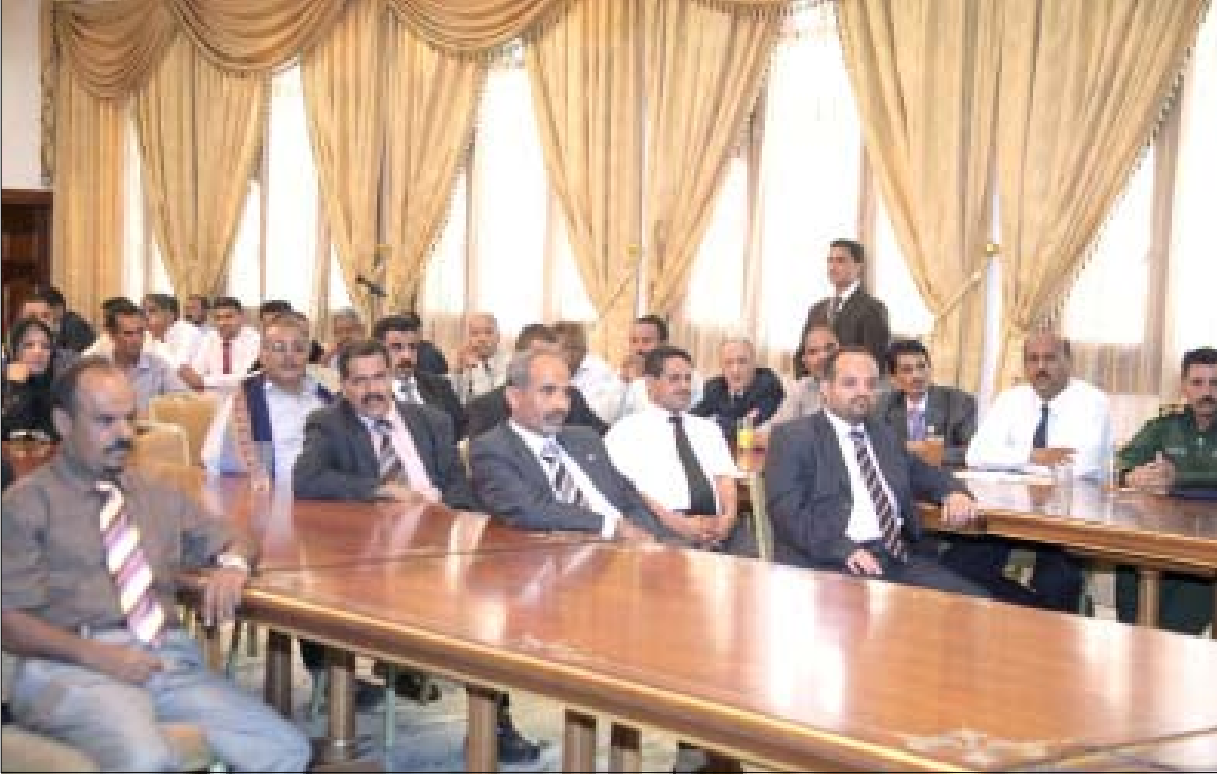
أعضاء المجالس المحلية