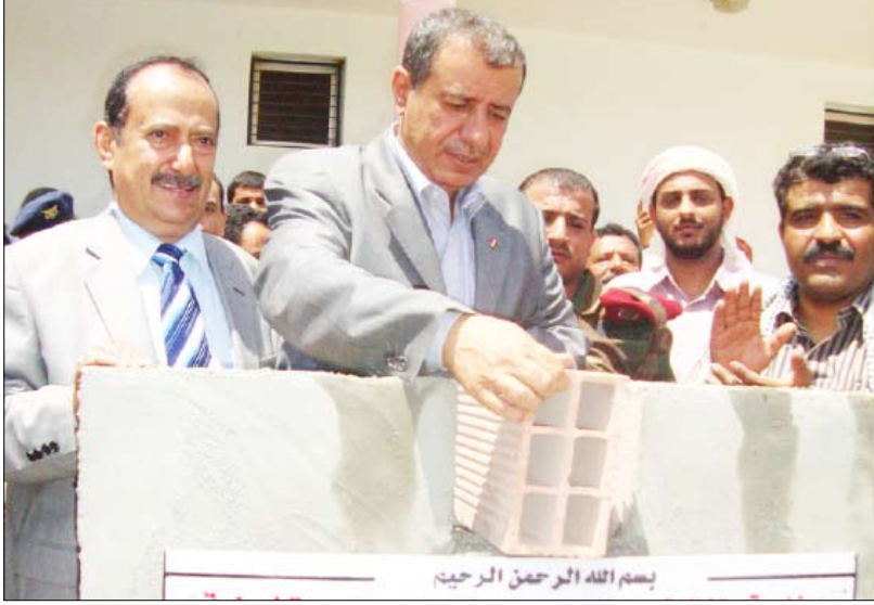
..ويضع الحجر الأساس لعدد من المشاريع