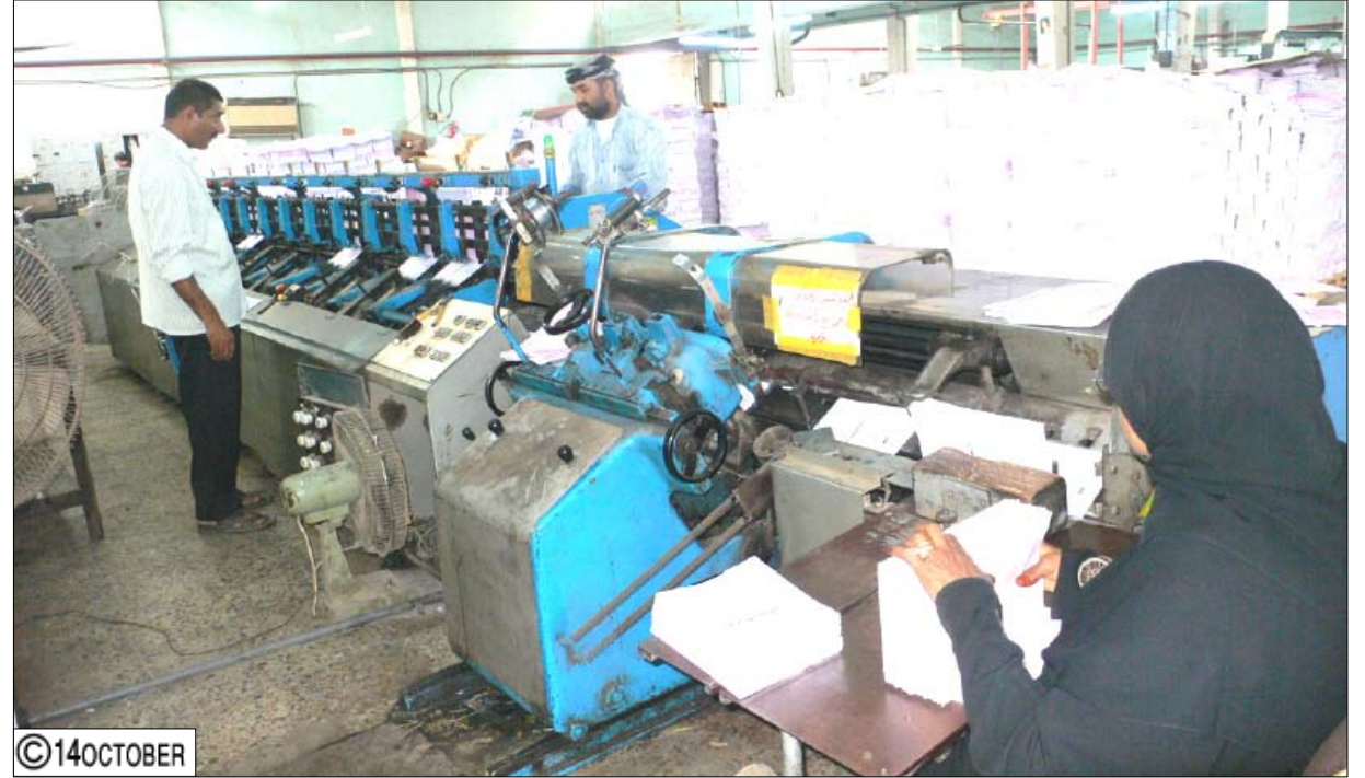
مرحلة الإشراف على الطباعة