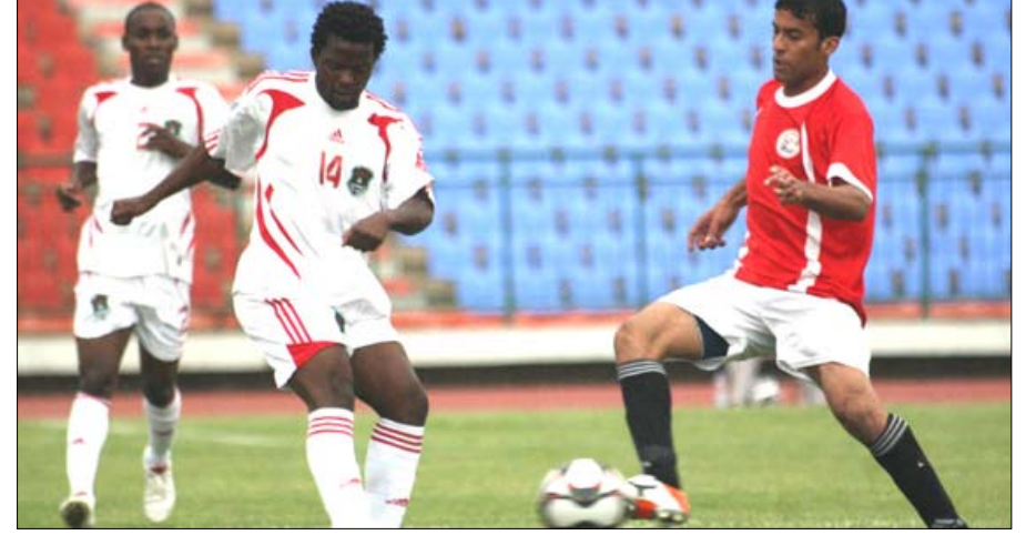
من مباراة اليمن ومالاوي