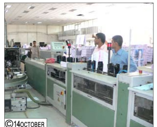
إحدى مراحل الطباعة

الخطة التطويرية للمؤسسة العامة لمطابع الكتاب المدرسي تنفذ كما هو مخطط لها حيث تم إلى الآن استعمال أغلب الأعمال الإنتاجية وإدخال الخدمات إلى المطبعة الجديدة لفرع صنعاء في منطقة (جدر) وتستكمل كافة الأعمال بما فيها التشجير والطرق الخالصة خلال النصف الأول لعام 2010م. وأضاف تم توريد ثلاث آلات جديدة لمطبعة (جدر) وهي آلة أربعة رؤوس ومقص كبير وديباسة وسيتم تركيبها في النصف الثاني لعام 2010م بالإضافة إلى توقيع عقد توريد آلة طباعة ويب مع الفرع الأوروبي لشركة جوس الأمريكية تبلغ طاقتها الإنتاجية 54000 ملزمة في الساعة وهي طاقة كبيرة جداً وتعد الأكبر من نوعها في الجمهورية اليمنية ويبلغ سعرها حوالي مليار ريال وستصل في نهاية العام كون فترة التوريد عاماً كاملاً كما تم توقيع عقد توريد خط إنتاجي متكامل (تجميع، تدبيس، تجليد، قص، مع شركة مولر مارتين) السويسرية بكلفة تصل إلى نصف مليار ريال فترة التوريد 6 أشهر أي أن الخط الإنتاجي سيصل مع آلة الطباعة الويب لتدخل المطبعة الجديدة في (جدر) الخدمة في بداية عام 2011م وبذلك ستحقق الجمهورية قفزة نوعية في طباعة الكتاب وبعد موافقة اللجنة العليا للمناقصات على وثائق مناقصة توريد ثلاث آلات طباعة مسلط أربع رؤوس (فرخ كامل) أعلنت المؤسسة في نهاية إبريل الماضي في الصحف عن المناقصة وتتراوح الطاقة