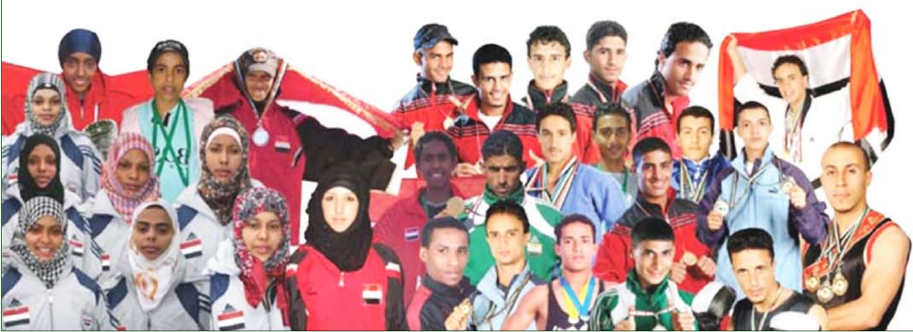
ابطال الانجازات الخارجية