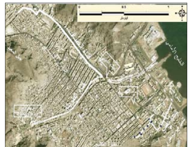
تصريف مياه الأمطار والسيول إلى البحر

أما وادي الطويلة فهو أكبر الأودية في الحوض المطري لمدينة عدن (كريتر) ويصرف عبر قناة الطويلة التي تمتد عبر منظومة الصهاريج التاريخية وتمر عبر المدينة وتنتهي عند المصب في الخليج الأمامي. وفي ادي العيدروس يتم تصريف مياه السيول والأمطار إلى البحر عبر المصب نفسه إلى الخليج الأمامي بواسطة قناة القطيع التحت أرضية للصراف المطري وهنا جدول يوضح المساحات وأطوال الجريان ومعدلات الجريان وكذا الميول لمختلف الأحواض الفرعية للوديان مع الخصائص الفيزيوجرافية التي تم تحديدها. ومن خلال اللوحة الجانبية نتعرف على أهمية نوعية المياه المعالجة في الأحواض المتقلبة في الشعب والتي أخذت على مرحلتين، وذلك بسبب متغيرات ثلاثة وهي درجة الحرارة، الأكسجين الذائب والرقم