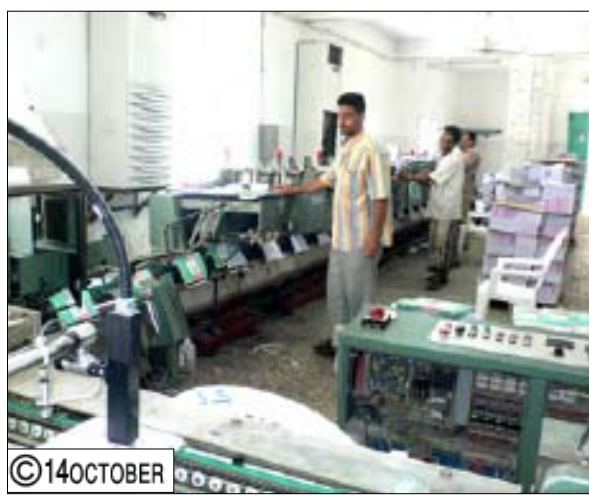
العمال يتابعون مراحل طباعة الكتاب

خطوة قامت بها القيادة الجديدة هي تحصيل المديونية وتسديد الالتزامات وهو مهمة شاقة كان من نتائجها تسديد كافة ديون المؤسسة لوزارة المالية البالغة (4.7) مليار ريال وكذا تحصيل مستحقات المؤسسة لدى الغير بعد خصم الديون المذكورة وبلغت المستحقات (5.3) مليار ريال تدفعها وزارة المالية على ثلاث دفعات (2009 - 2011م) وتبلغ قيمة كل دفعة 1.7 مليار ريال سنوياً. وقد خصصت هذه المبالغ الضخمة مع ما تم تحقيقه من وفورات نتيجة ترشيد العمل في المؤسسة لتمويل برنامج تطوري شامل ينفذ خلال ثلاث سنوات بتحويل ذاتي بإجمالي استثمارات بلغت 7 مليارات ريال للمرحلة الأولى على أن توضع خطة تطويرية ثانية بعد عام 2012م.