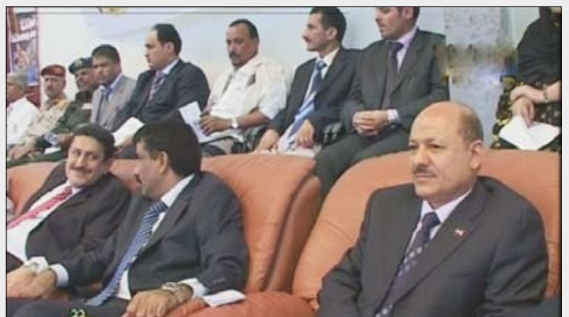
د. العلمي يحضر المهرجان الجماهيري احتفاءً بالعيد الوطني