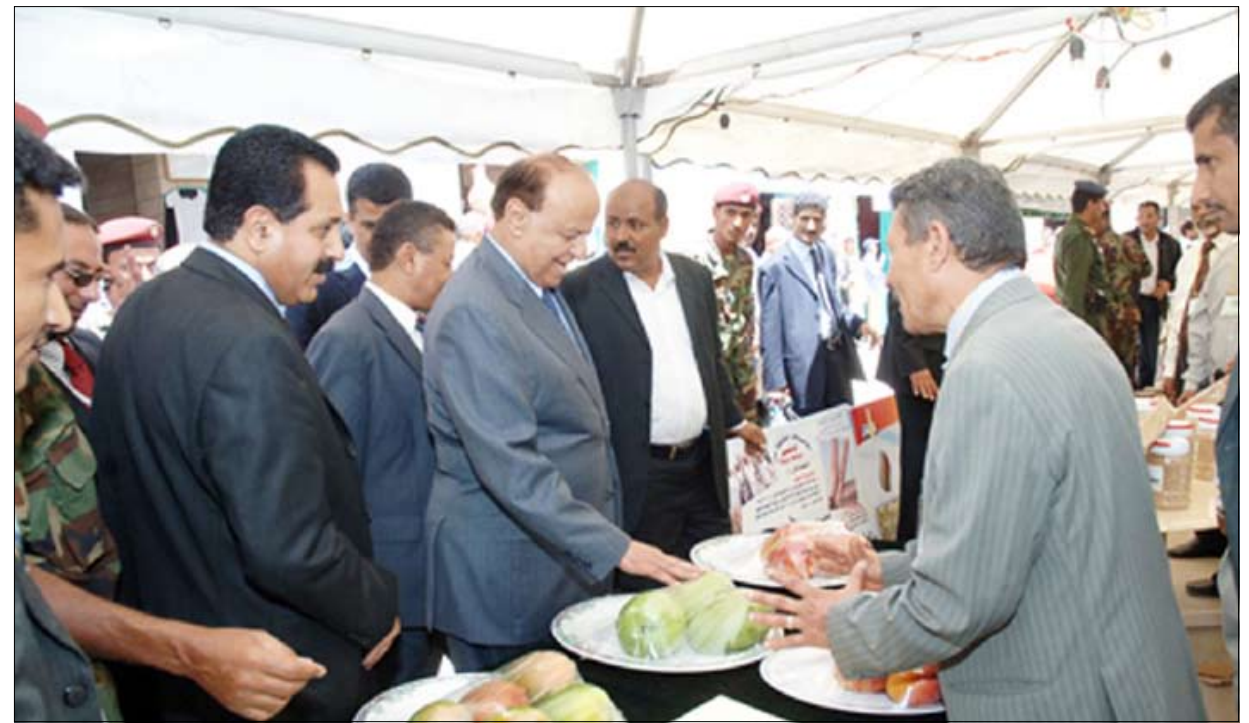
نائب الرئيس ووزير الزراعة يفتتحان المعرض الزراعي