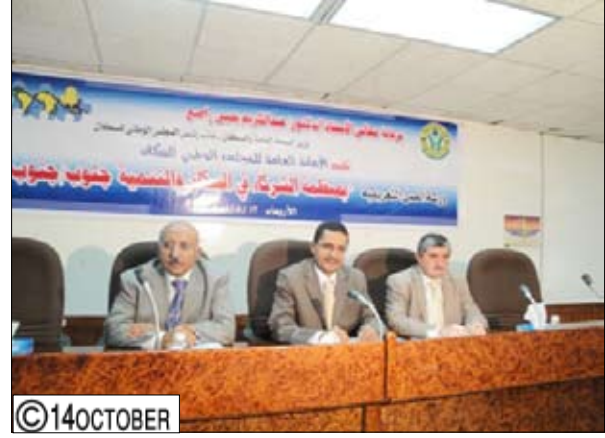
لدى افتتاح الورشة التعريفية بمنظمة الشركاء في السكان والتنمية