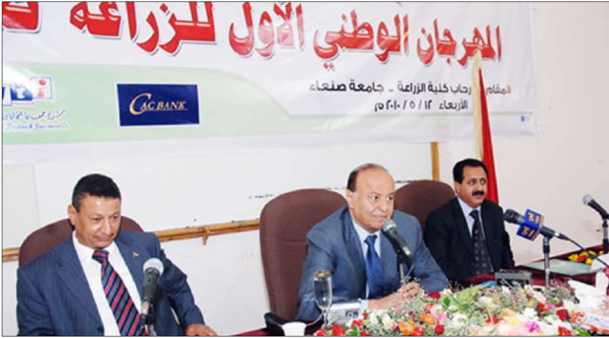
نائب الرئيس يدشن المهرجان الوطني الأول للزراعة .