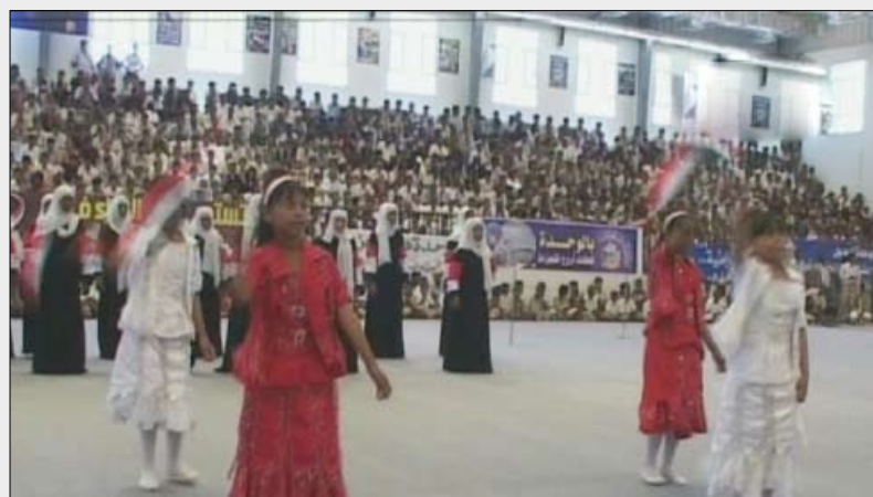
من فعاليات المهرجان