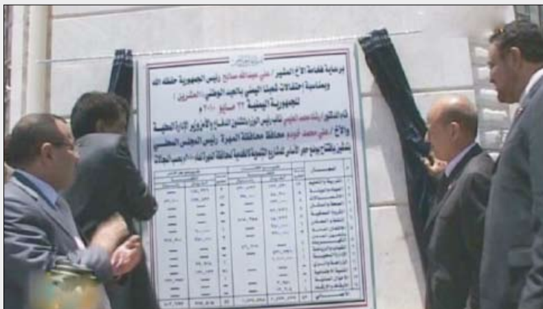
.. ويفتتح عدداً من المشاريع الخدمية والإنمائية