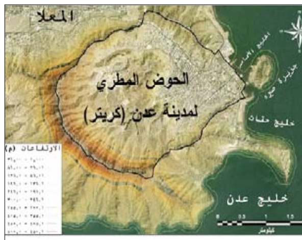
الحوض المطري لمدينة كريتر

لذلك نقول ونحن في دهشة من الذي يجري لهذه المدينة.. اتقوا الله يا ناس، وجنبا المدينة كوارثكم، لا تغلقوا علينا آخر متنفس الذي هو ليس لعن وحدها، بل للوطن كله، انهضوا إلى المحب في هذه المساحات، عشق الرؤية والتلمي بما خلق الله لنا من أماكن وتطور طبيعية أسرة، لا تدعونا أسيري تلك الشطحات القاتلة، فكم يقول الناس ومصالحهم وليس بعقولكم وحكم ومصالحكم انتم فقط. الآن وقد رفع مجلس حماية البيئة ببعن قضية أمام المحاكم وما تزال تراوح.. نتمنى أن تنحصر العدة بإيقاف هذه المشاريع الخبيثة والضارة بنا وبمصالحنا وبوطننا.. والا فإن الكوارث ستحل بنا وبمدينتنا.. وصدقونا إن حبس ومضايقة البحر، يؤدي إلى فيضانات وغرق للمدن التي هي شبه جزر مثل عدن... لا قدر الله، فهل نعي ذلك؟! ليحفظ الله عدن من الطمع والجشع ومن عبث العائنين، وليجنبا الله الكوارث إنه سميع مجيب.