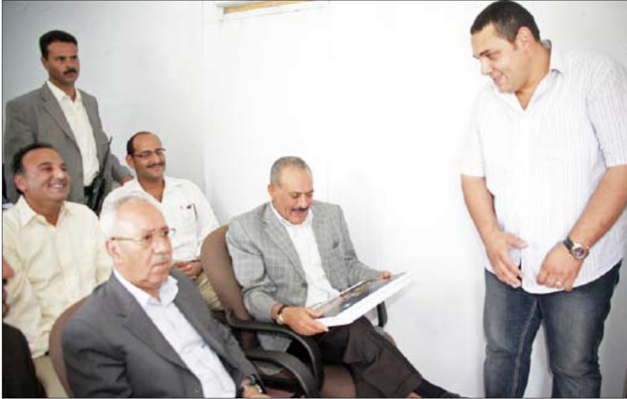
.. ويطلع على صور كيف يكون الفندق