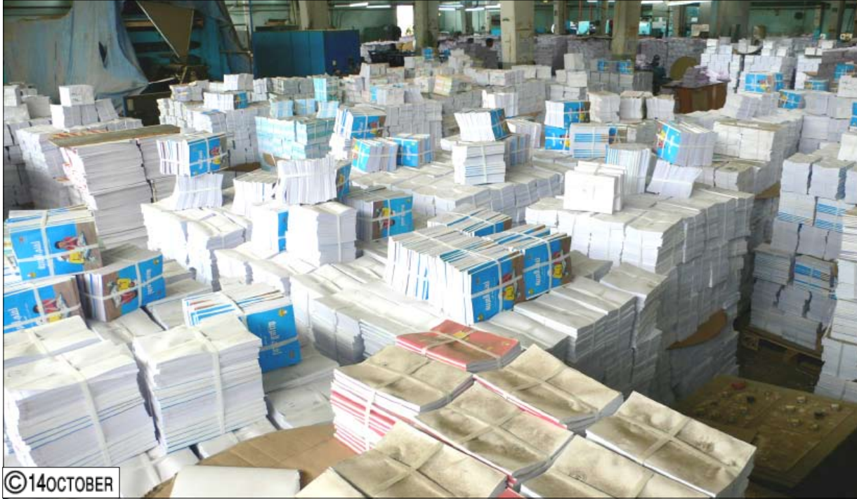
الكتاب المدرسي في مرحلة الانتهاء من طباعته