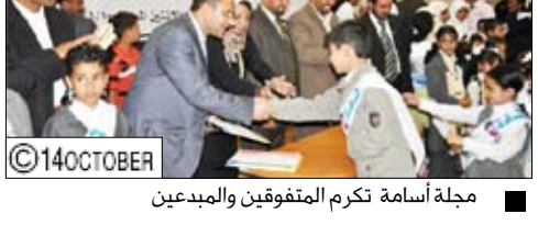
مجلة أسامة تكريم المتفوقين والمبدعين