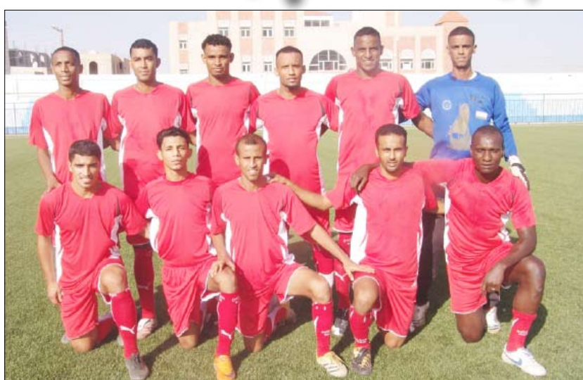
■ فريق التلال لكرة القدم

بإحدى / عدن / سبأ : تأهل فريق التلال إلى دوري أبطال المحافظات لكرة القدم بعد فوزه أمس على فريق شباب المنصورة بثلاث أهداف مقابل لا شيء في المباراة النهائية للتصفيات التمهيدية لاندية محافظات عدن التي جرت بالصالة الرياضية المغلقة بعدن. وجاء تأهل التلال في التصفيات التي شاركت فيها خمسة أندية " التلال ، الجلاء ، النصر ، الروضة ، المنصورة " بعد تغلبه على فريق الروضة 3 / صفر، فيما تغلب فريق الجلاء على النصر 3 / صفر. وبذلك أصبح فريق التلال بالمركز الأول وسيمثل محافظة عدن في دوري أبطال المحافظات الذي سيقام في العاصمة صنعاء في موعد سيحدده الاتحاد العام لكرة الطاولة في وقت لاحق.