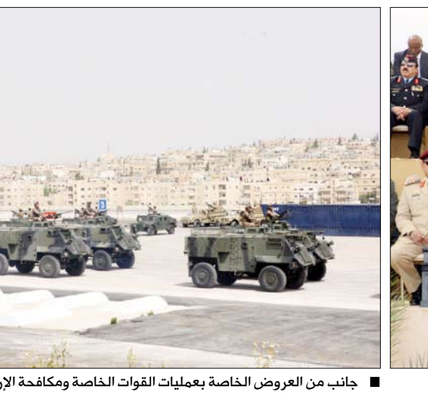
جانب من العروض الخاصة بعمليات القوات الخاصة ومكافحة الإرهاب

بحث الزعيمان خلال اللقاء جوانب العلاقات ومجالات التعاون المشترك بين البلدين وسبل تعزيزها وتطويرها نحو آفاق أوسع وعلى مختلف الأصعدة . كما بحثا المستجدات العربية والإقليمية، وأكد الحرس على تنسيق جهود البلدين لتفعيل العمل العربي المشترك لما فيه خدمة وتعزيز التضامن بين أبناء الأمة. وجدد العاهل الأردني ترحيبه بفخامة الأخ الرئيس في الأردن، مشيراً إلى أن هذه الزيارة سوف تفتح آفاقاً أوسع للتعاون بين البلدين الشقيقين. مؤكداً استعداد الأردن وحرصها على تعزيز العلاقات الأخوية ومجالات التعاون المشترك بين البلدين .