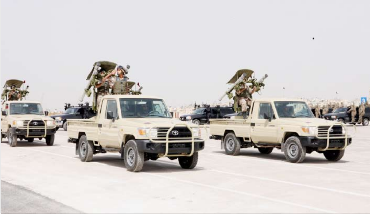
جانب من العروض الخاصة بعمليات القوات الخاصة ومكافحة الإرهاب