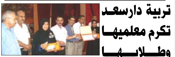
تربية دارسعد تكرم معلميها وطلابها المتفوقين علمياً ورياضياً وإبداعياً