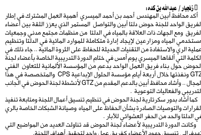
الميسري يلقي كلمته في ختام دورة بناء فريق عمل لجنة حوض دلتا أبين

أكد محافظ أبين المهندس أحمد بن أحمد الميسري أهمية العمل المشترك في إطار الفريق الواحد للجنة حوض دلتا أبين والتواصل المستمر الذي يعزز الثقة بين أعضاء الفريق ومع الجهات ذات العلاقة بالمياه في الدلتا من منظمات مجتمع مدني وجمعيات مستخدمي المياه ومزارعين لإيجاد إدارة متكاملة للموارد المائية في الدلتا وتنظيم عملية الري والاستفادة من التقنيات الحديثة للحفاظ على الثروة المائية.. جاء ذلك في الكلمة التي ألقاها الميسري يوم أمس في ختام الدورة التدريبية الخاصة بأعضاء لجنة الحوض حول بناء فريق العمل الواحد بدعم من المؤسسة الألمانية للتعاون الفني GTZ وفندته خلال أربعة أيام مؤسسة الحلول الإبداعية OPS والمتخصصة في هذا المجال.. وأشاد محافظ أبين بال دعم المقدم من GTZ لأنشطة لجنة الحوض في الجانب التدريبي والفعاليات التوعوية. كما أشاد بدور سكرتارية لجنة الحوض في تنظيم وتنسيق أعمال اللجنة ومتابعة تنفيذ القرارات والتوصيات الصادرة بشأن الحفاظ على المياه وصيانة الشبكات الخاصة بالري في الدلتا والحد من الخسر العشوائي لأبار. وكانت الدورة التدريبية لأعضاء لجنة الحوض قد تناولت العديد من المواضيع التي تهدف إلى تنسيق جهود الأعضاء كفريق عمل واحد لتحقيق أهداف اللجنة.