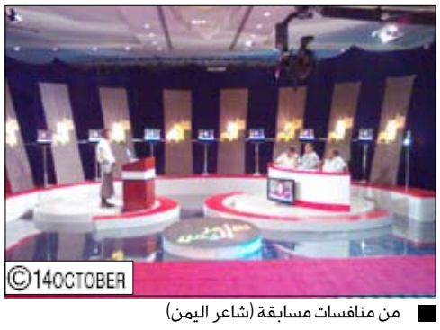
من منافسات مسابقة (شاعر اليمن)