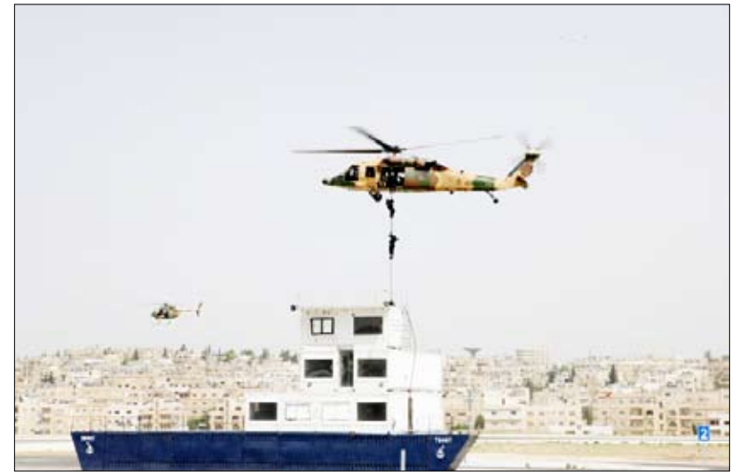
جانب من العروض الخاصة بعمليات القوات الخاصة ومكافحة الإرهاب