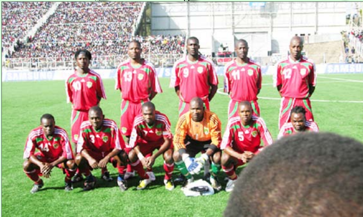
■ منتخب ملاوي