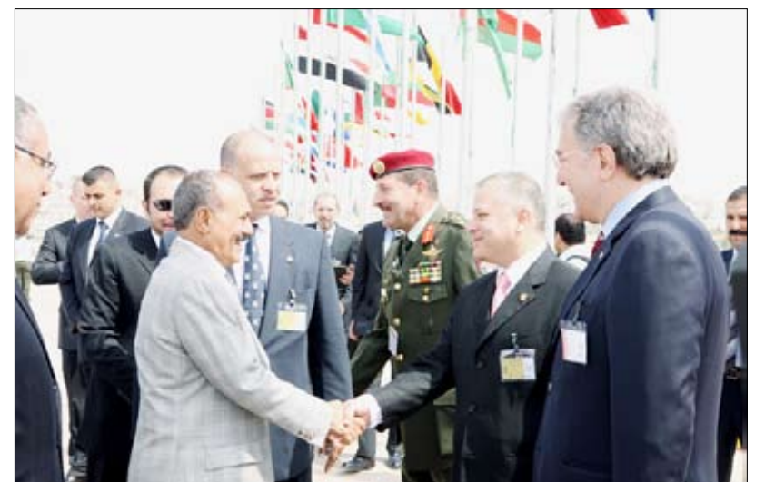
رئيس الجمهورية خلال المشاركة في معرض سوفكس 2010م