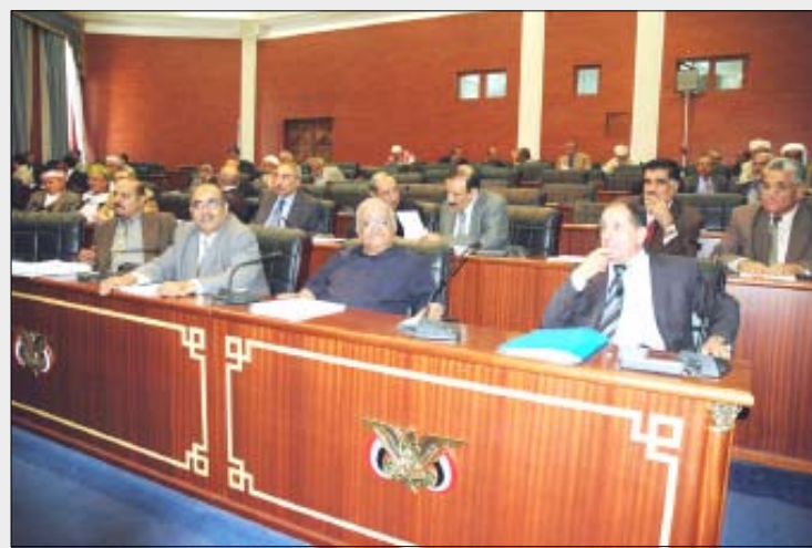
جانب من أعضاء مجلس الشورى