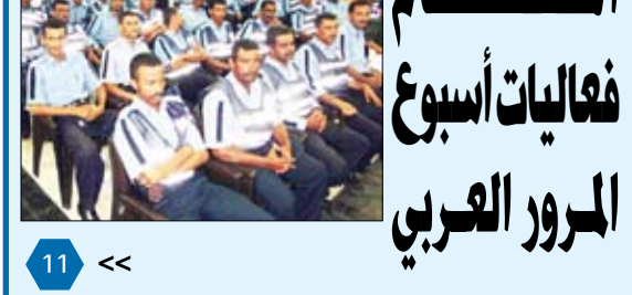
أقامت احتفالاً بهيماً بمناسبة الذكرى الـ 20 لإعادة تحقيق الوحدة المباركة