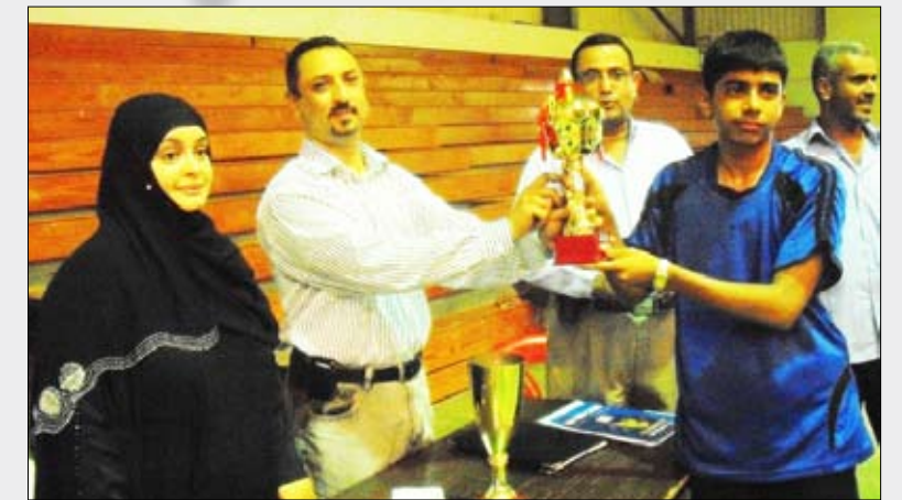
تكريم أبطال صيرة للتعليم الأساسي والثانوي الأبطال