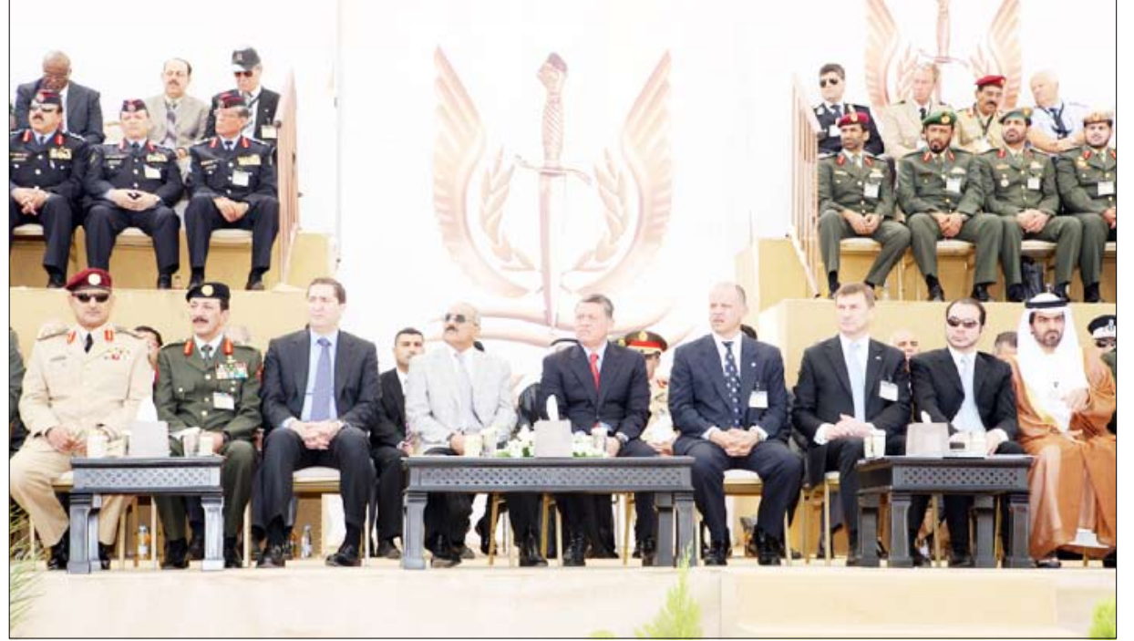
رئيس الجمهورية خلال حضوره افتتاح معرض (سوفكس)