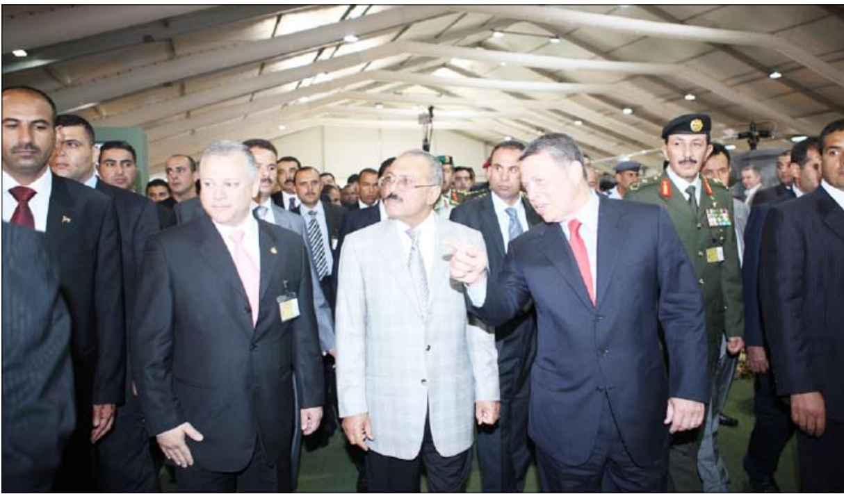
رئيس الجمهورية يقوم بزيارة مركز عبدالله الثاني للتصميم والتطوير