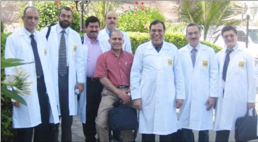
القافلة الطبية المصرية

وجراحة العظام وجراحة العيون والرمد. تجدر الإشارة إلى أن مؤسسة MTN الخيرية ترعى القافلة الطبية المصرية للمرة الثالثة حيث تم رعاية القافلتين الطبيتين الأولى والى مدينة عدن في العامين 2008 و 2009م.