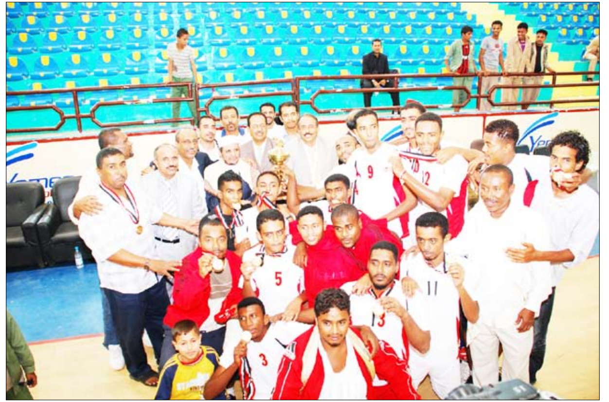
فرحة فريق طائرة حسان بالصعود للدرجة الأولى لأول مرة في تاريخهم