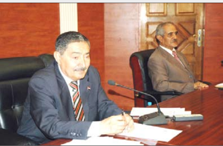
عبدالغني يترأس اجتماع مجلس الشورى