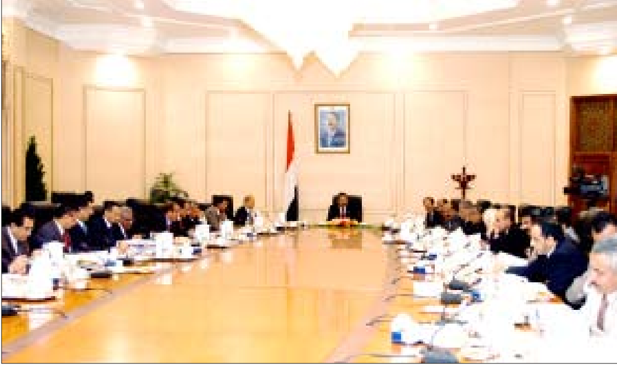
د. مجور يترأس اجتماع مجلس الوزراء