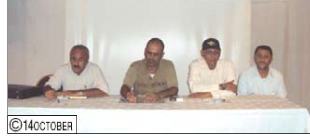
الميسري يلقي كلمته في ختام دورة بناء فريق عمل لجنة حوض دلتا أبين

أكد محافظ أبين المهندس أحمد بن أحمد الميسري أهمية العمل المشترك في إطار الفريق الواحد للجنة حوض دلتا أبين والتواصل المستمر الذي يعزز الثقة بين أعضاء الفريق ومع الجهات ذات العلاقة بالمياه في الدلتا من منظمات مجتمع مدني وجمعيات مستخدمي المياه ومزارعين لإيجاد إدارة متكاملة للموارد المائية في الدلتا وتنظيم عملية الري والاستفادة من التقنيات الحديثة للحفاظ على الثروة المائية.. جاء ذلك في الكلمة التي ألقاها الميسري يوم أمس في ختام الدورة التدريبية الخاصة بأعضاء لجنة الحوض حول بناء فريق العمل الواحد بدعم من المؤسسة الألمانية للتعاون الفني GTZ وفندته خلال أربعة أيام مؤسسة الحلول الإبداعية OPS والمتخصصة في هذا المجال.. وأشاد محافظ أبين بال دعم المقدم من GTZ لأنشطة لجنة الحوض في الجانب التدريبي والفعاليات التوعوية. كما أشاد بدور سكرتارية لجنة الحوض في تنظيم وتنسيق أعمال اللجنة ومتابعة تنفيذ القرارات والتوصيات الصادرة بشأن الحفاظ على المياه وصيانة الشبكات الخاصة بالري في الدلتا والحد من الخسر العشوائي لأبار. وكانت الدورة التدريبية لأعضاء لجنة الحوض قد تناولت العديد من المواضيع التي تهدف إلى تنسيق جهود الأعضاء كفريق عمل واحد لتحقيق أهداف اللجنة.