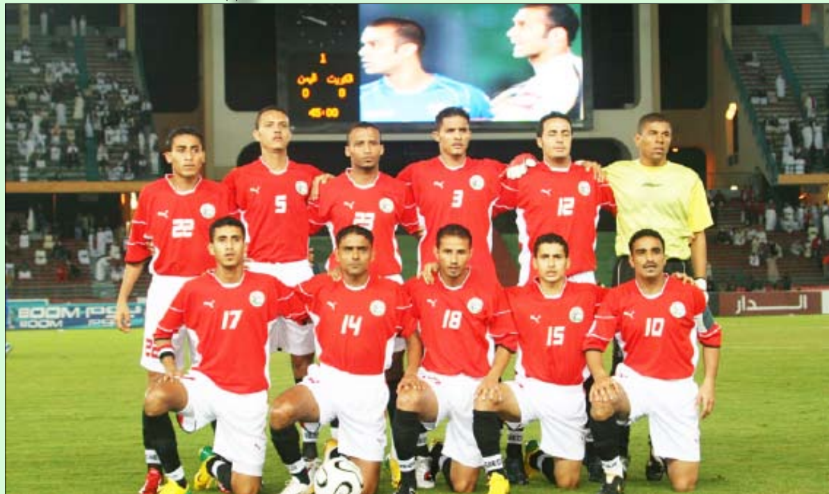
■ المنتخب الوطني لكرة القدم