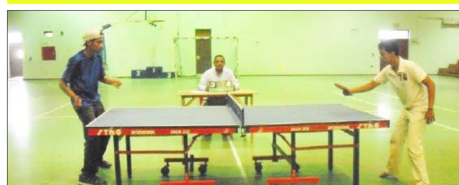
■ من الأرشيف