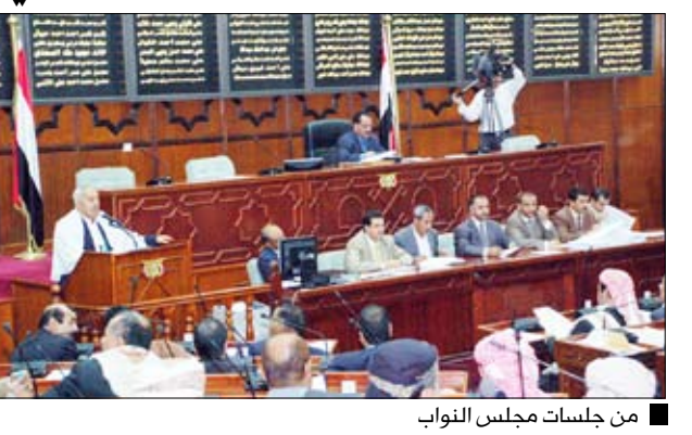
من جلسات مجلس النواب

□ صنعاء / سيا : قام فخامة الأخ الرئيس على عبدالله صالح رئيس الجمهورية القائد الأعلى للقوات المسلحة أمس بزيارة إلى معسكر الأمن المركزي وكان في استقباله الإخوة قيادة قوات الأمن المركزي . وقد شهد فخامة العرض العسكري الذي أقيم بمناسبة احتفالات شعبنا بالعيد الوطني الـ 20 للجمهورية اليمنية الثانی والعشرين من مايو. وعودة بعض كتائب الأمن المركزي إلى معسكرها الدائم بعد أداؤها مهامها في عدد من المحافظات والمديریات. وتحدث فخامة الأخ الرئيس إلى الإخوة الضباط والصف والجنود، حيث هناهم بحلول العيد الوطني الـ 20 لإعادة تحقيق وحدة الوطن وقيام الجمهورية اليمنية.. مشيراً إلى ما تحقق للوطن في ظل وحدته المباركة من إنجازات وتحولات وعلى مختلف الأصعدة. وقال " لقد أديتم واجباتكم بكل كفاءة واقتدار وإخلاص وتفان .. وكان دور الأمن المركزي دوراً إيجابياً ورائعاً وممتازاً. ونحن نؤمن عليها ما قامت به وحدات الأمن المركزي في تثبيت الأمن والاستقرار والسكينة العامة. وشدد على ضرورة الابتعاد عن تناوُل القات أثناء أداء الواجب وبما يحافظ على مظهر الجنود ويمكنهم من أداء واجباتهم بروح انضباطية عالية.. مشيراً إلى الأضرار الكثيرة للقات سواء أكان على الصحة أو المال . (التفاصيل ص3)