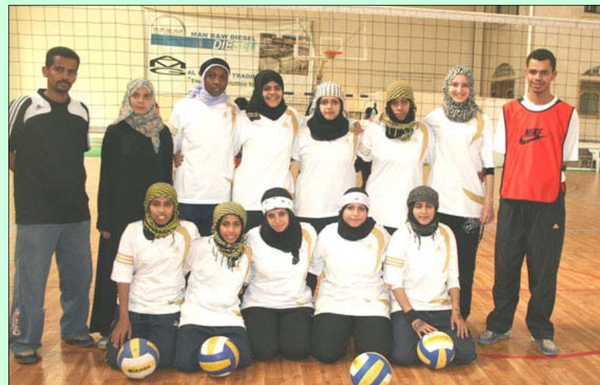
فريق الأمانة لكرة الطائرة

منتخبا الأمانة وعدن، و في المباراة الثانية يتقابل منتخبا الحديدية وتعز. وتختتم غدا الإثنين البطولة بإقامة لقاءي والميداليات.