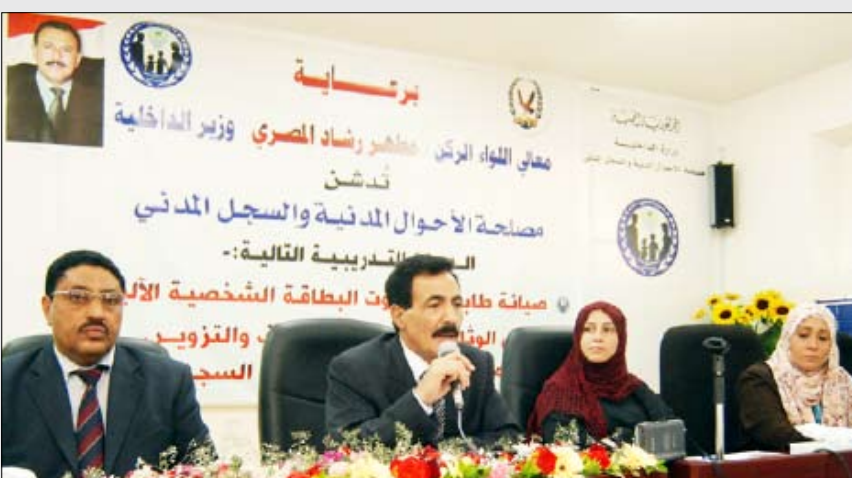
وزير الداخلية يلقي كلمة خلال دورة الأحوال المدنية