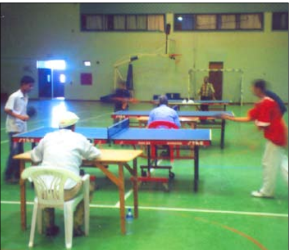
من مباريات بطولة عدن

□ عدن / عبد الجبار نويصر : □ تصوير / فهد العكبي :