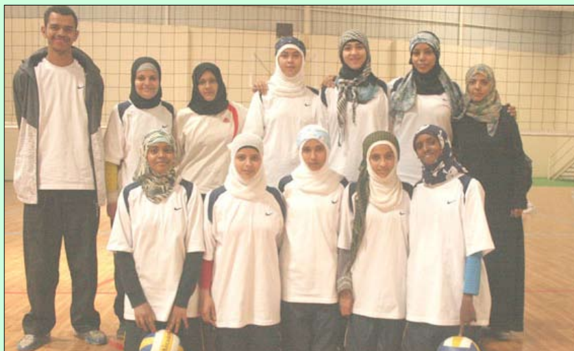
فريق صنعاء لكرة الطائرة