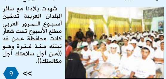
شهدت بلادنا مع سائر البلدان العربية تدهين أسبوع المرور العربي مطلع الأسبوع تحت شعار كانت محافظة عدن قد تبنته منذ فترة وهو (من أجل سلامتك أجل مكالمتك).