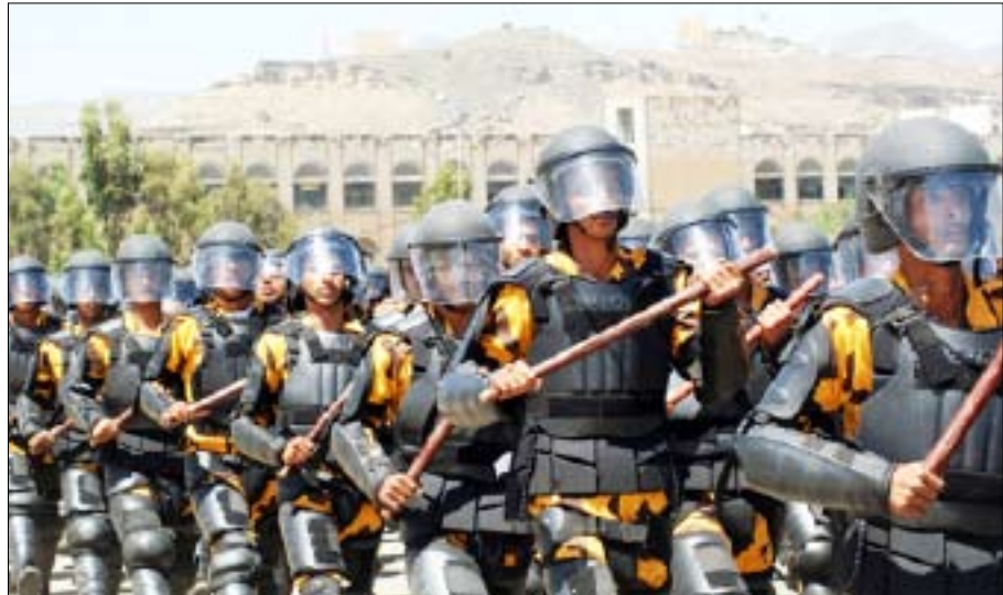
جانب من الوحدات في الامن المركزي

صنعاء / سبأ: قام فخامة الأخ الرئيس علي عبدالله صالح رئيس الجمهورية القائد الأعلى للقوات المسلحة أمس بزيارة إلى معسكر الأمن المركزي وكان في استقباله الإخوة قيادة قوات الأمن المركزي.