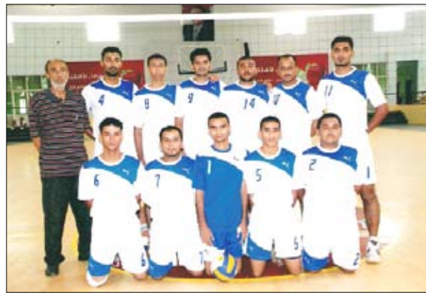
فريق هلال الحديدية