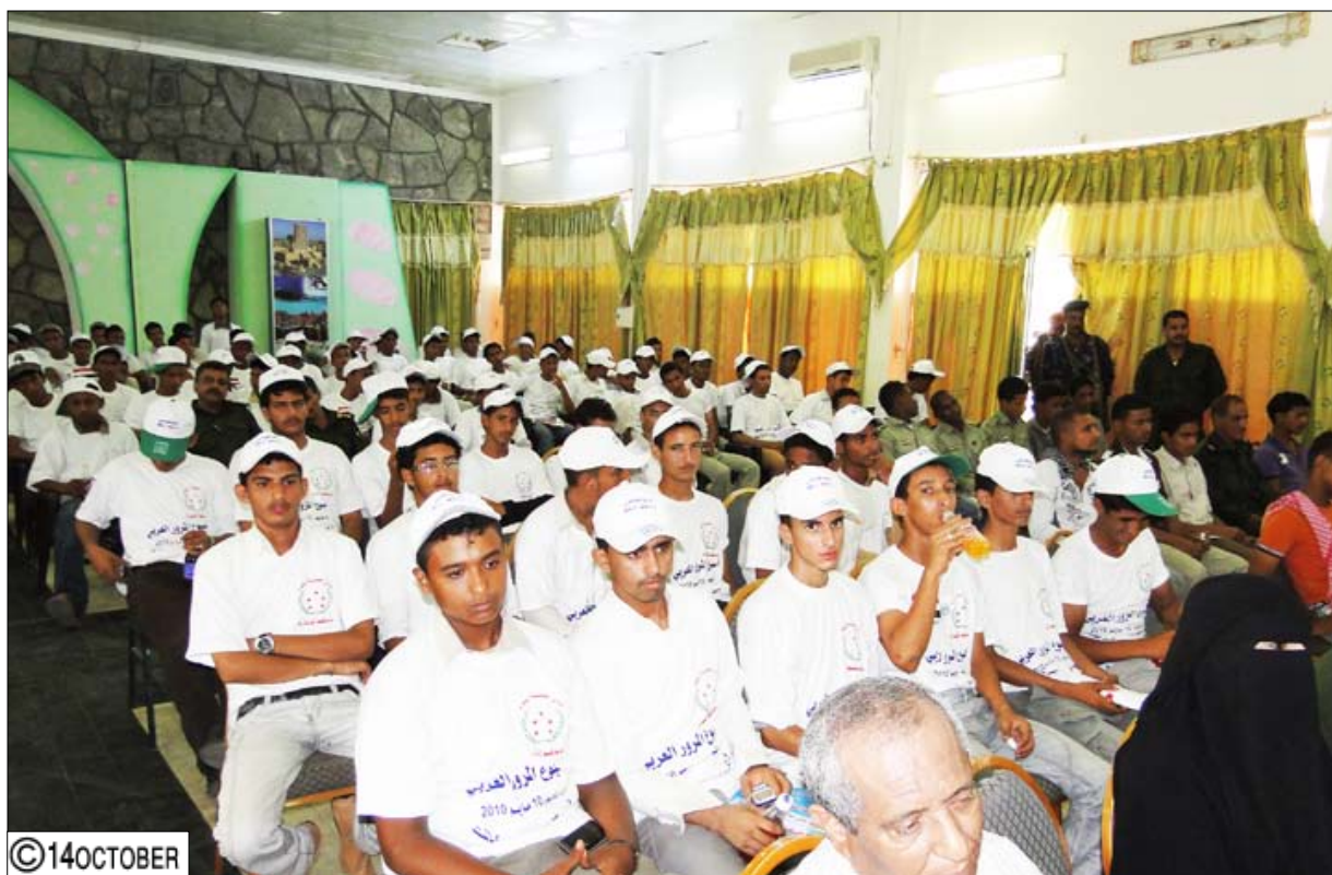
جانب من الحضور في حفل التدشين

شهدات بلادنا مع سائر البلدان العربية تدشين أسبوع المرور العربي مطلع الأسبوع تحت شعار كانت محافظة عدن قد تبنته منذ فترة وهو (من أجل سلامتك أجل مكالمتك).