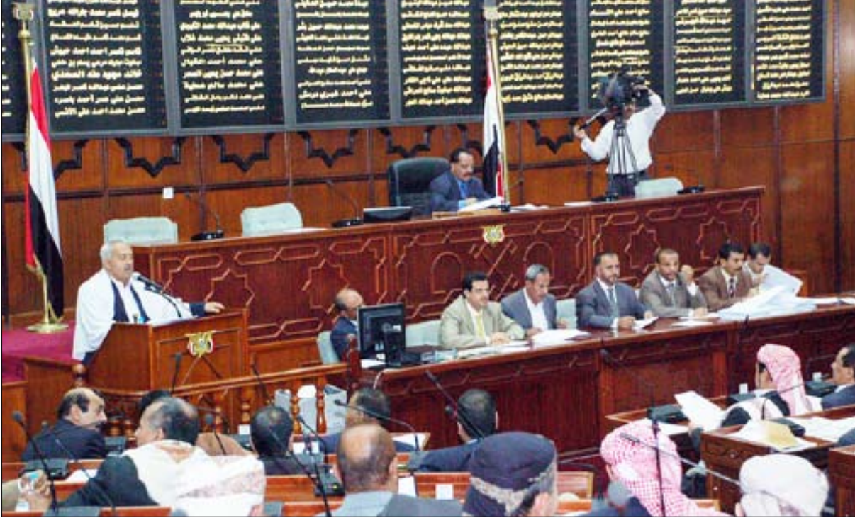
■ من جلسات مجلس النواب أمس