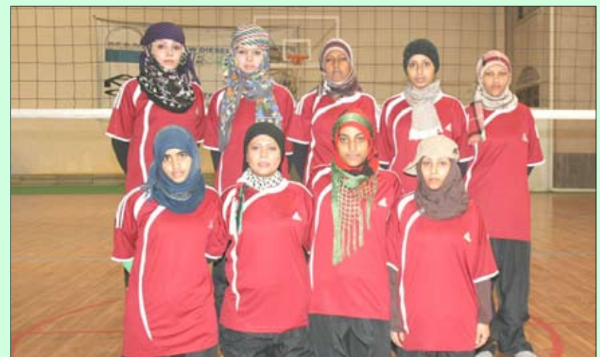
فريق عدن لكرة الطائرة