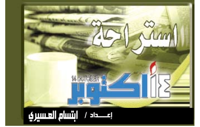
إعداد / إنسان العسيري

كشفت تقرير طبي حديث عن تضاعف احتمالات تعرض المدخنين لفقدان أسنانهم ، مقارنة بأقرانهم غير المدخنين. وأفاد التقرير الصادر عن الغرفة الألمانية لأطباء الأسنان بالتعاون مع المركز الألماني لأبحاث السرطان، بأن المدخنين يعانون بصورة أكبر من أمراض اللثة التي تؤدي إلى تآكل الأسنان ، وعزا الباحثون ذلك إلى المواد الضارة الموجودة في دخان التبغ والتي من شأنها تسارع وتيرة تدمير عظام الفك.