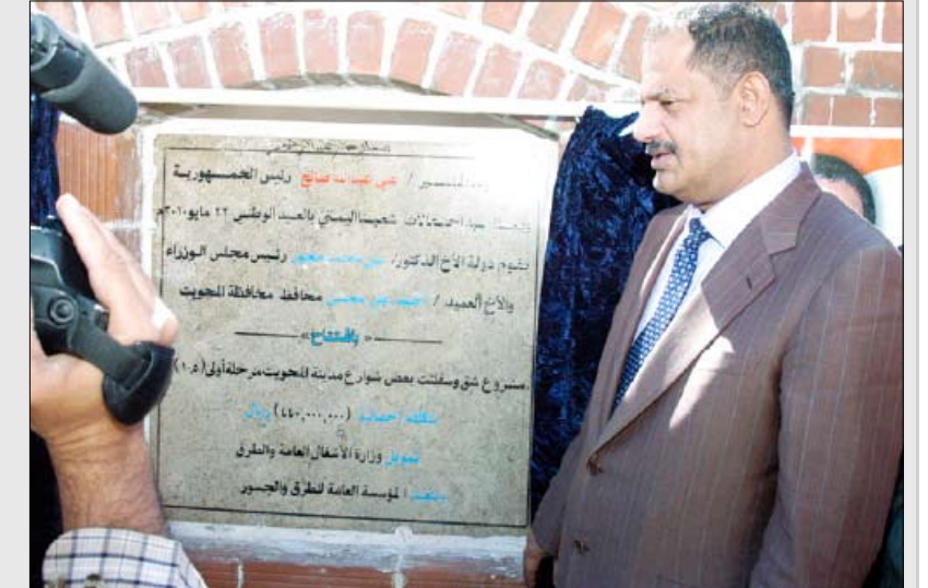
■ د. مجور خلال افتتاح ووضع الحجر الأساس لمشاريع تنموية وخدمية في المحويت