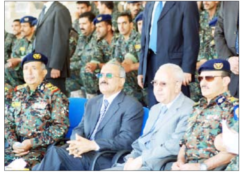
رئيس الجمهورية يشهد العرض العسكري