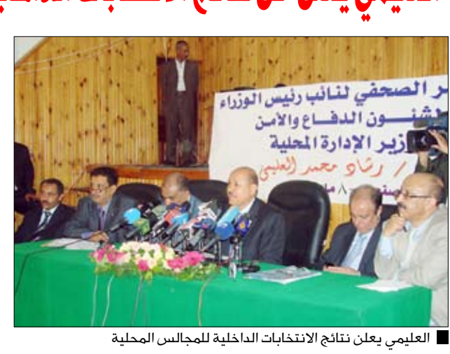
العلمي يعلن نتائج الانتخابات الداخلية للمجالس المحلية

□ صنعاء / سيا : أعلن نائب رئيس الوزراء لشؤون الدفاع والأمن وزير الإدارة المحلية الدكتور رشاد العلمي يوم أمس السبت عن نتائج الانتخابات الداخلية للمجالس المحلية في 350 وحدة إدارية على مستوى العاصمة ومحافظات الجمهورية. وأوضح الدكتور العلمي في المؤتمر الصحفي الذي عقده يوم أمس السبت بوزارة الإدارة المحلية وحضره وزير الإعلام حسن اللوزي وعدد من ممثلي وسائل الإعلام المحلية والعربية والدولية أن الانتخابات التي جرت في الخامس من مايو أسفرت عن نجاح الانتخابات الداخلية