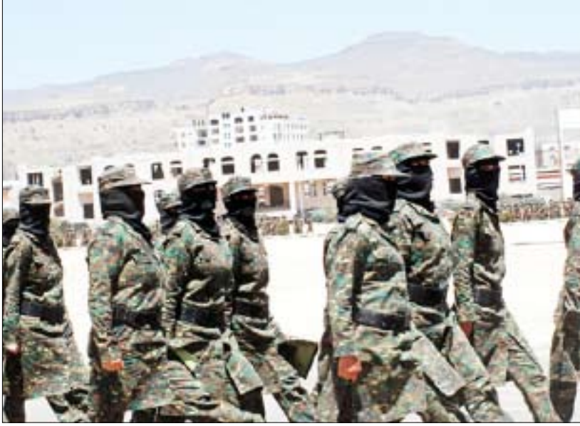
العنصر النسائي في الامن المركزي