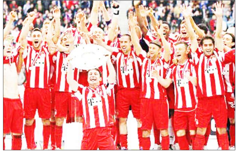
بايرن ميونخ يتوج بطلاً للمرة الثانية