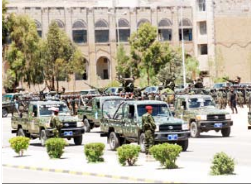
جانب من الأفراد و أليات الامن المركزي