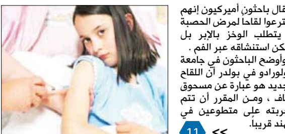
قال باحثون أميركيون إنهم اخترعوا لقاحاً لمرض الحصبة لا يتطلب الحقن بالإبر بل يمكن استنشاقه عبر الفم.