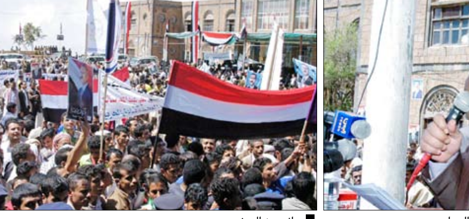
رئيس الوزراء في كلمته في المهرجان الجماهيري

□ المحويت / سيا : أكد رئيس مجلس الوزراء الدكتور علي محمد مجور أن اتفاق فبراير هو المدخل الأمثل للمضي في طريق الإصلاح السياسي على قاعدة الشراكة الوطنية جاء ذلك في كلمته التي القاها أمس لدى حضوره المهرجان الجماهيري الذي أقيم بمحافظة المحويت بمناسبة الاحتفالات بالعيد الوطني الـ 20 للجمهورية اليمنية "22 مايو". وأشار في كلمته إلى أن الإنجازات التنموية والخدبية التي تحققت في المحافظة تؤكد بقوة أن محافظة المحويت كانت وستظل محل اهتمام ورعاية الدولة والقيادة السياسية للحكومة وقال " إننا نعيش هذه الأيام أفرح العيد الوطني الـ 20 للجمهورية اليمنية "22 مايو" هذه الذكرى التي تؤرخ لواحد من أعظم إنجازات اليمن المجيدة، إنها الوحدة اليمنية هذا الإنجاز الأستراتيجي العظيم الذي جسده عزم الرجال المحصلين وحنكة القادة الملهمين". وتابع الوحدة تاج الإنجازات الخالدة لليمن ووعده الثورة الذي تحقق في لحظة تاريخية فارقة صُنَّعَ "الوطن" في ظلها تحولات مؤثرة في حاضر ومستقبله