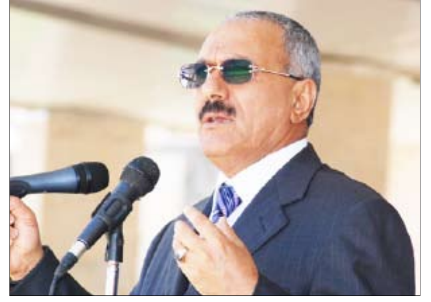
رئيس الجمهورية يلقي كلمته أمام أفراد معسكر الامن المركزي