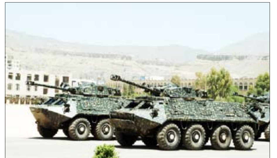
بعض أليات الامن المركزي

وقد تحدث فخامة الأخ الرئيس إلى الإخوة الضباط والصف والجنود ، حيث هنأهم بحلول العيد الوطني الـ 20 لإعادة تحقيق وحدة الوطن وقيام الجمهورية اليمنية.. مشيراً إلى ما تحقق للوطن في ظل وحدته المباركة من إنجازات وتحولات وعلى مختلف الأصعدة .. مشيداً بالدور الذي اضطلعت به تلك الوحدات في أداء مهامها وواجباتها في المناطق والمواقع التي أرسلت إليها من أجل الحفاظ على الأمن والاستقرار والسكينة العامة . وقال " لقد أنيتم واجباتكم بكل كفاءة واقتدار وإخلاص وتفان .. وكان دور الأمن المركزي دوراً إيجابياً ورائعاً وممتازاً، ونحن نتمن عالياً ما قامت به وحدات الأمن المركزي في تثبيت الأمن والاستقرار والسكينة العامة، فأنتم العمود والعمود الساهرة على أمن واستقرار الوطن، كما نعبر عن التقدير لقوات الأمن العام والنجدة والمرور وكل منسوبي وزارة الداخلية ومرافقها المختلفة على الأداء الجيد والتعامل مع القضايا التي تهم المواطنين أولاً فأولاً سواء في مناطق الحدود أو في عواصم المدن أو في النقاط والمناطق الأمنية، وأنما وجدوا فإن أداءهم جيداً وأن شاء الله يظل الأداء إلى الأفضل". وعبر فخامة الأخ الرئيس عن ارتياحه لما شاهده في العرض العسكري.. وقال: "لقد كان عرضاً جيداً يعكس الكفاءة والاقتدار وحسن أداء الأمن