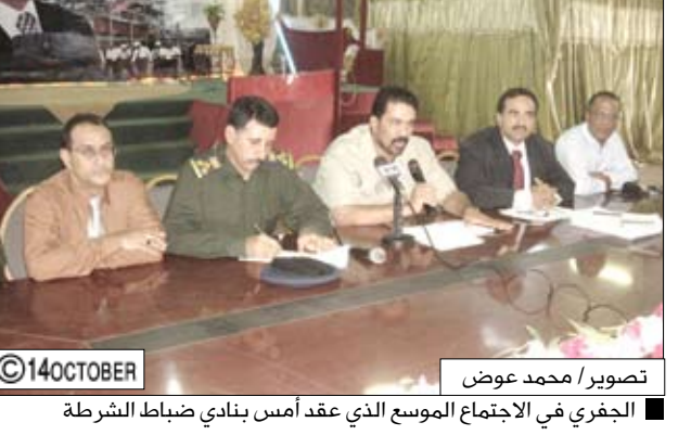
الجفري في الاجتماع الموسع الذي عقد أمس ببنادي ضباط الشرطة

□ عدن / سيا : أكد محافظ عدن الدكتور عدنان عمر الجفري في الاجتماع الموسع الذي عقد أمس ببنادي ضباط الشرطة وضم مديري المستشفيات الصحية العامة والعسكرية والأمنية والإدارات المعنية أهمية تضامر جهود الجميع من أجل إنجاح الحملة الشاملة لمكافحة الأوبئة ومنها مكافحة العبوس الناقل لحمى الضنك والمالاريا من خلال القيام بعمليات الرش الضبابي في عموم مديريات محافظة عدن. وخلال اللقاء أشاد محافظ عدن بكفاءة الجهود التي تبذل في سبيل مكافحة تفشي