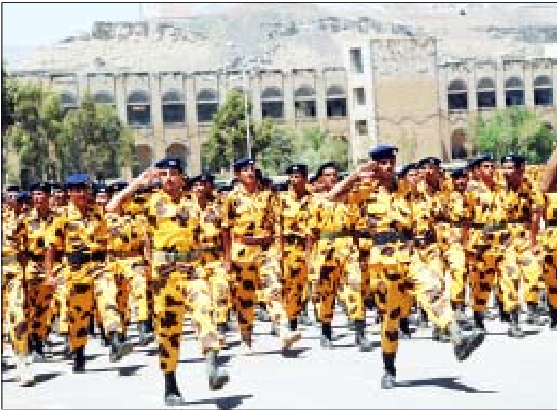
جانب من عرض افراد الامن المركزي