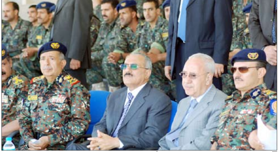
رئيس الجمهورية يشهد العرض العسكري الذي أقيم بمناسبة احتفالات شعبنا بالعيد الوطني الـ 20 للجمهورية

□ صنعاء / سيا : قام فخامة الأخ الرئيس على عبدالله صالح رئيس الجمهورية القائد الأعلى للقوات المسلحة أمس بزيارة إلى معسكر الأمن المركزي وكان في استقباله الإخوة قيادة قوات الأمن المركزي . وقد شهد فخامة العرض العسكري الذي أقيم بمناسبة احتفالات شعبنا بالعيد الوطني الـ 20 للجمهورية اليمنية الثانی والعشرين من مايو. وعودة بعض كتائب الأمن المركزي إلى معسكرها الدائم بعد أداؤها مهامها في عدد من المحافظات والمديریات. وتحدث فخامة الأخ الرئيس إلى الإخوة الضباط والصف والجنود، حيث هناهم بحلول العيد الوطني الـ 20 لإعادة تحقيق وحدة الوطن وقيام الجمهورية اليمنية.. مشيراً إلى ما تحقق للوطن في ظل وحدته المباركة من إنجازات وتحولات وعلى مختلف الأصعدة. وقال " لقد أديتم واجباتكم بكل كفاءة واقتدار وإخلاص وتفان .. وكان دور الأمن المركزي دوراً إيجابياً ورائعاً وممتازاً. ونحن نؤمن عليها ما قامت به وحدات الأمن المركزي في تثبيت الأمن والاستقرار والسكينة العامة. وشدد على ضرورة الابتعاد عن تناوُل القات أثناء أداء الواجب وبما يحافظ على مظهر الجنود ويمكنهم من أداء واجباتهم بروح انضباطية عالية.. مشيراً إلى الأضرار الكثيرة للقات سواء أكان على الصحة أو المال . (التفاصيل ص3)