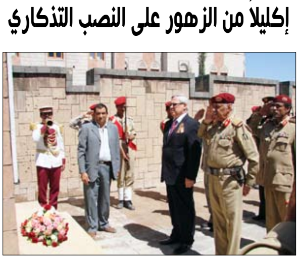
نائب رئيس هيئة الأركان والسفير الروسي يضعان إكليلاً من الزهور على النصب التذكاري