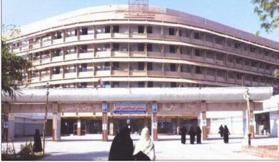
مبنى مستشفى الوحدة