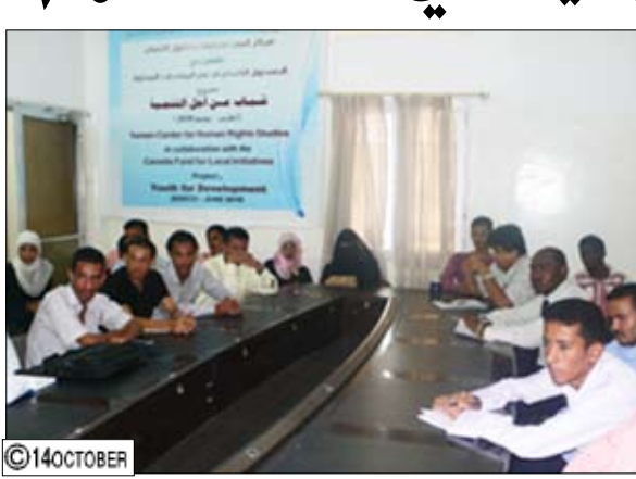
جانب من المشاركين في الحلقة النقاشية