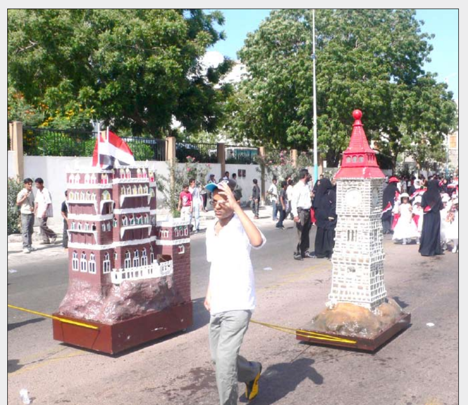
من مظاهر الإبتهاج بعيد الوحدة في عدن