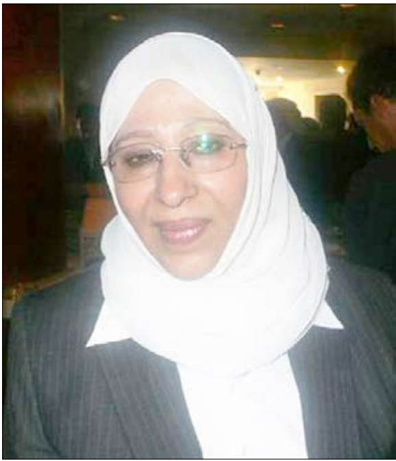
د. هدى البان

وقالت وزير حقوق الإنسان: " إن الحكومة اتخذت بعد إقرار مجلس حقوق الإنسان لليمن عددا من الإجراءات أهمها إعداد خطة عمل زمنية لتنفيذ التوصيات الـ (125) التي التزمت بلاندا بإنفاذها خلال السنوات الأربع القادمة، صدور قرار مجلس الوزراء بإعداد إستراتيجية وطنية لحقوق الإنسان تشترك في إعدادها إلى جانب المؤسسات الحكومية والمعنية منظمات المجتمع المدني الناشطة في مجال حقوق الإنسان إلى جانب صدور قرار لمواءمة التشريعات الوطنية مع نصوص المكوك والاتفاقيات الدولية التي صادقت عليها اليمن فضلا عن صدور قرار إدماج مبادئ حقوق الإنسان في مناهج التعليم الأساسي والثانوي والجامعي، وتقديم مشروع نظام ينظم أوضاع اللاجئين إلى اليمن وينص بوضوح على حقوقهم وواجباتهم، وإجراء تعديلات جوهرية على قانون السلطة القضائية لتعزيز ضمانات استقلال القضاء وضمان إجراءات العدالة الجنائية وكذا اتخاذ تدابير عملية تضمن حقوق المرأة في سلك القضاء وتمتعها بفرص متكافئة مع الرجال ومنحها فرصا في الالتحاق بالمعهد العالي للقضاء الذي كان حكرًا على الرجال فقط وزيادة تمثيلها في المجالس المنتخبة ومواقع صنع القرار، بالإضافة إلى صدور القانون رقم (1) لعام 2010 م بشأن مكافحة غسيل الأموال وتمويل الإرهاب وتقديم مشروع قانون بشأن السجاح بإنشاء وسائل إعلام سمعية وبصرية للمواطنين وغيرها من الإجراءات والتدابير التي حرصت اليمن على تفعيلها على أرض الواقع ."