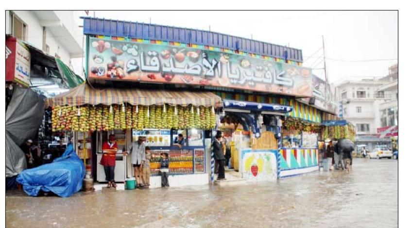
من اضرار الامطار والسيول في صنعاء