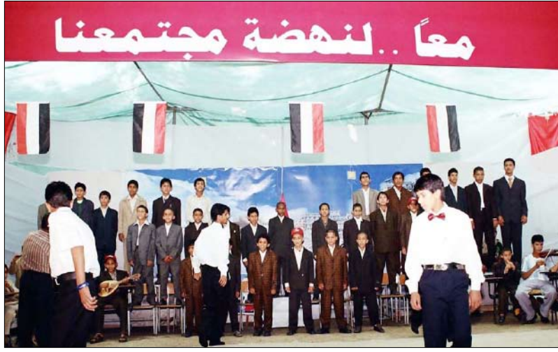
من فعاليات اختتام المهرجان