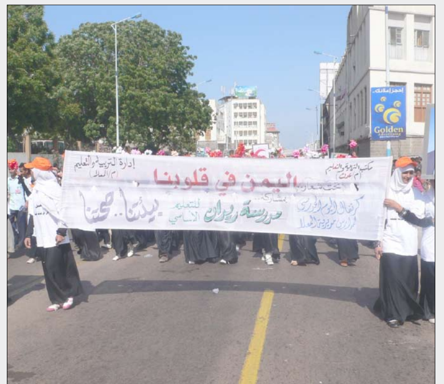
فتيات عدن يحتفن بعيد الوحدة

ولأنها عدن .. فإنها تستظل عصية على دعاة الزيف وأبواق الخراب، وحملة مباحز الفوضى ومن يحاولون تلويث واقع ووحي اليمن واليمنيين بما ليس منه جدوى سوى الدمار، ولا خاتمة له سوى الهلاوة ..