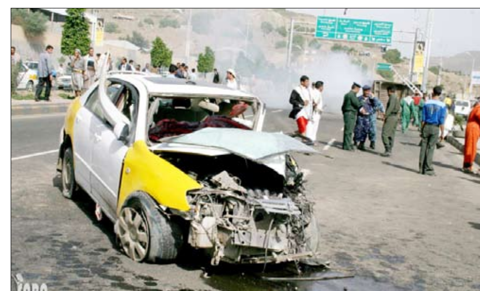
الحوادث المرورية من آثار السرعة الزائدة

أثناء قيادة المركبة، لما يمثله من خطر على حياته. وواصلت الإذاعات المتنقلة حملاتها التوعوية عبر مكبرات الصوت في الشوارع والأسواق والأحياء السكنية والحدائق العامة والمتنزهات، داعية المواطنين وسائقي المركبات ومستخدمي الطريق إلى الالتزام بالقواعد المرورية وعدم التجاوز الخاطئ والسرعة الزائدة وعرقلة السير في الشوارع عند تحميل وإزالة الركاب من خلال الالتزام بالوقوف الصحيح في الأماكن المخصصة لذلك، بالإضافة إلى عدم استخدام الهاتف