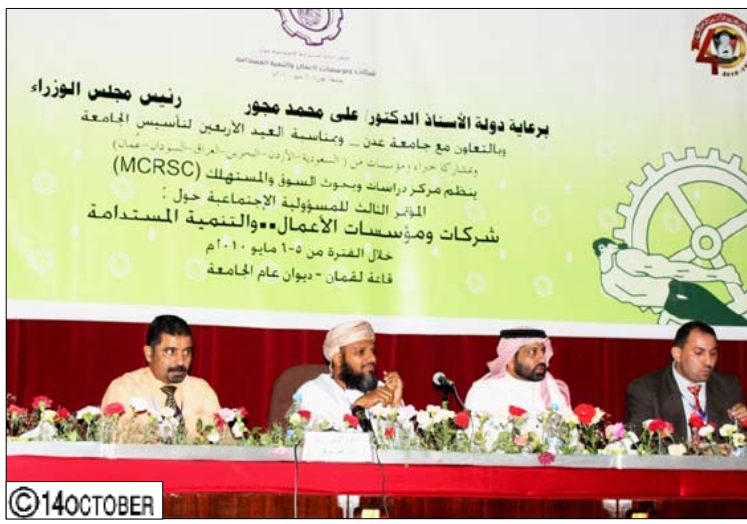
المؤتمر الثالث للمسؤولية الاجتماعية حول شركات ومؤسسات الأعمال