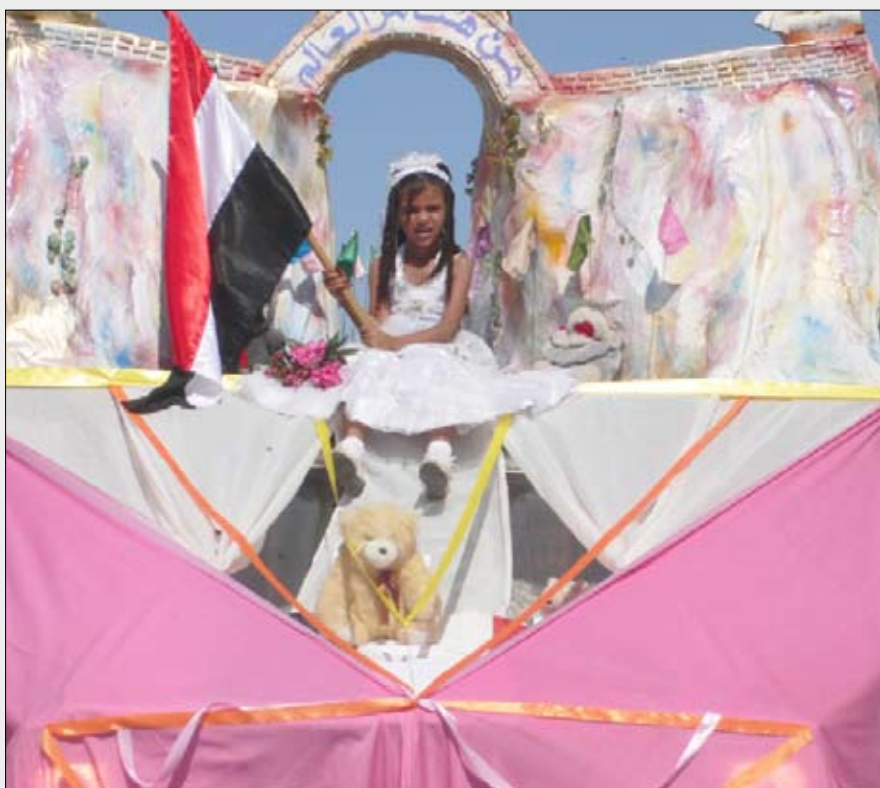
مجسم لبوابة عدن ضمن مظاهر الاحتفالات بعيد الوحدة