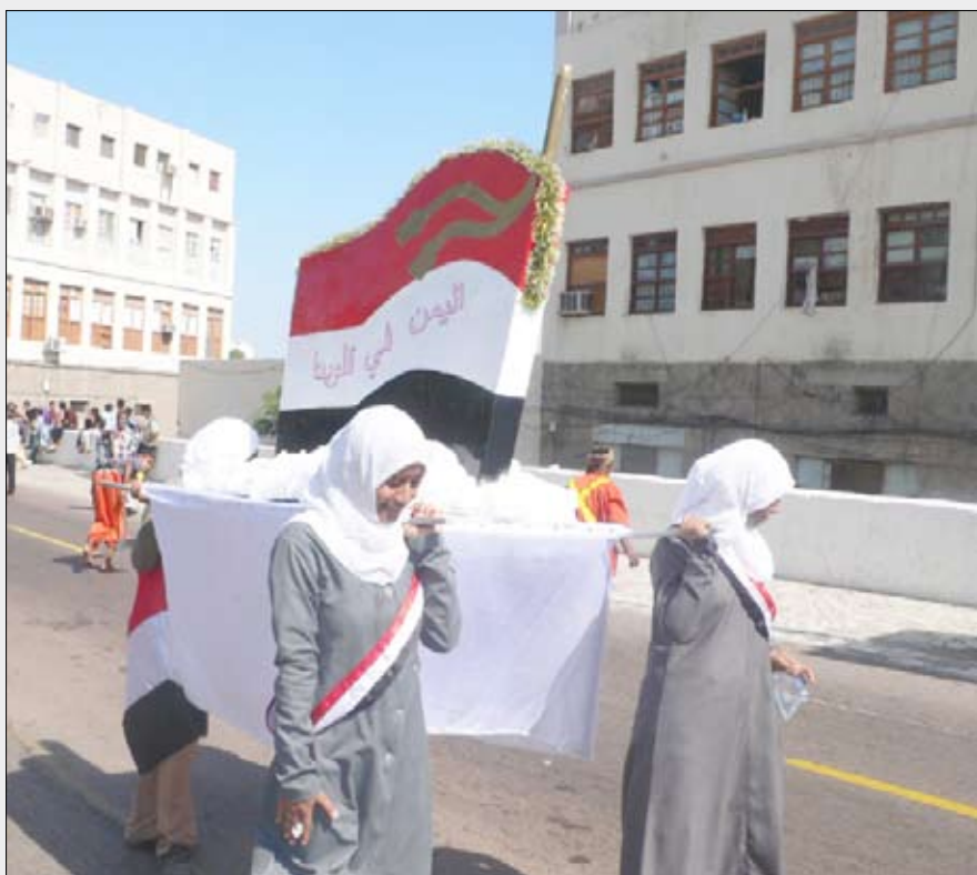
طالبات من مدارس عدن يرفعن مجسم علم الجمهورية اليمنية