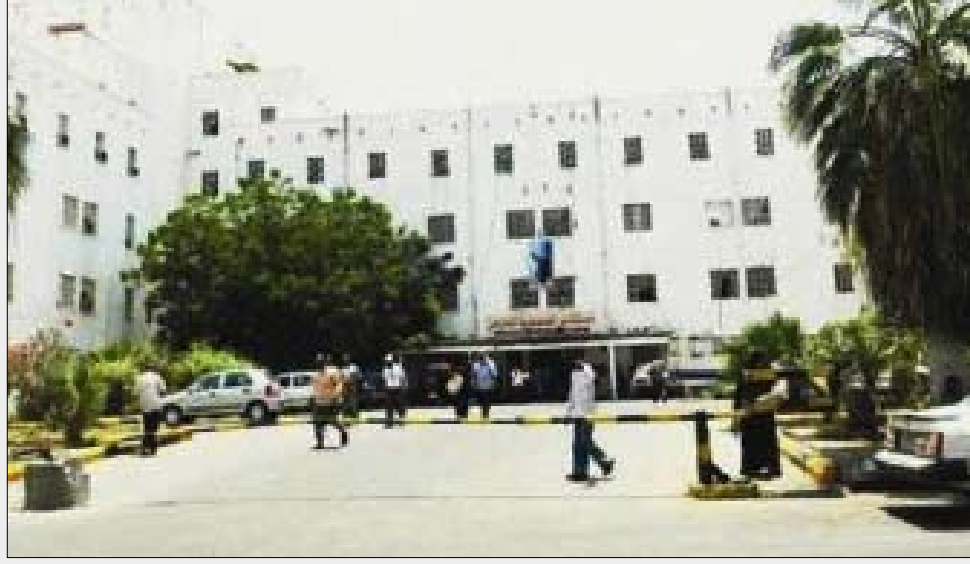
مبنى مستشفى الجمهورية

المخلفات، التي يطلق عليها مخلفات الرعاية الصحية (Healthcare waste) أو المخلفات الطبية (Medical Waste)، تتضمن جميع أنواع النفايات التي تنتج أو تخرج من منشآت ومؤسسات الرعاية الصحية، ورغم أن جزءاً كبيراً من هذه المخلفات (7-90%)، يشابه ويتماثل مع المخلفات العادية التي تنتج من المنازل، مثل بقايا الطعام، والأوراق المكتسية، والأكياس البلاستيكية والعبوات الزجاجية، فإن الجزء المتبقي (15-25%)، والمكون من أعضاء وأنسجة بشرية، ومن الدم ومشتقاته، ومن المواد الكيميائية، والعقاقير الطبية، وبقايا الأجهزة الطبية، وأحياناً حتى المواد المشعة، دائماً ما يحمل في طياته مخاطر صحية وبيولوجية خطيرة..