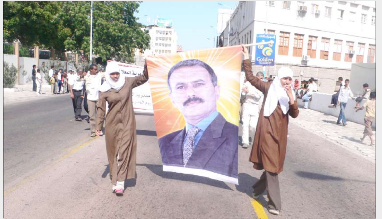
تواصل مظاهر الاحتفال والاحتفاء بعيد الوحدة في عدن