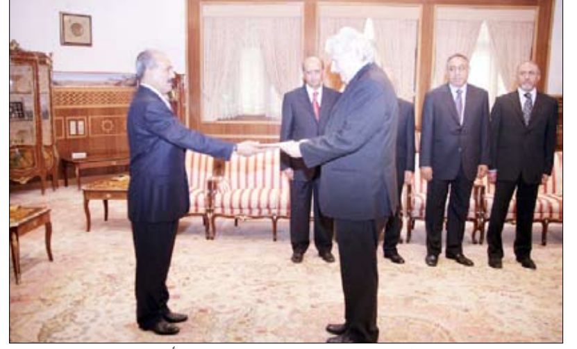
رئيس الجمهورية لدى تسلمه أوراق اعتماد البساندورا فالاً فولتيا بمناسبة تعيينه سفيراً فوق العادة ومفوضاً لجمهورية إيطاليا