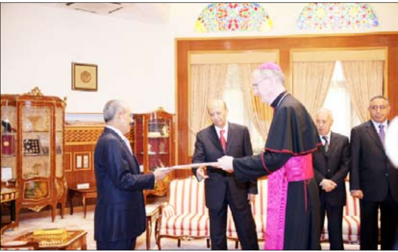
.. ولدى تسلمه أوراق اعتماد المطران بيتر راجيك بمناسبة تعيينه سفيراً فوق العادة ومفوضاً للدولة الفاتيكان