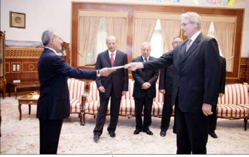
.. ولدى تسلمه أوراق اعتماد وكارل شوتز فيه بمناسبة تعيينه سفيراً فوق العادة ومفوضاً لمملكة النرويج