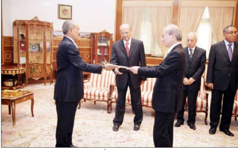
.. ولدى تسلمه أوراق اعتماد وتيسو توري نامبا بمناسبة تعيينه سفيراً فوق العادة ومفوضاً لإمبراطورية اليابان