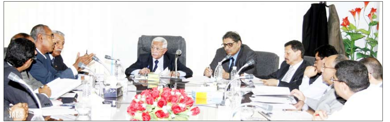
اللجنة العليا للمناقصات والمزايدات في اجتماعها أمس

جديدة 32 مناقصة بكلفة 14 ملياراً و499 مليون ريال وذلك لعدم اكتمال إجراءاتها القانونية. وأشار التقرير إلى أن إجمالي مناقصات المرفوعة إلى اللجنة خلال الربع الأول بلغت 72 وثيقة مناقصة منها 18 وثيقة مرحلة من العام الماضي، فيما بلغ عدد وثائق مناقصات التي وافقت اللجنة عليها 25 وثيقة مناقصة، و22 وثيقة مناقصة تم إعادتها إلى الجهات لاستكمالها وفقاً للإجراءات القانونية وشهدت اللجنة على أهمية متابعة استكمال بقية الملاحظات على الأداة الإرشادية والوثائق النمطية الجديدة لاستكمالها ورفع بها إلى مجلس الوزراء للصادقة عليها طبقاً لأحكام القانون ولائحته التنفيذية. وكانت اللجنة قد أقرت في اجتماعها أمس مناقصة مشروع إعادة تأهيل مبنى الجهاز المركزي للرقابة والمحاسبة فرع عدن بكلفة 260 مليوناً و484 ألف ريال بتمويل حكومي. ووافقت على الخدمات الاستشارية للإشراف على استكمال مشروع الصرف الصحي ومحطة المعالجة لمدينة القاعة بمحافظة إب بكلفة 576 ألفاً و705 دولارات.