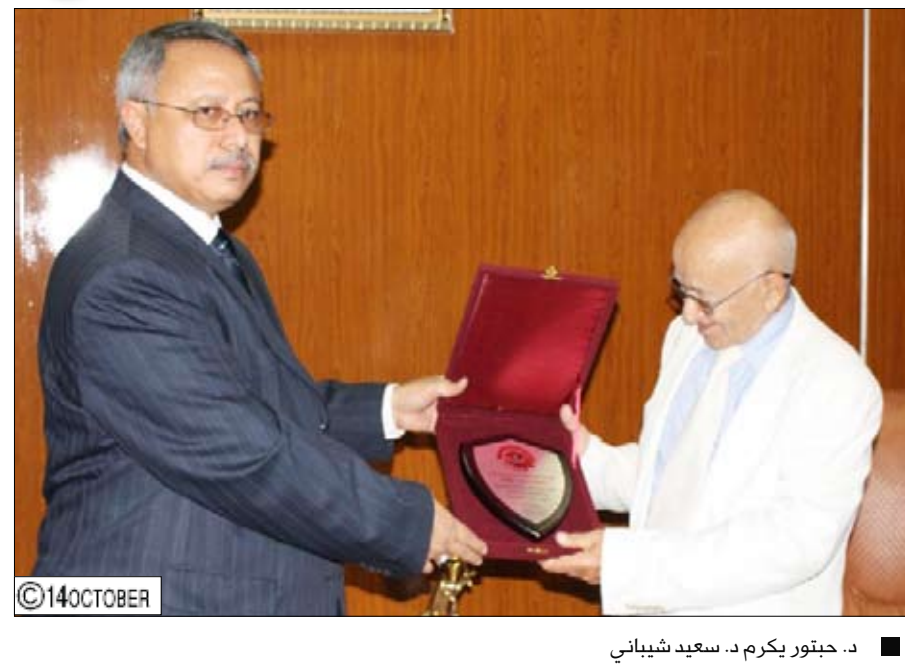
د. جنتور يكرم د. سعيد شيباني

عن / عديده محسن : تصوير / مقر القنصلية كرمته جامعة عدن ممثلة برئيسها الدكتور/ عبدالعزيز صالح بن حبتور وبحضور عدد من قياداتها وممثلين عن محافظة عدن وعدد من مدراء عموم مكاتب وزارات الشخصية الوطنية الكاتب والشاعر الغنائي الكبير الدكتور/ سعيد شيباني . وخلال مراسم التكريم أشاد الدكتور/ بن حبتور بالمكانة التي يتمتع بها الدكتور/ الشيباني في قضاء العلم والثقافة اليمنية وعماءاته الفنية التي رفدت الحياة الثقافية والروحية بأعذب الكلمات وتغنّت بها حناجر رواد الفن الغنائي اليمني وأضحت علامة بارزة في تاريخها.