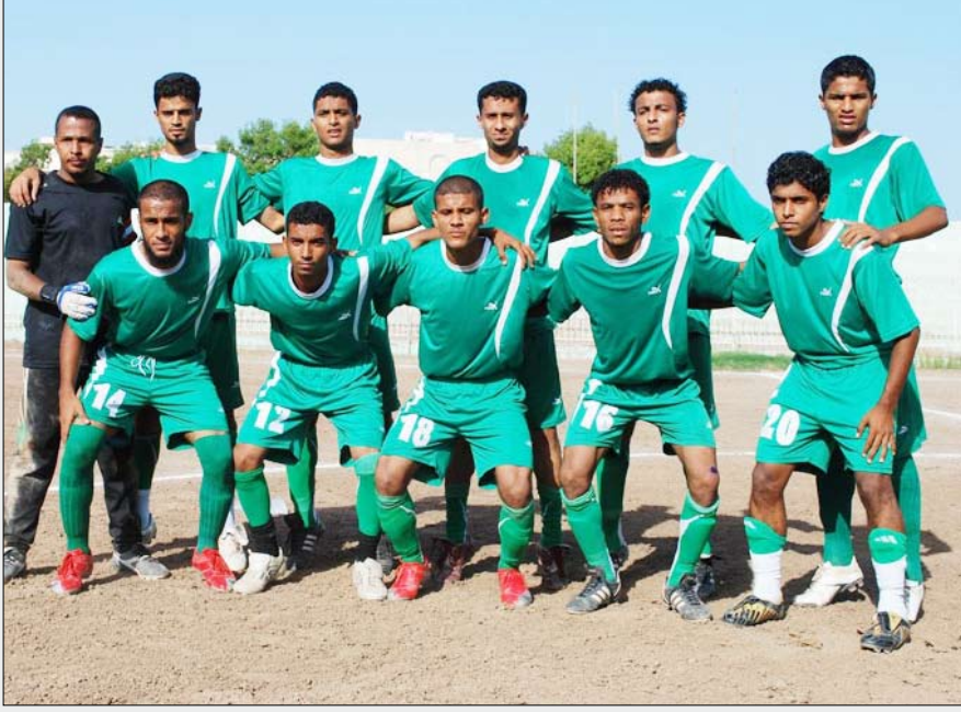
فريق الوحدة العدني