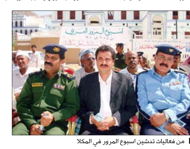
من فعاليات تدشين اسبوع المرور في المكلا