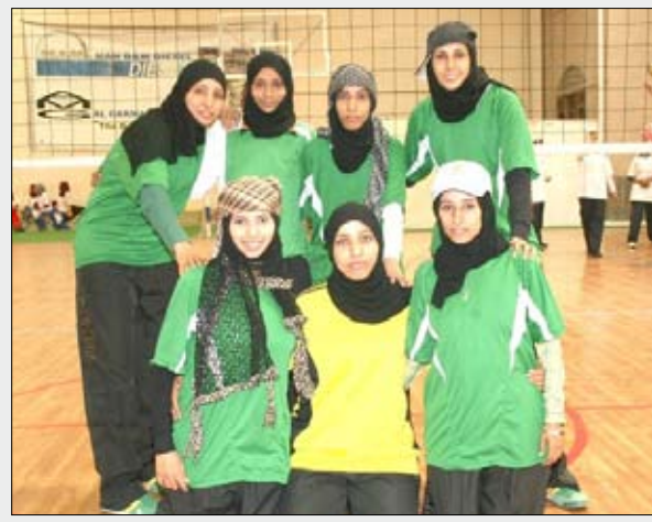
فريق طائره الحديدية