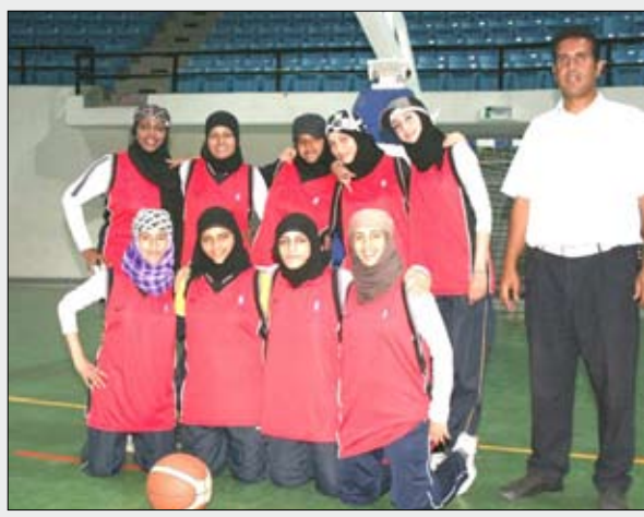
فريق السلة الامانة