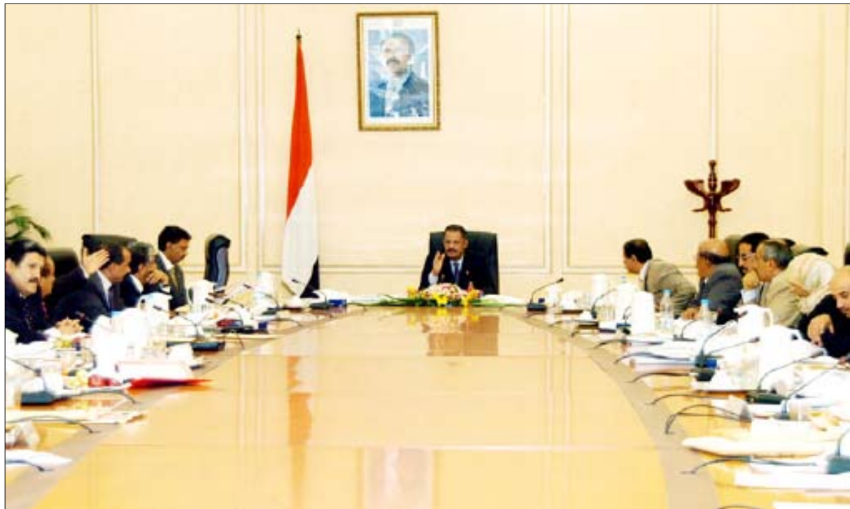
مجلس الوزراء لدى اجتماعه أمس برئاسة د. مجور

ناقش مجلس الوزراء في اجتماعه الأسبوعي أمس برئاسة رئيس المجلس الدكتور علي محمد مجور التقرير الوطني الثاني لأهداف التنمية الألفية المقدم من وزارة التخطيط والتعاون الدولي.