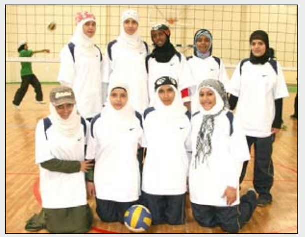
فريق طائره صنعاء