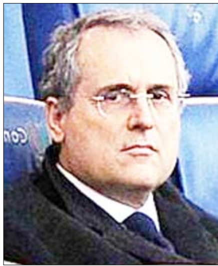
كلاوديو لوتيتو رئيس نادي لاتسيو

10:00 مارسيليا × رين الجزيرة الرياضية + 7