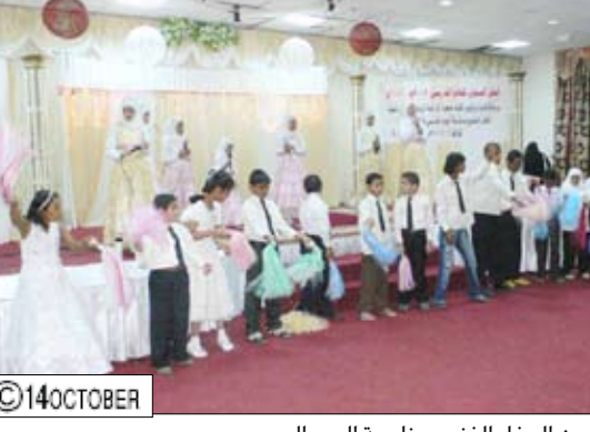
من الحفل الفني بمناسبة اليوم المدرسي