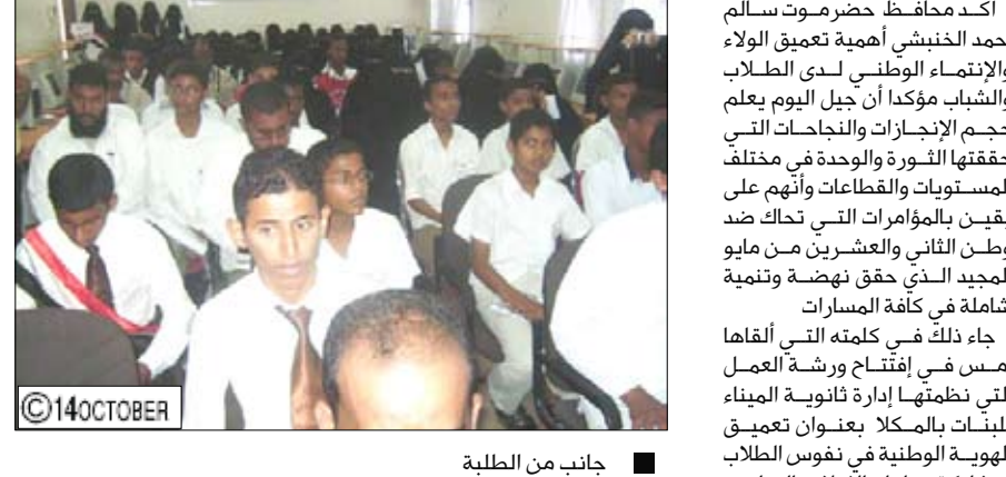
جانبا من الطلبة

المكلا / .. بازياد : أكد محافظ حضرموت سالم احمد الخنبي أهمية تعميق الولاء والانتماء الوطني لدى الطلاب والشباب مؤكداً ان جيل اليوم يعلم حجم الإنجازات والنجاحات التي حققتها الثورة والوحدة في مختلف المستويات والطاعات وأنهم على يقين بالمؤامرات التي تحاك ضد وطن الثاني والعشرين من مايو المجيد الذي حقق نهضة وتنمية شاملة في كافة المسارات كما جاء ذلك في كلمته التي ألقاها أمس في افتتاح ورشة العمل التي نظمتها إدارة ثانوية الميناء بالمكلا بعنوان تعميق الهوية الوطنية في نفوس الطلاب بمشاركة جماعات الإعلام بالمدارس الثانوية ومدارس التعليم الأساسي وفي مستهل الورشة التي إنعقدت تحت شعار "اليمن أعلى" أكد محافظ حضرموت دور الإعلام في صناعة الثقة بين الحاكم والمحكوم وعدم التظليل والتعويق وراء من يحاولون بث الفرقة والخلاف بين أبناء الوطن الواحد مؤكداً أن أبناء حضرموت مطلعون على كل ما أنجز حتى الآن . ودعا محافظ حضرموت إلى ضرورة قيام المؤسسات الإعلامية والتربوية بدورها في كشف الحقائق وتوضيح الصورة كاملة للجيل الحالي وقطع الطريق أمام كل من يحاولون استغلال طاقات الشباب في مشاريعهم الصغيرة . وفي حفل افتتاح الورشة الذي حضره الأخ عوض عبدالله حاتم وكيل حضرموت لشؤون مديريات الساحل ألقى الأخ/ صالح النهدي مدير مكتب التربية والتعليم بمديرية مدينة المكلا كلمة أشار فيها إلى عظمة الوحدة اليمنية المباركة التي أشرقت فيها قطاعات التعليم والصحة وكافة مشاريع البنية التحتية ، مؤكداً أن جيل الوحدة من أبناء حضرموت على علم بما قدمته الوحدة من خير عم المن ين بشكل عام وحضرموت خاصة ، مستعرضاً المشاريع التربوية التي