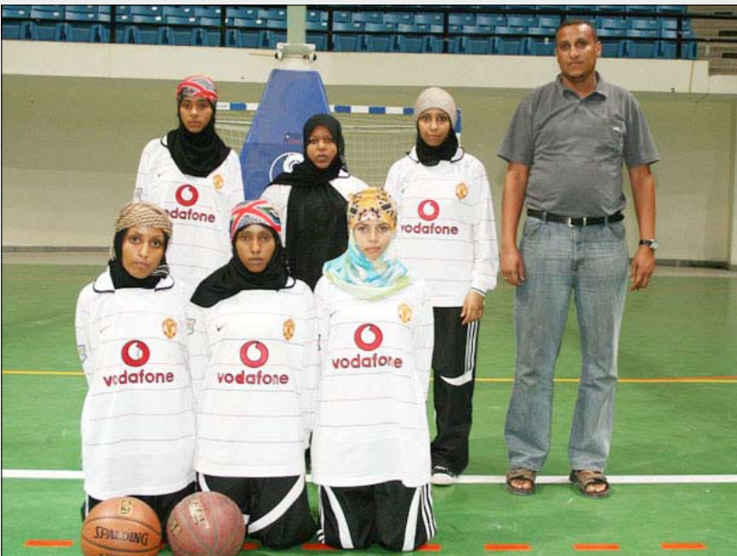
فريق السلة عدن

صفر، وخسر منتخب صنعاء من نظيره منتخب الحديدية / 3 / 1 ، فيما أحرز منتخب تعز فوزاً مستحقاً وسهلاً على منتخب حضر موت بنتيجة 3 / 3 صفر، وتمكن منتخب لحج من الفوز على منتخب محافظة ذمار بنتيجة 3 / 1.