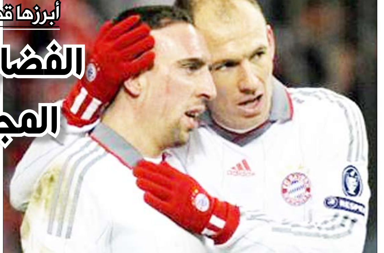
فضيحة ريبيري تهدد مشاركته في المونديال

لمطالبه المسؤولين بالميزد من «الاتحاد» لتحقيق الأهداف المرجوة في البطولة. وفي تصريحات نشرتها صحيفة «أو جلوبو» البرازيلية، كشف المدير الفني للمنتخب الشهير باسم «بافانا بافانا» صراعات السلطة التي تدور بين مسؤولي المنتخب، وحذر من احتمالات تأثير ذلك على أداء الفريق الوطني في البطولة التي تنطلق في 11 حزيران/يونيو المقبل.