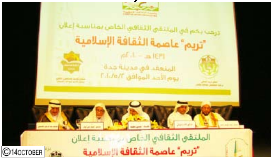
الملتقى الثقافي الخاص بمناسبة إعلان تريم عاصمة الثقافة الإسلامية

بالدور الكبير الذي قام به أبناء حضرموت في نشر الإسلام . من جهته قدم السفير محمد صالح القطيش الفصل العام بجدة نبذة عن محافظة تريم تطرق فيها إلى الخلفية التاريخية للمدينة وعن أهم المعالم فيها مشيراً إلى وجود أكثر من 360 مسجداً فيها واحتوائها على مخطوطات نادرة ومؤلفات كثيرة . ونوه الفصل العام بجهود القيادة السياسية بالاهتمام بمدينة تريم عاصمة للثقافة الإسلامية 2010 حيث دشنت فعالياتها فخامة الأخ الرئيس علي عبدالله