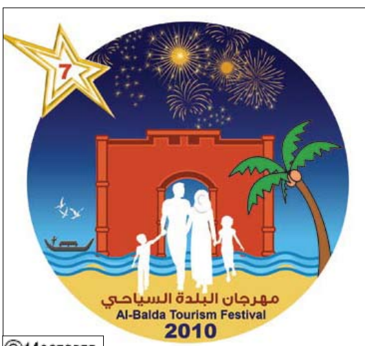
شعار مهرجان البلدة السياحية

الديني ان الندوة ستحتضن طغية إعلامية واسعة من قبل الاعلام المحلي والخارجي وذلك للاهمية التي اكتسبتها الندوة في التعريف بهذه الظاهرة الطبيعية . وفي إطار الإستعدادات المكثفة للإحتفاء بمهرجان نجم البلدة السياحية للعام 2010م في مدينة المكلا بمحاضرة حضرها ضيوف الرائدة أروع الصور الفنية لتقاليد زواج البادية لدى قبائل حضرموت كما احتوى الدليل صفحة ملونة يتضمن أبرز الفعاليات لمهرجان هذا العام وافتتح الدليل بكلمة رئيس الجمهورية وكلمات لوزير الثقافة ومحافظ حضرموت ورئيس الشركة المنظمة للمهرجان أكدت خصوصية مهرجان نجم البلدة وضرورة إستغلال هذه الظاهرة الطبيعية في الترويج