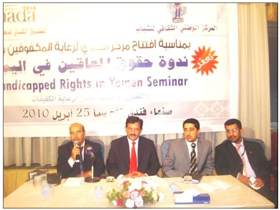
من فعاليات الندوة

وقال إن ما نصت عليه التشريعات الدولية والمحلية من حقوق للمعاقين يعد خطوات متقدمة على صعيد تمكين المعاق أو الكفيف من ممارسة واجباته ونيل حقوقه بطريقة غير مفضولة على المستوى العالمي، أما على مستوى بلدنا اليمن، فإن هذه الحقوق مازالت غير مكتملة والسبب يكمن في أن التشريعات والقرارات الصادرة عن الحكومة أيضاً ناقصة وتحتاج إلى التطوير والإضافة وقيل ذلك لا بد أن تغفل في الواقع الحياتي للمعاق، ثم أن هذه القوانين أو القرارات لا تلائم القضايا الأساسية كالتعليم والعمل بشكل عميق وإن تطرقت إليها فأنما يكون ذلك بطريقة خجولة تقتصر على المبادرة والاختيار عن طريق الممارسة حتى تكتشف أكثر إيجابياتها وسلبياتها.