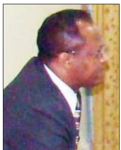
توفيق عبدالله أحمد

صنعاء / عارف محفوظ : جدد سعادة الدكتور / توفيق عبدالله أحمد سفير أثيوبيا الفيدرالية في صنعاء مواقف بلاده الداعمة والمؤيدة لوحدة وأمن واستقرار الجمهورية اليمنية، مؤكداً في هذا الصدد رفض أثيوبيا قيادة وحكومة وشعبها التدخل الخارجي في شؤون اليمن الداخلية.