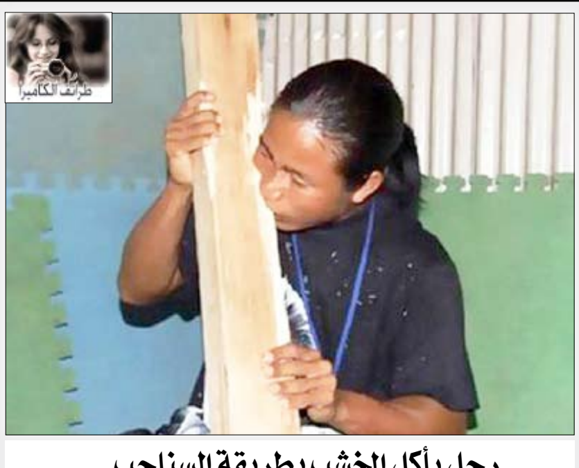
رجل يأكل الخشب بطريقة السناجب...