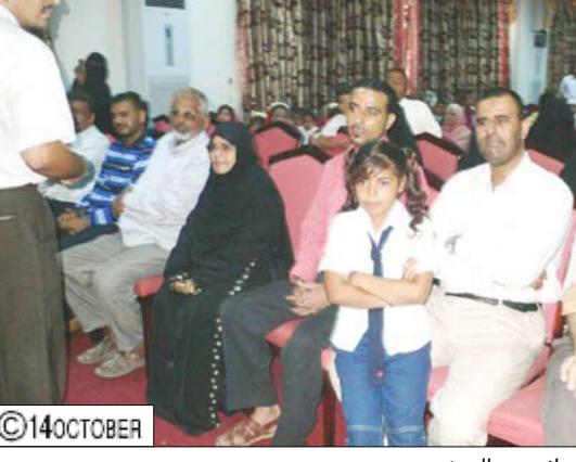
جانبا من الحضور