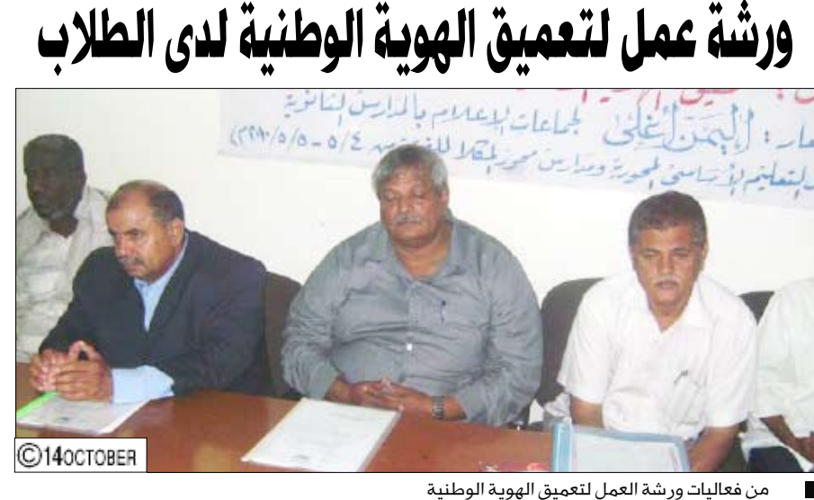
من فعاليات ورشة العمل لتعميق الهوية الوطنية