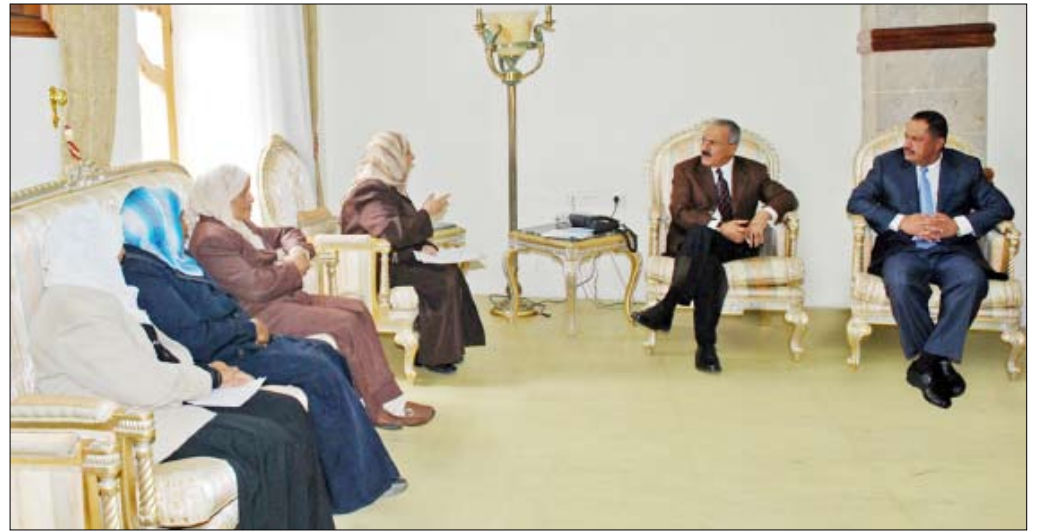
رئيس الجمهورية أثناء لقائه قيادات اتحاد نساء اليمن أمس

استقبل فخامة الأخ الرئيس علي عبدالله صالح رئيس الجمهورية أمس قيادات اتحاد نساء اليمن حيث اطلع الأخ الرئيس على أنشطة وبرامج الاتحاد لخدمة القطاع النسائي. كما جرى خلال المقابلة طرح العديد من القضايا والمواضيع التي تهتم المرأة في اليمن ومنها ما يتصل بالزواج المبكر والسنن الآمنة للزواج والقضايا الخاصة بزيادة المشاركة السياسية للمرأة ومشروع تدريب القيادات النسائية وبرنامج الحماية القانونية والاجتماعية والمناصرة للمرأة ومشروع الحماية القانونية للطفل وكذا ما يتعلق بمحو أمية المرأة. وأشادت قيادات اتحاد نساء اليمن بما تحظى به المرأة من رعاية واهتمام وتشجيع من قبل فخامة الأخ الرئيس الذي أتاح أمامها العديد من الفرص للمشاركة في الحياة السياسية العامة وعملية التنمية. وأكد استعداد المرأة الدائم للإسهام الفاعل إلى جانب أخيها الرجل من أجل تحقيق نهضة الوطن وتقدمه والدفاع عن ثوابته الوطنية. واستعرضن في أحاديثهن ما تتعرض له الفتيات الصغيرات من مشاكل اجتماعية وصحية ونفسية نتيجة زواجهن دون سن البلوغ بالإضافة إلى ما يعكسه ذلك من نتائج سلبية على المجتمع بشكل عام. وقد أكد فخامة الأخ الرئيس أهمية الدور الذي تضطلع به المرأة اليمنية في خدمة الوطن ومسيرة التنمية ونهضته.