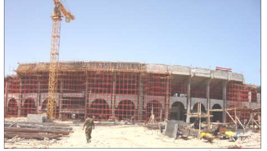
ملعب الوحدة في أبين