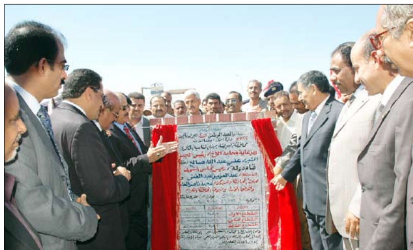
...ويفتتح مشاريع تنمية