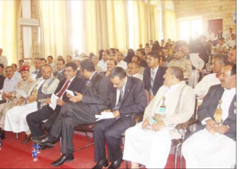
محافظ تعز يكرم الفائزين بجوائز رئيس الجمهورية