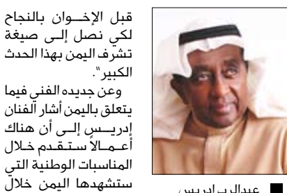
عبد الرب إدريس

□ صنعاء / سياه: وصل إلى صنعاء أمس الفنان الموسيقار الدكتور عبد الرب إدريس في زيارة للمين تستغرق عدة أيام يوقع خلالها على عقد إنتاج الألبان والأعمال الموسيقية الخاصة باللوحة الثقافية المشاركة في افتتاح بطولة خليجي 20. وأوضح الفنان إدريس أن هذه الزيارة تأتي تلبية لدعوة وزير الثقافة بغرض تبادل الآراء حول العمل الفني لمهرجان خليجي 20. وقال " سوف نتبادل الآراء عما يمكن أن يقدمه في هذا المهرجان الذي سيقام لأول مرة في اليمن ونتمنى أن تتكلم كل الجهود والمبادرات المبذولة من