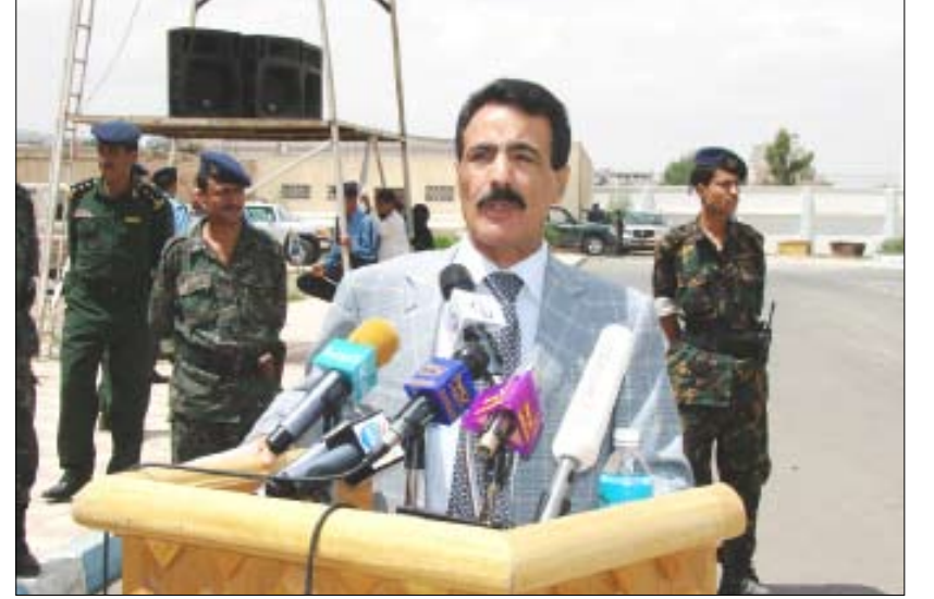
من فعاليات الاحتفال بتدشين أسبوع المرور العربي