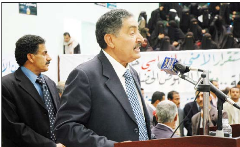
رئيس مجلس الشورى يلقي كلمته في الحفل الخطابي