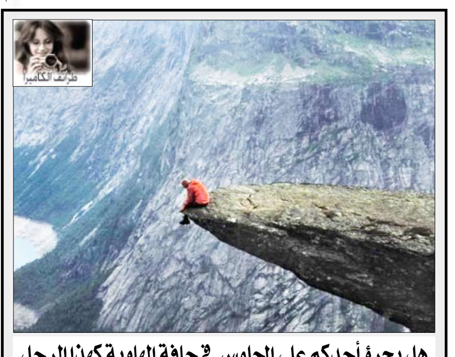
هل يجروا أحدكم على الجلوس في حافة الهاوية كهذا الرجل