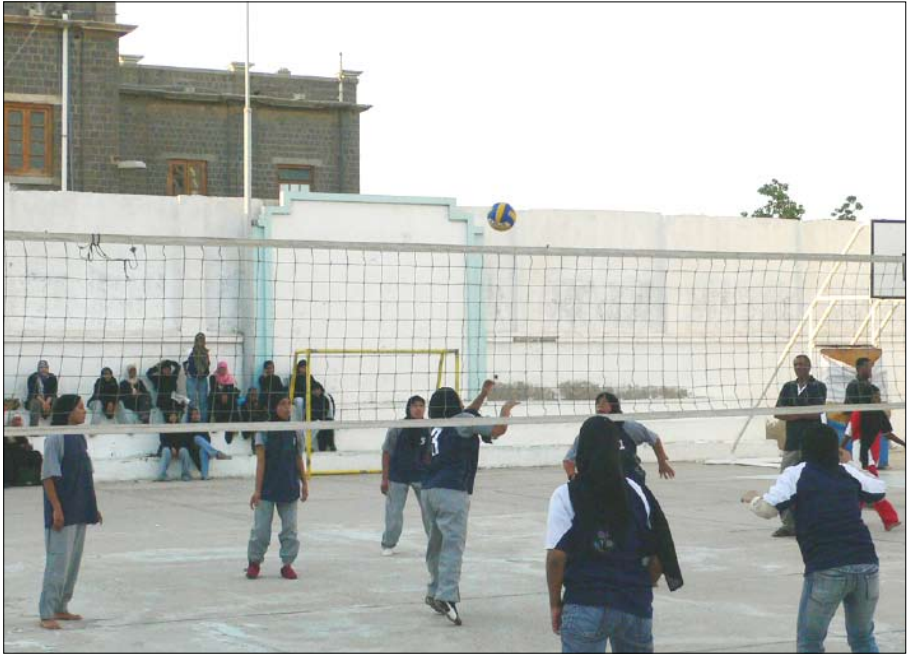
فتيات يلعبن كرة الطائرة