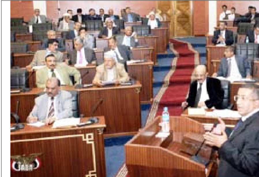
نصر طه مصطفي يلقى كلمة في مجلس الشورى