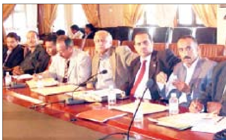
من فعاليات تدريب اللجان الميدانية للإشراف على الانتخابات