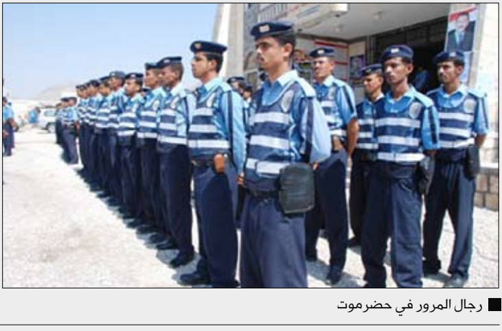
رجال المرور في حضرموت

العام، وأشار إلى أن إدارة المرور نقلت خلال العام المنصرم ملكيات 680سيارة ونقل 1081سيارة خصوصي و1329سيارة أجرة، فيما بلغت الحوادث المرورية 340حادثاً نتج عنها 76 حالة وفاة وبلغت الإصابات 483 إصابة، وهي تعد النسبة الأقل بين محافظات الجمهورية كافة. كما تم إصدار رخص جديدة بلغت 2071 مركبات نقل، و381سيارات خصوصي و123سيارات أجرة، كما تم إعطاء 2126 بدل مفقود فيما بلغت المخالفات 3269 مخالفة، لافتاً إلى أن مجمل الإيرادات لمحافظة حضرموت خلال العام المنصرم مائة وثلاثة وعشرين مليون ريال. مشيراً إلى أن برنامج الاحتفال بهذه المناسبة يشمل تنظيم محاضرات أمام طلاب المدارس والجامعات فضلاً عن البرامج التوعوية في الإعلام المحلي.