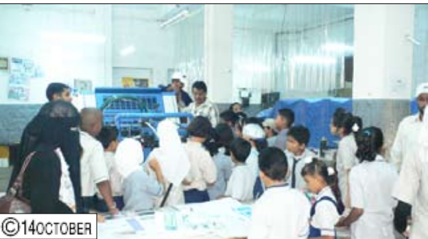
... ولدى زيارتهم المطبعة التجارية

□ عدن/ محمد فؤاد راشد: قام (30) طالب وطالبة من مدرسة نوري لتعليم الإنجليزية محافظة عدن بزيارة استطلاعية صباح يوم أمس لصحيفة (14 أكتوبر) للتعرف على سير العمل الصحفي وإصدار الصحيفة والإطلاع على التطورات التي شهدتها الصحيفة في السنوات الأخيرة، وعلى إصدار الصحيفة والمراسل التي تمر بها عملية الطبع والنشر والتوزيع وهي المرحلة الأخيرة من صدور الصحيفة. واستمع الطلاب إلى شرح مفصل عن سير العمل الصحفي من خلال زيارتهم لكافة إدارات وأقسام الصحيفة المختلفة، وتعرفوا على مجمل الانجازات الحديثة سواء على المستوى التحريري أو التقني والفني، حيث عبروا عن ارتياحهم لما لمسوه من تطور سواء في الإخراج الصحفي للصحيفة أو من حيث تعدد مواضيعها وأهمياتها وخاصة قضايا الشباب والمرأة والطفل. وجاءت الزيارة مترامنة مع احتفالات شعبنا اليمني بالعيد الوطني الـ 20 لقيام الجمهورية اليمنية، حيث قاموا بجولة استطلاعية أخرى لقناة عدن الفضائية إلى جانب رحلة بحرية ترفيهية انطلقت من رصيف السباح بمديرية التواهي وانتهت بالرسو بشاطئ جولدمور بالمديرية. من جانبه أشار مسئول ومنسق الزيارة الأخ/ قيصر المشدلي إلى أن تنظيم مثل هذه الزيارات يعزز