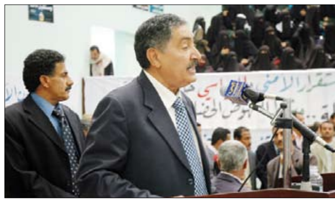
عبدالغني يلقي كلمته في الحفل أمس

أشاد الأخ عبدالعزيز عبدالغني رئيس مجلس الشورى بدور أبناء محافظة البيضاء النضالي الذي كان دوماً وأبداً في صف القضية الوطنية، وكان أبناؤها سندا عظيماً لوطنهم وقت الشدائد والمحن، وكانوا رديف النصر في معاركه الطافرة. وتطرق في حفل خطابي وجهامهري أمس في محافظة البيضاء إلى التحديات ذات الطابع المحلي التي قال إن مصدرها ثلاث قوى شريرة ممثلة في: عصابة التمرد والتخريب والإرهاب الحوثية في بعض مديريات صعدة وحرف سفیان، وعناصر التخريب والإرهاب الانفصالية، في بعض مديريات المحافظات الجنوبية، والعناصر الإرهابية الظلامية المرتبطة بتنظيم القاعدة. ونبه رئيس مجلس الشورى إلى حقيقة الدور الذي تؤديه أحزاب اللقاء المشترك، قائلاً إن تلك الأحزاب تدعي رغبة في الحوار، ولكنها تفقد هذا الحوار مظلمة الديمقراطية والدستورية، ليس فقط في طبيعة ما تطرحه من اشتراطات غير منطقية، ولكن، بسبب المساندة السياسية والفكرية والإعلامية، التي تقدمها لقوى التخريب الشريرة الثلاث: الحوثية والانفصالية والقاعدية.