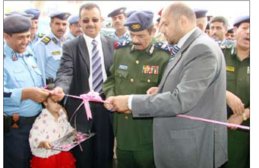
من فعاليات تدشين أسبوع المرور العربي الموحد