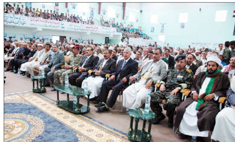
جانب من الحضور في الحفل الخطابي