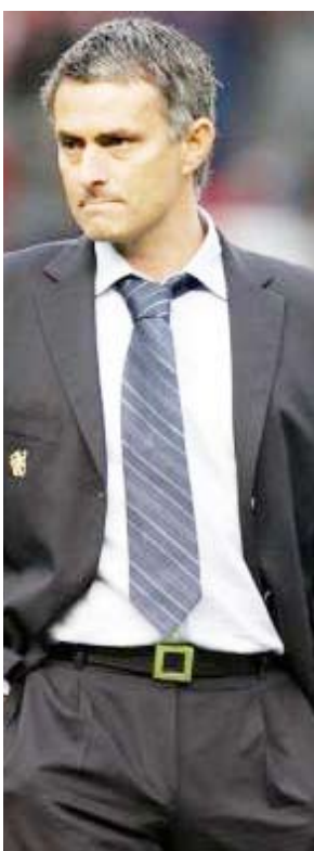
البرتغالي جوزيه مورينيو

روما / 14 أكتوبر / متابعة : أكد المدير الفني لنادي إنترميلان متصدر الدوري الإيطالي لكرة القدم وحامل اللقب ماركو برانكا أن رحيل المدرّب البرتغالي جوزيه مورينيو نهاية الموسم «غير وارد». ويأتي تصريح برانكا بعد فوز فريقه على لاتسيو 2 - صفر في المرحلة 36، رداً على الشائعات التي تناقلها الصحف الإسبانية منذ عدة أسابيع حول احتمال انتقال مورينيو إلى ريال مدريد الصيف المقبل.