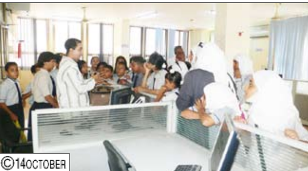
طلاب مدرسة نوري لدى زيارتهم صالة التحرير الكبرى