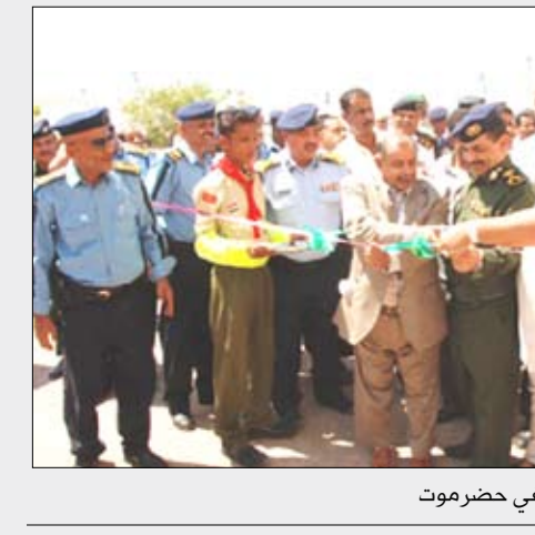
الخبنيشي يدين أسبوع المرور في حضرموت