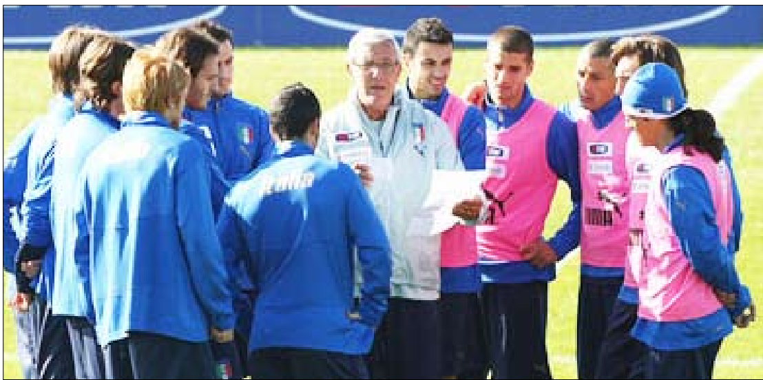
ليبي مع المنتخب الإيطالي