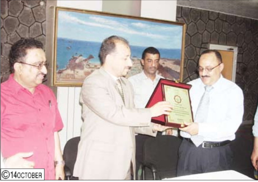
... ويكرم مدير عام قناة عدن الفضائية