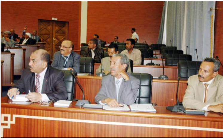
اللوزي (يسار) في جلسة مجلس الشورى أمس الأول

قال وزير الإعلام حسن أحمد اللوزي إن الجمهورية اليمنية بحق لها أن تفخر وبكل اعتزاز وهي تحتفل مع العالم بيوم الصحافة بما حققته من إنجازات معاشة ومشاهدة بكل المقاييس في إقامة صحافة يمنية حرة تؤدي دورها الإيجابي السياسي والاجتماعي بصورة حازت على رضا الشعب وتقدير العالم بالرغم مما تعانيه من بعض التجاوزات وأوجه القصور. وأعتبر اللوزي أن مناقشة مجلس الشورى للتعديلات المقترحة على قانون الصحافة والمطبوعات خلال هذه المناسبة العالمية المرموقة يعتبر من أجمل وأروع المصادفات الحميدة، وأن النقاشات الإيجابية المخلصة ورفيعة المستوى التي تدور في المجلس تبشر بالخير وبالتوجه الحريص لدى الجميع نحو تعديلات أفضل لصالح تعزيز حرية الصحافة وترقية المهنة إلى المستوى الذي تدل عليه معاني ودلالات يوم الصحافة العالمي. وأكد وزير الإعلام أن التعديلات الجديدة تستهدف الوصول إلى قانون جديد ينسجم مع المكانة العظيمة التي وصلت إليها اليمن في مجال حرية التعبير وكفالة حرية الصحافة وبما يعزز توجهه القيادي الحكيم بمنح حجب الصحفي لرأي يديه.