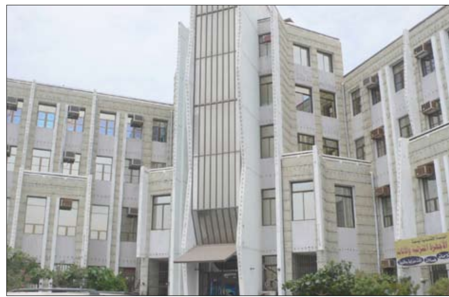
مبنى المؤسسة الاقتصادية / الحديدية