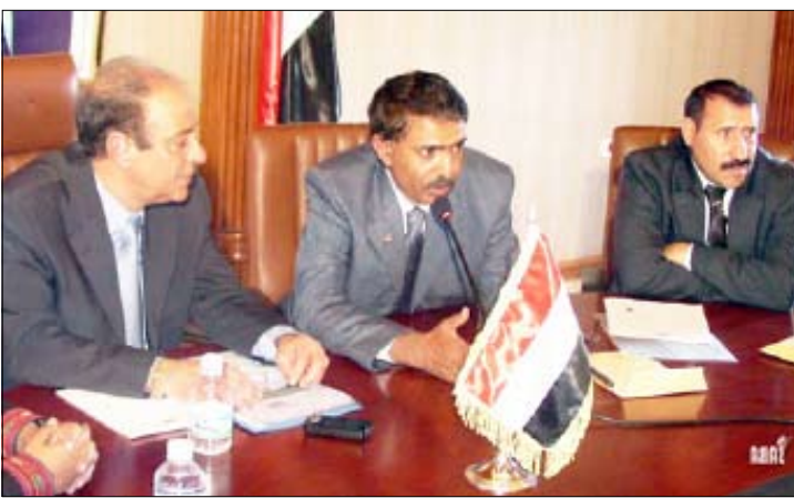
من فعاليات تدريب اللجان الميدانية للإشراف على الانتخابات