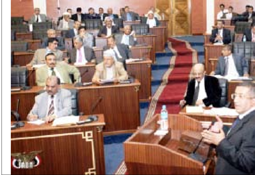
نصره مصطفى يلقى كلمة في مجلس الشورى