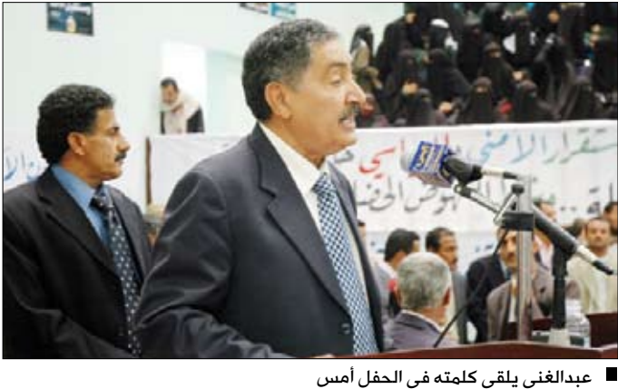
عبدالغني يلقي كلمته في الحفل أمس

أشاد الأخ عبدالعزيز عبدالغني رئيس مجلس الشورى بدور أبناء محافظة البيضاء النضالي الذي كان دوماً وأبداً في صف القضية الوطنية، وكان أبناؤها سندا عظيماً لوطنهم وقت الشدائد والمحن، وكانوا رديف النصر في معاركه الطامرة. وتطرق في حفل خطابي وجهته إلى أبناء محافظة البيضاء إلى التحديات ذات الطابع المحلي التي قال إن مصدرها ثلاث قوى شريرة ممثلة في: عصابة التمرد والتخريب والإرهاب الحوثية في بعض مديريات وعدة وحرف سفبان، وعناصر التخريب والإرهاب الانفصالية، في بعض مديريات المحافظات الجنوبية، والعناصر الإرهابية الظلامية المرتبطة بتنظيم القاعدة. ونبه رئيس مجلس الشورى إلى حقيقة الدور الذي تؤديه أحزاب الحلف المشترك، قائلاً إن تلك الأحزاب تدعي رغبة في الحوار، ولكنها تفقد هذا الحوار مظلته الديمقراطية والدستورية، ليس فقط في طبيعة ما طرحه من اشتراطات غير منطقية، ولكن، بسبب المساندة السياسية والفكرية والإعلامية، التي تقدمها لقوى التخريب الشريرة الثلاث: الحوثية والانفصالية والقاعدية.