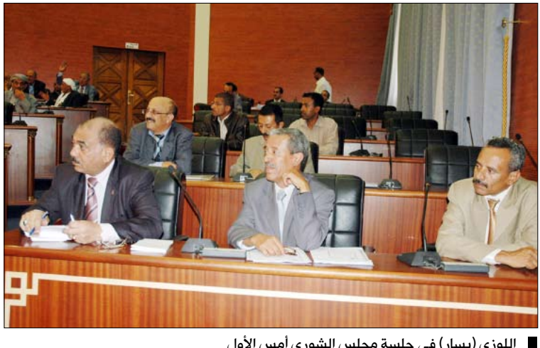
اللوزي (يسار) في جلسة مجلس الشورى أمس الأول

قال وزير الإعلام حسن أحمد اللوزي إن الجمهورية اليمنية بحق لها أن تفخر وبكل اعتراز وهي تحتفل مع العالم بيوم الصحافة بما حققته من إنجازات معاشية ومشاهدة بكل المقاييس في إقامة صحافة يمنية حرة تؤدي دورها الإيجابي السياسي، والاجتماعي بصورة حازت على رضا الشعب وتقدير العالم بالرغم مما تعانيه من بعض التجاوزات وأوجه القصور. وأعتبر اللوزي اللوزي أن مناقشة مجلس الشورى للتعديلات المقترحة على قانون الصحافة والمطبوعات خلال هذه المناسبة العالمية المرموقة يعتبر من أجمل وأروع المصادفات الحميدة، وأن النقاشات الإيجابية المخلصة ورفيعة المستوى التي تدور في المجلس تبشر بالخير وبالتوجه الحريص لدى الجمع نحو تعديلات أفضل لصالح تعزيز حرية الصحافة وترقية المهنة إلى المستوى الذي تدل عليه معاني ودلالات يوم الصحافة العالمي. وأكد وزير الإعلام أن التعديلات الجديدة تستهدف الوصول إلى قانون جديد ينسجم مع المكانة العظيمة التي وصلت إليها اليمن في مجال حرية التعبير وكفالة حرية الصحافة وبما يعزز توجهه القيادي الحكيم بمنح حريص الصحفي لرأي بيده.