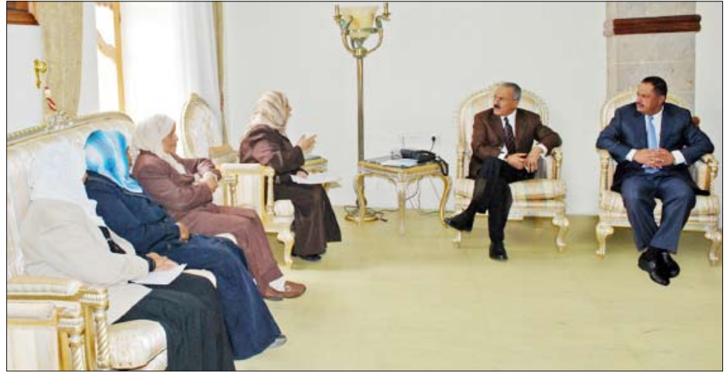
رئيس الجمهورية أثناء لقائه قيادات اتحاد نساء اليمن أمس

استقبل فخامة الأخ الرئيس علي عبدالله صالح رئيس الجمهورية أمس قيادات اتحاد نساء اليمن حيث اطلع الأخ الرئيس على أنشطة وبرامج الاتحاد لخدمة القطاع النسائي. كما جرى خلال المقابلة طرح العديد من القضايا والمواضيع التي تهم المرأة في اليمن ومنها ما يتصل بالزواج المبكر والسمن الآمنة للزواج والقضايا الخاصة بزيادة المشاركة السياسية للمرأة ومشروع تدريب القيادات النسائية وبرنامج الحماية القانونية والاجتماعية والمناصرة للمرأة ومشروع الحماية القانونية للطفل وكذا ما يتعلق بمحو أمية المرأة. وأشادت قيادة اتحاد نساء اليمن بما تحظى به المرأة من رعاية واهتمام وتشجيع من قبل فخامة الأخ الرئيس الذي أتاح أمامها العديد من الفرص للمشاركة في الحياة السياسية العامة وعملية التنمية. وأكدت استعداد المرأة الدائم للإسهام الفاعل إلى جانب أخيها الرجل من أجل تحقيق نهضة الوطن وتقدمه والدفاع عن ثوابته الوطنية. واستعرضن في أحاديثهن ما تتعرض له الفتيات الصغيرات من مشاكل اجتماعية وصحية ونفسية نتيجة زواجهن دون سن البلوغ بالإضافة إلى ما يعكسه ذلك من نتائج سلبية على المجتمع بشكل عام. وقد أكد فخامة الأخ الرئيس أهمية الدور الذي تضطلع به المرأة اليمنية في خدمة الوطن ومسيرة التنمية ونهضته.