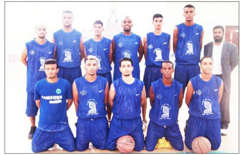
فريق شمسان سلة

فيما هبطت فرق شيام حضرموت، وحدة عدن، وسينون إلى دوري المظالم (الدرجة الثانية) لاحتلالها الثلاثة المراكز الأخيرة. وتخصص الفرق الأربع الأولى في ترتيب الدوري منافسات النسخة الثالثة من بطولة النخبة على كأس الوحدة التي ستقام خلال الفترة من 18 وحتى 20 مايو المقبل في عدن. ويأتي ترتيب فرق دوري الدرجة الأولى في نسخته الـ18 على النحو التالي: المركز الأول - أهلي صنعا - برصيد 31 نقطة