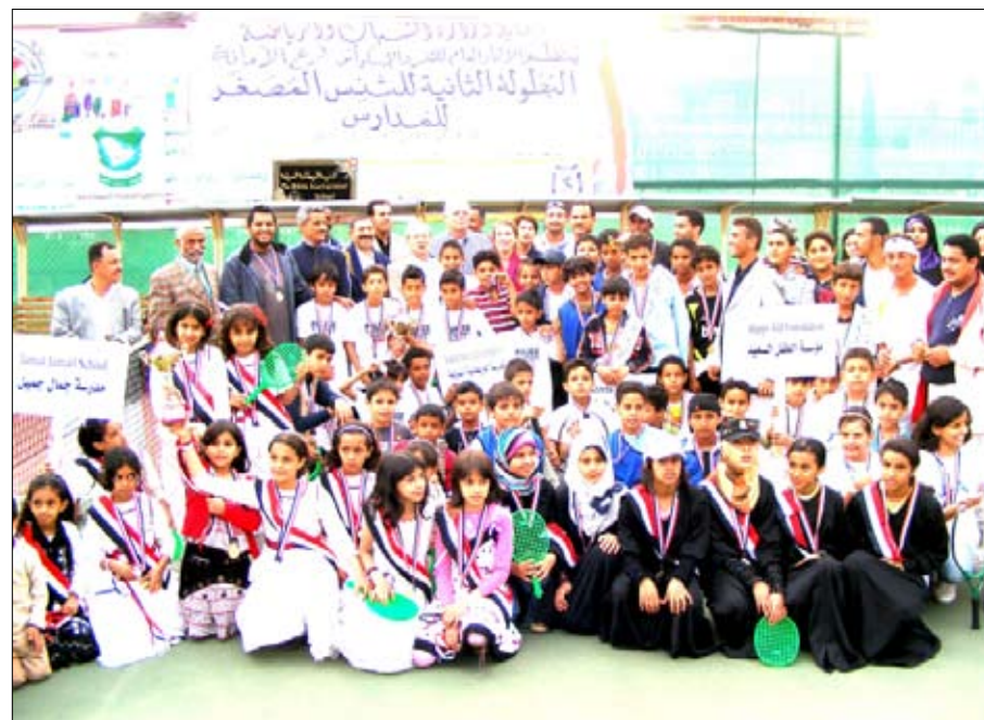
لقطة جماعية للطلاب مع الضيوف

□ صنعا 14 أكتوبر: اختتمت يوم أمس على ملاعب الاتحاد اليمني العام للتنس والاسكواش بصنعا بطولة المدارس الثانوية للتنس المصغر التي شارك فيها طلاب المدارس ما دون سن الثانية عشرة وقد حظيت البطولة باهتمام كبير من جميع المدارس وناقشت جميع الفرق المدرسية على لقب البطولة التي اقامها فرع الأمانة بمقر الاتحاد العام للتنس والاسكواش. وفي نهاية البطولة أسفرت النتائج النهائية عن الآتي: المركز الأول - المدرسة البريطانية الدولية. المركز الثاني - مدرسة وديان حدة. المركز الثالث - مدرسة جمال جميل. الجدير بالذكر أن هذه البطولة تقام سنويا وهذه هي المرة الثانية التي يقمها الفرع ضمن أنشطته وقد اعتلت روح المنافسة والحماسة جميع اللاعبين ويعود الفضل الكبير لمدراء المدارس الذين أبدوا تعاونهم الإيجابي في المشاركة وأثبتوا دعمهم لطلاب مدارسهم رياضيا. وفرع الأمانة يشجع لعبة تنس الميدان في المدارس وذلك بعمل برنامج نزول ميداني والتدريب فيه وتنظيم