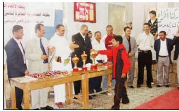
من البطولة وتكريم الأبطال