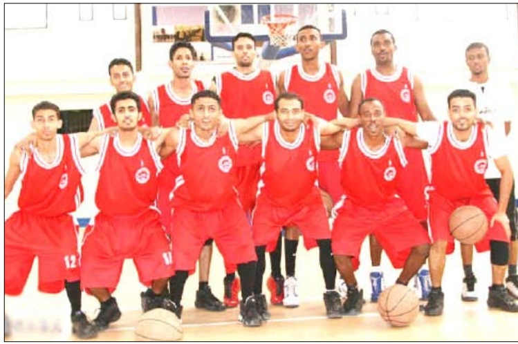
فريق التلال سلة