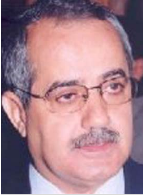
محمد علي الأنسي

قال مدير مكتب رئاسة الجمهورية - رئيس جهاز الأمن القومي، علي محمد الأنسي، إن جهود مكافحة الإرهاب، ضد عناصر القاعدة في اليمن، حققت أهم أهدافها في محاصرة عناصر التنظيم، وحدثت من حركتها وقدرتها على تنفيذ أي عمليات إرهابية في البلاد.