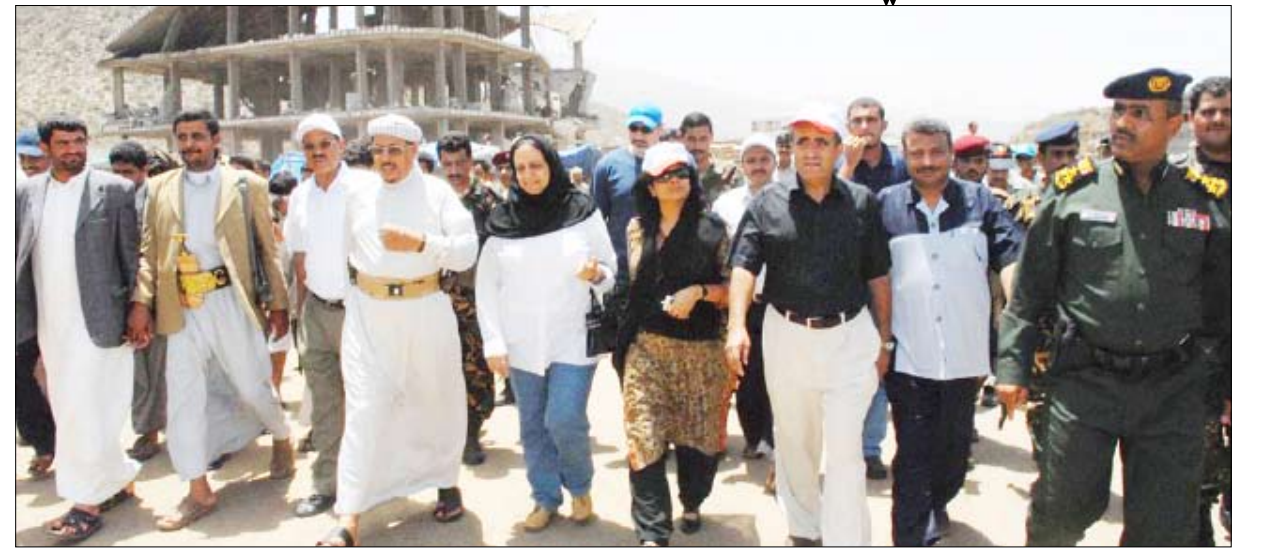
السوسوة والكحلاني ومحافظ حجة خلال زيارتهم لمخيمات النازحين بحرض