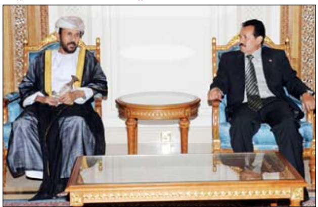
وزير الثروة السمكية مع نظيره العماني لدى مغادرته مسقط