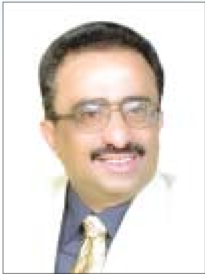
بقلم / أحمد الحيشي

مأزق التحول من إمامة (ولاية المقهيه) إلى الجمهورية الإمبراطورية