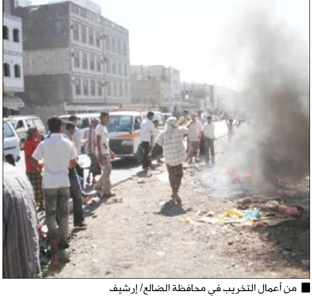
من أعمال التخريب في محافظة الضالع

بلع عدد المشاريع المسجلة بفرع الهيئة العامة للاستثمار بمحافظة عدن خلال الربع الأول من العام الجاري 4 مشاريع بقيمة 6 مليارات و65 مليوناً و54 ألف ريال. وأفادت إحصائية النشاط الاستثماري للربع أن تلك المشاريع توزعت على مشروعين سياحيين ومشروعين في المجالين الصحي والصناعي. وحسب الإحصائية ستوفر تلك المشاريع 73 فرصة عمل.