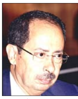
د. عبدالكريم الأرحبي

الإدارة العامة، والذي هو المفتاح لفتح المنطقة على إمكانات كبيرة من أجل التنمية. وقالت «نحن في البنك الدولي نحبي الأرحبي على التزامه الفائق وغير العادي، والتميز الشخصي الذي أهله للفوز بهذه الجائزة». وفي حين أثنت السيدة شمشاد على الخدمة المميزة التي يقدمها الأرحبي.. أكدت أن ما جسده من صفات قيادية وما اتسم به من الصراحة، والنزاهة، والمساءلة خلال فترة ولايته الطويلة في المواقع القيادية للخدمة العامة كانت وراء حصوله على التأييد الكبير من بين المرشحين لنيل الجائزة.. موضحة أن مثل هذه الصفات تكون مطلوبة ومروعة في أصحاب المصلحة في البلاد ويسعى القياديون في القطاع العام إلى التمتع بها.