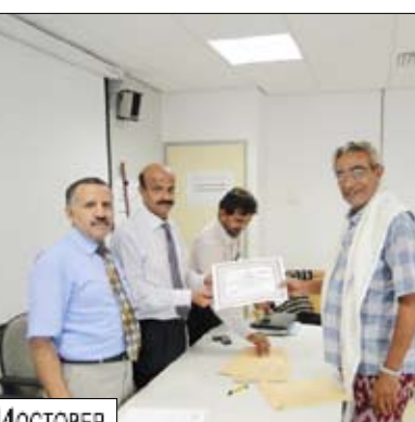
من حفل تكريم موظفي مطار عدن الدولي

في حفل التكريم الذي نظمت إدارة مطار عدن الدولي يوم أمس حفلا كريما لعدد من موظفيها الذين أضحوا إلى التقاعد خلال العام الجاري حيث تم منح أسرتي اثنين من المتوفين مبلغ (خمسمائة وثمانين ألف ريال) لكل أسرة وذلك من قبل صندوق التكافل الاجتماعي.