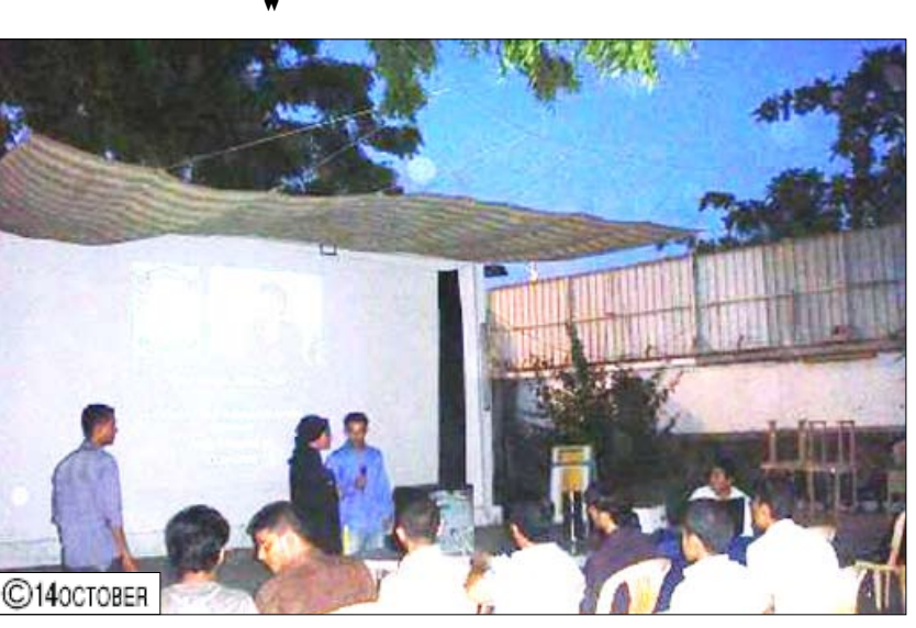
د. مهبجت تحاضر عن فرص التعاون العلمي بين بلادنا وألمانيا

الأكاديمي في ألمانيا وشروط الالتحاق بالجامعات الألمانية، خاصة لكل من يرغب في دراسة علوم الطب في ألمانيا. مشيرة إلى مجالات العمل المتاحة في اليمن لخريجي ألمانيا خاصة في التخصصات الطبية النادرة.