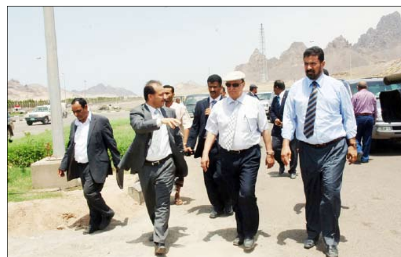
نائب الرئيس يزور عدداً من المشاريع الرياضية في عدن