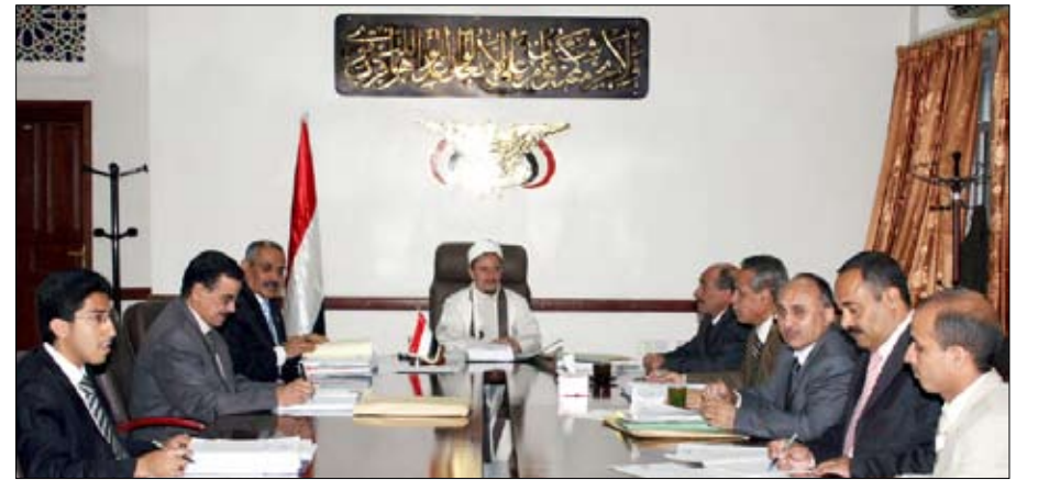
■ السمان يرأس اجتماع مجلس القضاء الأعلى