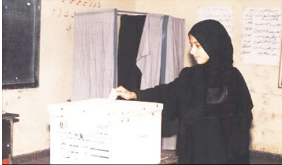
■ من الانتخابات اليمنية

□ صنعاء / سيا : استطلاع : مستور محمد ومحمد قطران :