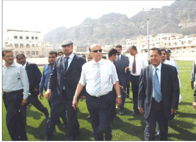
ولدى تفقده ملعب نادي (شمسان)