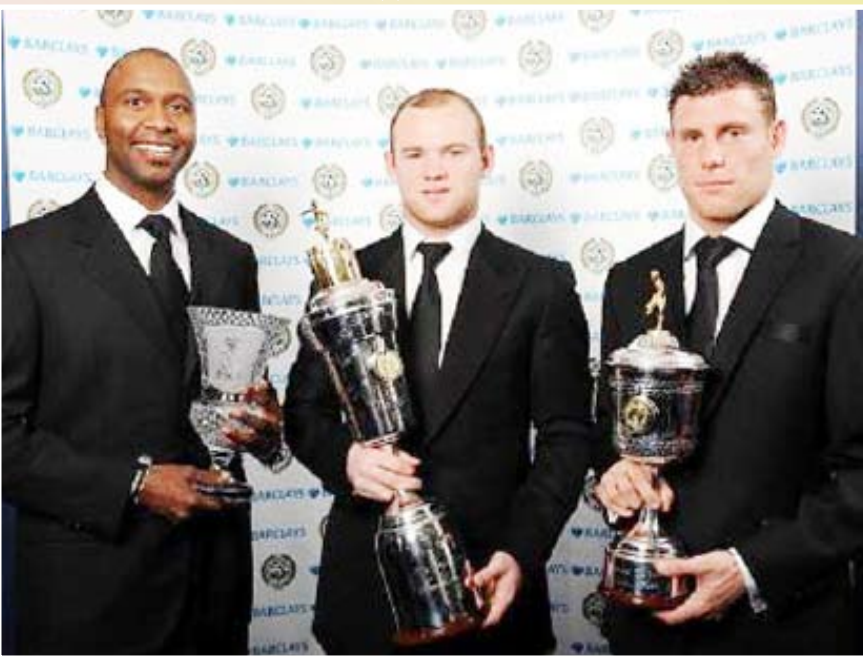
وين روني يحصل على جائزة رابطة اللاعبين المحترفين في إنجلترا لأفضل لاعب