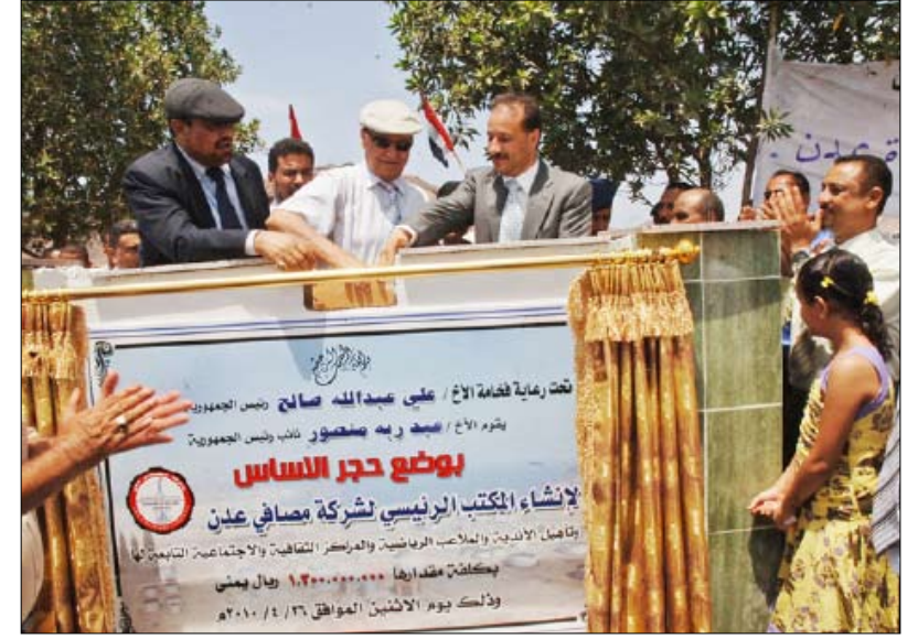
نائب رئيس الجمهورية لدى وضعه الحجر الأساس للمكتب الرئيسي لشركة مصافي عدن