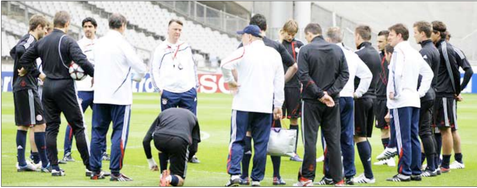
فان غال اعرب عن ثقته الكبيرة في لاعبيه لبلوغ النهائي