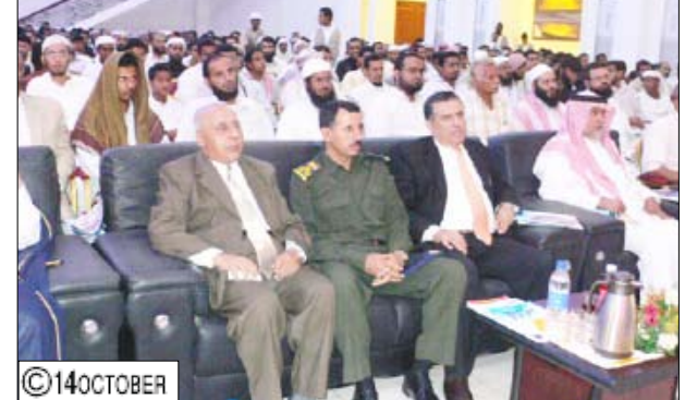
م فعاليات اختتام أسبوع اليتيم الثاني