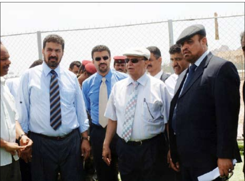
نائب الرئيس يزور أحد الملاعب