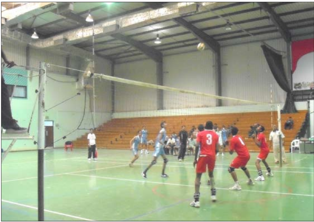
لقطة للكرة الطائرة من الارشيف