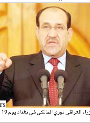
رئيس الوزراء العراقي نوري المالكي في بغداد يوم 19 ابريل نيسان 2010.

وبدلاً من ذلك وفي غياب نتيجة حاسمة زاد عدم اليقين السياسي في الوقت الذي تحاول فيه مختلف الفصائل التفاوض لتشكيل تحالفات تتيح لها الحصول على أغلبية كافية وتشكيل الحكومة العراقية المقبلة. وظهرت هذه الأزمة بينما تبدأ شركات النفط الدولية الاستثمار في حقول النفط العراقية الشاسعة بشكل ربما يضع البلاد في موقف يتيح لها زيادة قدرتها الإنتاجية للنفط أكثر من أربعة أمثال لتصل إلى مستويات السعودية التي تبلغ 12 مليون برميل يومياً. وحققت الحكومة الحالية بزعامه المالكي نجاحات في مواجهة جماعات سنية متشددة في الشهر الماضي بما في ذلك قتل زعيمى القاعدة في العراق.