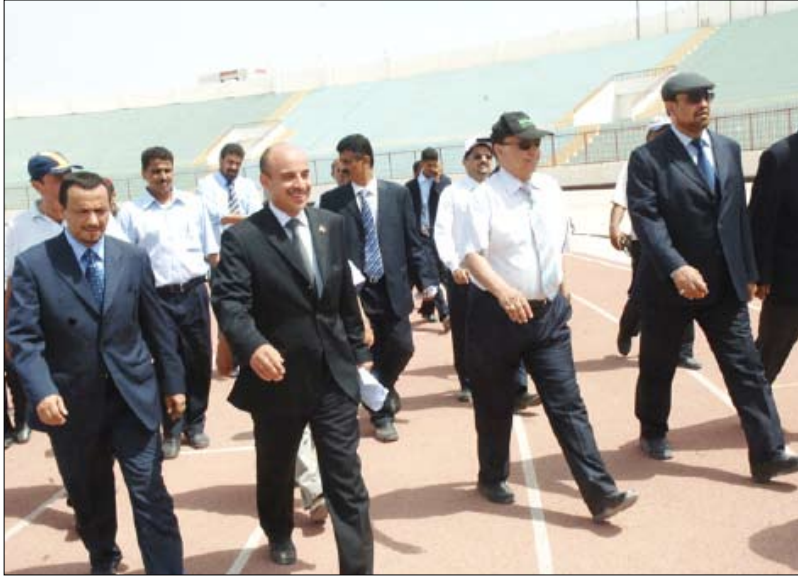
ويتفقد التشطيبات النهائية في ملعب (حققات)