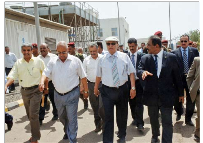
نائب رئيس الجمهورية يزور محطة كهرباء المنصورة بعمية وزير الكهرباء