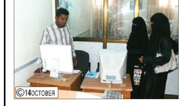
القافلة الشبابية من محافظة المهرة تزور مؤسسة 14 أكتوبر