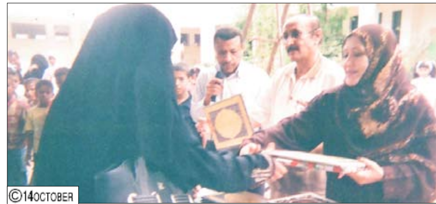
من فعاليات الاحتفال باليوم المدرسي في مدرستي ردفان وخالد حيدر

■ عدن / إسكندر ... احتفلت مدرستا ردفان وخالد حيدر للتعليم الأساسي باليوم المدرسي وعيد المعلم .. حيث أقامت المدرستان حفلين فنيين ومعرضين علميين قدم من خلالها المواهب والمبدعون من الطلاب والطالبات العديد من الإبداعات الفنية والعلمية والرياضية .. وجاء هذا الاحتفال أيضاً فرصة لتكريم العديد من المدرسين والمدرسات الفاعلين في المدرستين والكوادر التربوية التي درست في هاتين المدرستين وأجروا للتقاعد عرفاناً لما قدموه من خدمات جليلة للأجيال السابقة واللاحقة . حيث قام الأخ مدير مديرية الشيخ عثمان والأخت مديرة التربية والتعليم وأعضاء المجلس المحلي بتسليمهم الشهادات التقديرية والهدايا المتواضعة ..