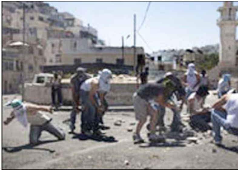
شبان فلسطينيون يرمون الشرطة الإسرائيلية بالحجارة

القدس قبل أسابيع زاعمة أن تلك المنازل سُئِدَتْ دون ترخيص. وهو ما يهدد بتشريد نحو 1500 مواطن من سكانها. وتخطط بلدية القدس لإقامة ما تسميه الحدائق التلمودية مكان المنازل المزمع هدمها في سلوان. وفي الشأن السياسي، تلقى الرئيس الفلسطيني محمود عباس دعوة من الرئيس الأمريكى لزيارة واشنطن الشهر القادم لبحث سبل إحياء المفاوضات مع إسرائيل. وقال كبير المفاوضين في منظمة التحرير الفلسطينية صائب عريقات الأحد إن الدعوة سلمها ميتشل الذي التقى عباس الجمعة في رام الله. وقال ميتشل على وقت اختتم ميتشل زيارته للمنطقة دون الحصول على موافقة الفلسطينيين على إجراء محادثات غير مباشرة مع إسرائيل. مع تكهات بحدوث انفراج في هذا الشأن قريبا. وأكد ميتشل إنه قد يعود للمنطقة الأسبوع القادم، مشيراً إلى أن نائبه ديفيد هيل سيظل في المنطقة للعمل مع الأطراف المعنية وإعداد لزيارته القادمة. وأكدت مصادر فلسطينية أن المبعوث الأمريكى لم يجلب التزاماً إسرائيلياً بوقف الاستيطان الإسرائيلي وإنما طلباً أميركياً ببدء المحادثات الفلسطينية الإسرائيلية غير المباشرة بوساطة أميركية مع التزام أميركى بالعمل من أجل حل الدولتين.