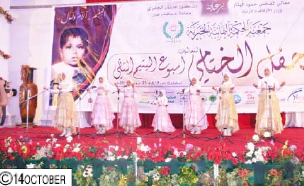
م فعاليات اختتام أسبوع اليتيم الثاني

وحوى الحفل الختامي عدداً من الفقرات والعروض والمجاهد التمثيلية التي نالت استحسان الحضور.