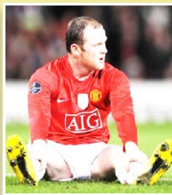
١٤ أكتوبر / رويترز:

توج واين روني تلقه في الدوري الإنكليزي الممتاز لكرة القدم بحصوله على جائزة رابطة اللاعبين المحترفين في إنكلترا لأفضل لاعب هذا