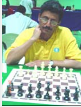
الحضرائي بطل البطولة الماضية