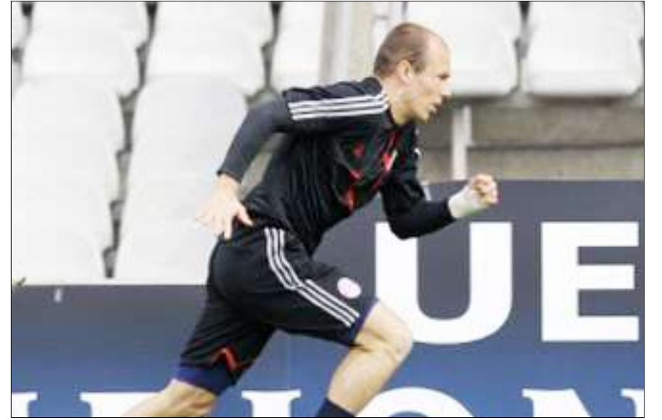
النجم الهولندي ايرين روبن

الدولي جيريمي تولان لطرده ذهباً. ويعقد ليون أملاً كبيرة على مهاجمه الأرجنتيني ليساندرو لوبيز ولاعب الوسط البوسني ميرالين بيانيتش والأرجنتيني سيزار دلغادو والسويدي كيم كالستروم. وقال لوبيز «لقد فعلنا ما أمام ريال مدريد ونملك الفرصة لتكرار ذلك أمام بايرن، نملك فريقاً قوياً وعازماً على دخول التاريخ من الباب الواسع ببلوغ المباراة النهائية»، وأضاف «مباراة الغد (اليوم) تختلف كثيراً عن مباراة الذهاب عندما لعبنا بخطة دفاعية، غدا سنلعب بمهجمين وسنسعى إلى هز الشباك لأننا مطالبون بذلك، لكن علينا الحذر من بايرن ميونخ لأنه فريق كبير وأبنا عن ذلك في مبارياته خارج قواعده حيث يسجل أهدافاً كثيرة وحاسمة».