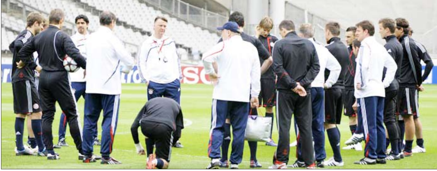
فان غال اعرب عن ثقته الكبيرة في لاعبيه لبلوغ النهائي