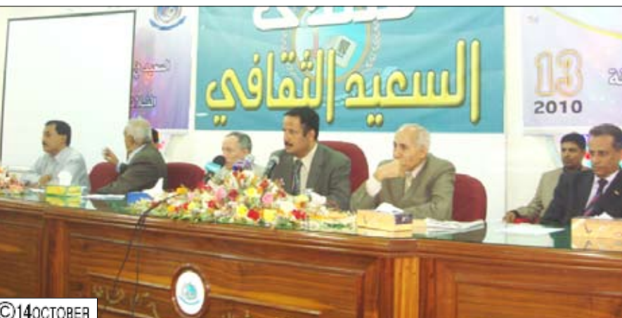
محافظ تعز يشدن فعاليات مهرجانها الثقافي للسعيد