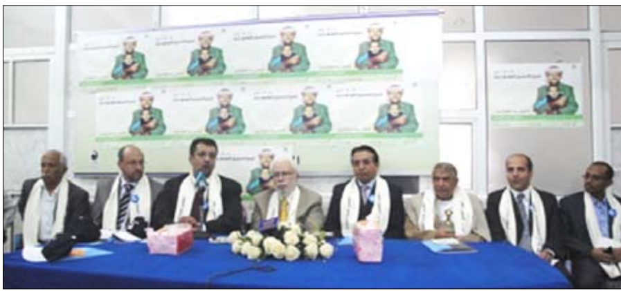
خلال تدشين فعاليات التحصين الموسع

د. الخياط: التحصين في اليمن شهد تقدماً كبيراً وأصبح نموذجاً في الإقليم