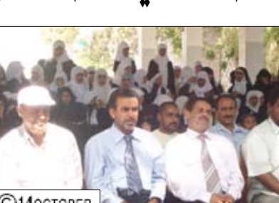
محافظ تعز يشدن فعاليات مهرجانها الثقافي للسعيد