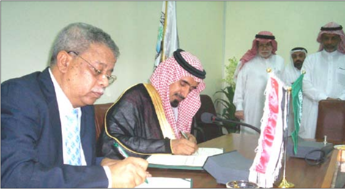
أثناء توقيع الاتفاقية