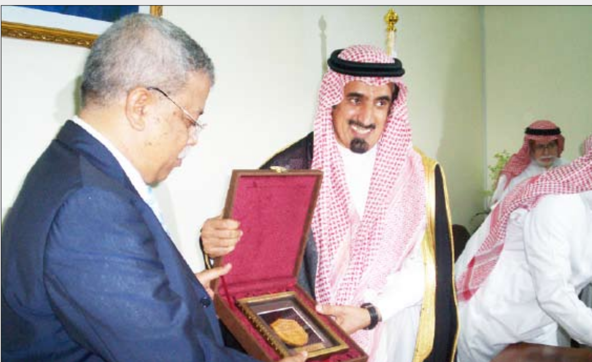
من وقائع تبادل الدروع بين الجامعتين

وأوصى المشاركون بإعداد خارطة طريق للمرحلة اللاحقة لهذه الورشة لتحديد الإجراءات الفعلية لتنفيذ المشاريع المقترحة في الخطة، والجهات المعنية بالتنفيذ وصولاً إلى تحقيق الأهداف المتوخاة.