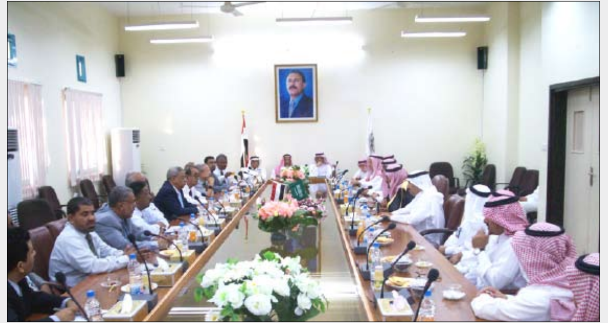
من جلسة المباحثات بين الجامعتين