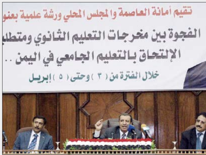
■ من فعاليات ورشة حول الفجوة بين مخرجات التعليم