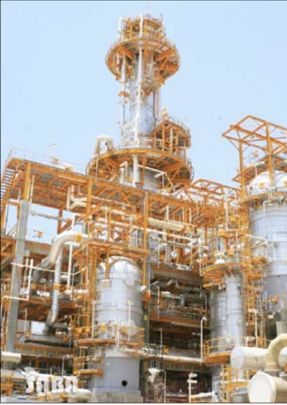
■ أحد منشأة غازية