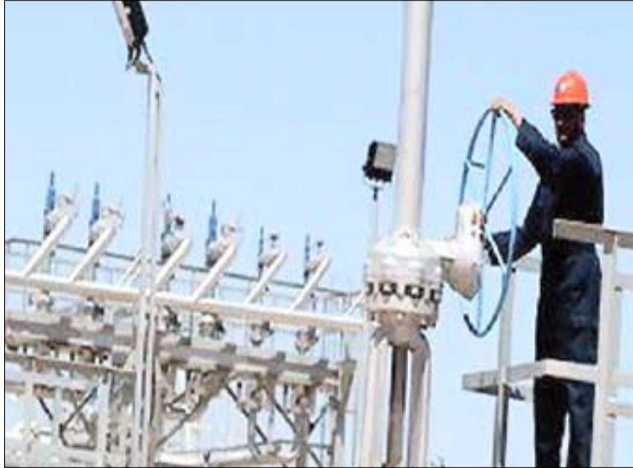
■ وزير النفط يزور خط الإنتاج الثاني بمشروع الغاز الطبيعي المسال

أكد رئيس هيئة استكشاف وإنتاج النفط الدكتور أحمد علي عبد الله أن اليمن يمتلك مقومات تمكنه من بناء شراكة إقليمية في جوانب متعددة وفي قطاع البترول بشكل خاص. وأشار في كتابه الصادر حديثاً بعنوان « البترول والتنمية في اليمن» إلى أن من هذه المقومات واعدية الأراضي اليمنية القارية والبحرية في وجود مكامن كثيرة ومتعددة للاحتياطيات النفطية والغازية والخليج يمتلك شركات خاصة ومجمعات مالية ترغب في أن تحصل على امتيازات في هذا الجانب.