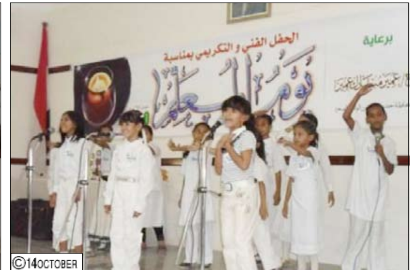
مدرسة النهضة بسيئون