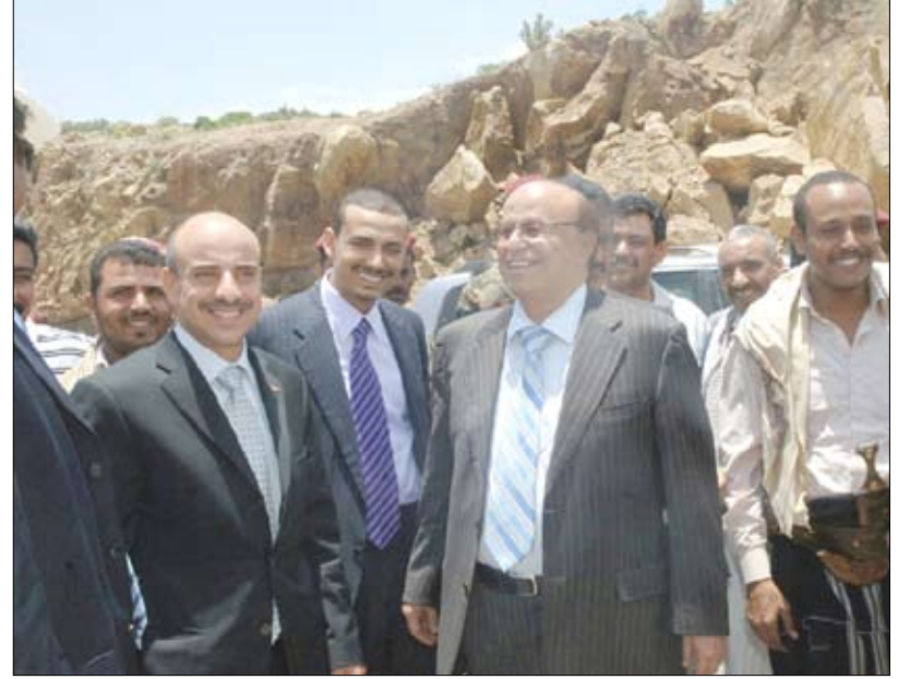
■ نائب رئيس الجمهورية لدى تفقده عدداً من المشاريع في محافظة تعز