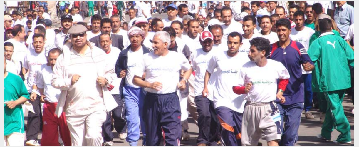
من فعاليات مهرجان اليوم الوطني للعربي للرياضة للجميع