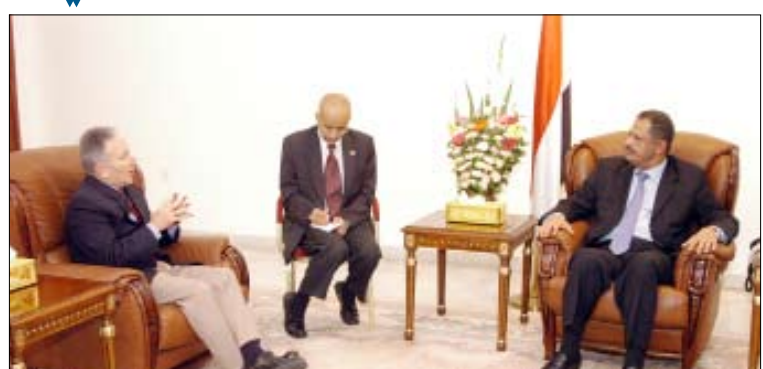
رئيس الوزراء لدى استقباله السفير الأمريكي أمس

ناقش رئيس مجلس الوزراء الدكتور علي محمد مجور يوم أمس الاثنين بصنعاء مع سفير الولايات المتحدة الأمريكية السيد/صنعاء ستيفن سيش علاقات التعاون والصدقة بين البلدين الصديقين في المجالات الاقتصادية والتجارية وسبل تعزيزها.