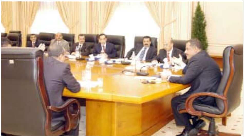
د. مجور يترأس اجتماع لجنة السياسات العامة الخاصة بانضمام اليمن إلى منظمة التجارة العالمية أمس

أقرت لجنة السياسات العامة المختصة بانضمام اليمن إلى منظمة التجارة العالمية في اجتماعها يوم أمس الاثنين برئاسة رئيس مجلس الوزراء الدكتور علي محمد مجور خطة العمل المزمعة لانضمام اليمن إلى المنظمة نهاية العام الجاري 2010م. وتشمل الخطة مجموعة من الأنشطة منها تحديث مسودة تقرير فريق العمل والاجتماع التشاوري مع أعضاء فريق العمل بسكرتارية المنظمة والقاء الجماعي حول الزراعة وتوحيد جدول السلع والخدمات وانهاء وتوزيع مسودة تقرير فريق العمل والاجتماع النهائي للفريق لاعتماد حزمة الانضمام وغيرها من الأنشطة ذات الصلة بهذه العملية.