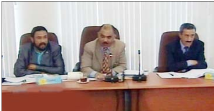
اللوزي يلقى كلمته في افتتاح اجتماع اللجنة العليا للتخطيط البرامجي بالمؤسسة العامة للإذاعة والتلفزيون أمس

حث وزير الإعلام حسن اللوزي وسائل الإعلام الرسمية المسبوعة والمرئية على رفع وتيرة العمل خلال الدورة البرمجية الجديدة والتوسع في مواجهة التحديات السياسية والأمنية والاقتصادية التي يواجهها الوطن على مختلف الأصعدة.