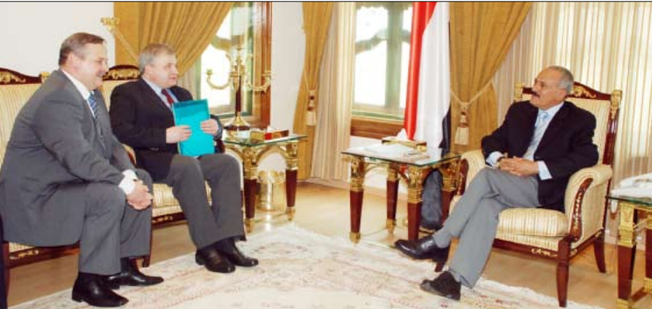
.. ولدى استقباله النائب الأول لوزير الخارجية الروسي أمس