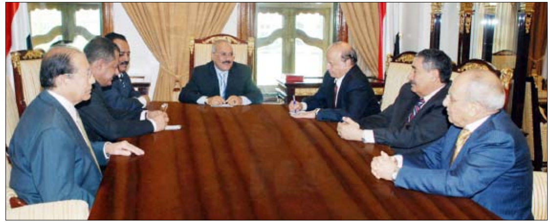
رئيس الجمهورية أثناء ترؤسه اجتماع القيادات العليا للدولة أمس

رأس فخامة الأخ علي عبدالله صالح رئيس الجمهورية أمس اجتماعاً للقيادات العليا للدولة جرى فيه الوقوف أمام العديد من القضايا والمستجدات التي تهم الوطن وفي مقدمتها التطورات السياسية والجوانب الاقتصادية والتنمية. كما وقف الاجتماع أمام التوجهات الصادرة من فخامته خلال زيارته الأخيرة إلى محافظة حضرموت وفي مقدمتها الإسراع في توليد الطاقة الكهربائية بالمصاحبة بقدرة 150 ميجاوات لتلبية احتياجات المواطنين في محافظة حضرموت واحتياجات الصناعة. واطلع الاجتماع على تقرير عن الجوانب الاقتصادية والإجراءات المتخذة من الحكومة إزاءها.. وأكد مواصلة الجهود المبذولة في المجال الاقتصادي والإصلاحات والتسريع بجهود التنمية على مختلف الأصعدة. وناقش الاجتماع العديد من القضايا والموضوعات المدرجة في جدول أعماله واتخذ إزاءها القرارات المناسبة.