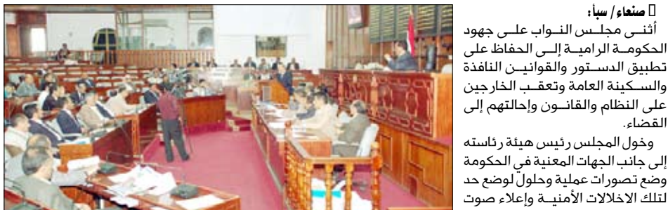
من جلسة مجلس النواب أمس

إطار الدستور والقانون والنظام العام. وعبر التقرير الذي قدمه إلى المجلس نائب وزير الداخلية اللواء صالح الزوعري بحضور نائب رئيس الوزراء لشؤون الدفاع والأمن وزير الإدارة المحلية الدكتور رشاد محمد العليمي ووزير الدفاع اللواء محمد ناصر احمد عن شكر الحكومة للبرلمان على اهتمامه العالي وشعوره بالمسؤولية الوطنية تجاه قضايا الوطن ومواطنيه والتي يخصص لها المجلس حيزاً كبيراً في أعماله ومداولاته وتجد تعبيرها وانعكاسها في نتائج قراراته وتوصياته بصورة منتظمة.