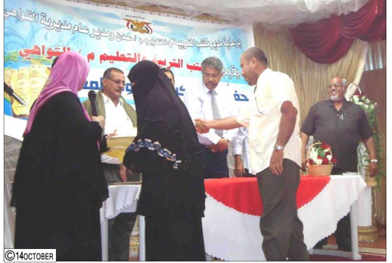
من فعاليات يوم المعلم في مدارس التواهي