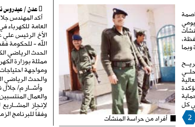
أفراد من حراسة المنشآت

وجهت قيادة وزارة الداخلية مدير أمن العاصمة وممرات أمن المحافظات بالنزول الميداني اليومي لتفقد الخدمات الأمنية المكلفة بحماية المنشآت والمرافق الحيوية الموجودة في كل محافظة، ورفع تقارير يومية بذلك إلى قيادة الوزارة وبما يكفل عدم حدوث أي خروقات أمنية. وشددت قيادة الوزارة في تصريح لمرکز الإعلام الأمني على أهمية تحلي الخدمات الأمنية باليقظة والجاهزية العالية لمواجهة مختلف الاحتمالات وأي طارئ، مؤكدة أهمية التقييم الدائم والمستمر لمستوى الحماية للمرافق والمنشآت الحيوية الموجودة في كل محافظة لتجاوز أي قصور