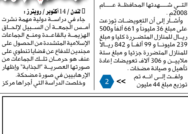
توزيع مبلغ 44 مليون

التي شهدتها المحافظة عام 2008م. وأشار إلى أن التعويضات توزعت على مبلغ 36 مليوناً و 661 ألفاً و 500 ريال للمنازل المتضررة كلياً و مبلغ 239 مليوناً و 99 ألفاً و 842 ريالاً للمنازل المتضررة جزئياً و مبلغ ستة ملايين و 306 آلاف تعويضات إعادة تأهيل وصيانة مضافاً. ولفت إلى أنه تم توزيع مبلغ 44 مليون