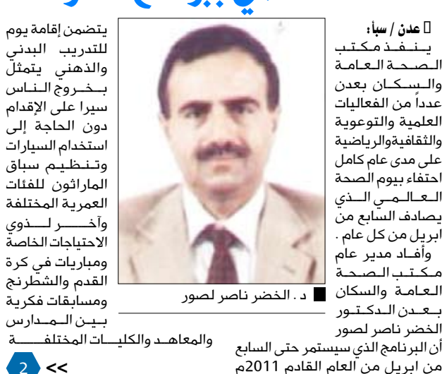
د. الخضر ناصر لصور

يضمن إقامة يوم للتدريب البدني والذهني يتمثل بكسوخ الناس سيراً على الأقدام دون الحاجة إلى استخدام السيارات وتنظيم سباق الماراثون للفئات العمرية المختلفة وآخر لذوي الاحتياجات الخاصة ومباريات في كرة القدم والشطرنج ومسابقات فكرية بين المدارس والمعاهد والكلية المختلفة من أبريل من العام القادم 2011م