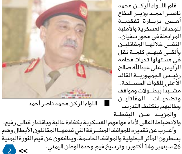
اللواء الركن محمد ناصر أحمد

قام اللواء الركن محمد ناصر أحمد وزير الدفاع أمس بزيارته تفقدية للوحدات العسكرية والأمنية المرابطة في محور سفيان. التقى خلالها بالمقاتلين والقى فيهم كلمة نقل في مستهلها تحيات فخامة الرئيس علي عبدالله صالح رئيس الجمهورية القائد الأعلى للقوات المسلحة. مشيداً ببطولات ومواقف وتضحيات المقاتلين وطولهم بتكثيف التدريب والمزيد من اليقظة والانضباط العالي لأداء مهامهم العسكرية بكفاءة عالية وباقتدار قتالي رفيع. وأعرب عن تقديره للمواقف المشرفة التي قدمها المقاتلون الأبطال وهم يسطرون المآثر البطولية والمواقف الحاسمة، ويدافعون عن قيم الثورة اليمنية 26 سبتمبر و 14 أكتوبر، وترسيخ قيم وحدة الوطن اليمني.