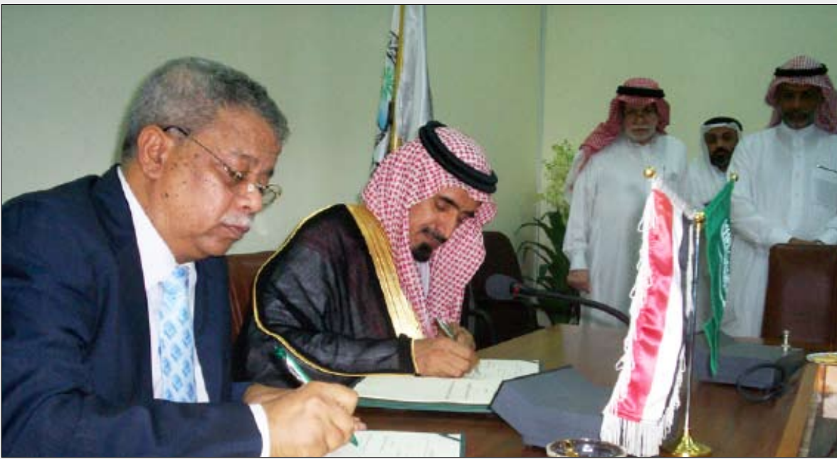
■ أثناء توقيع الاتفاقية