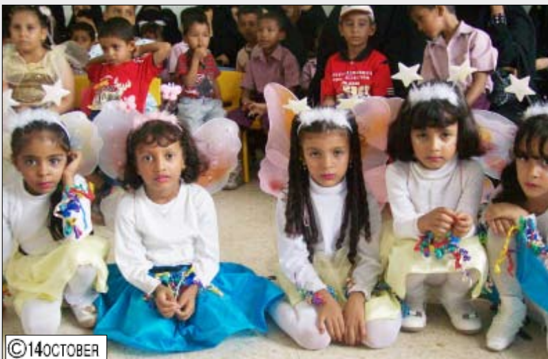
زهراء روضة البراعم المشاركات في الملتقى