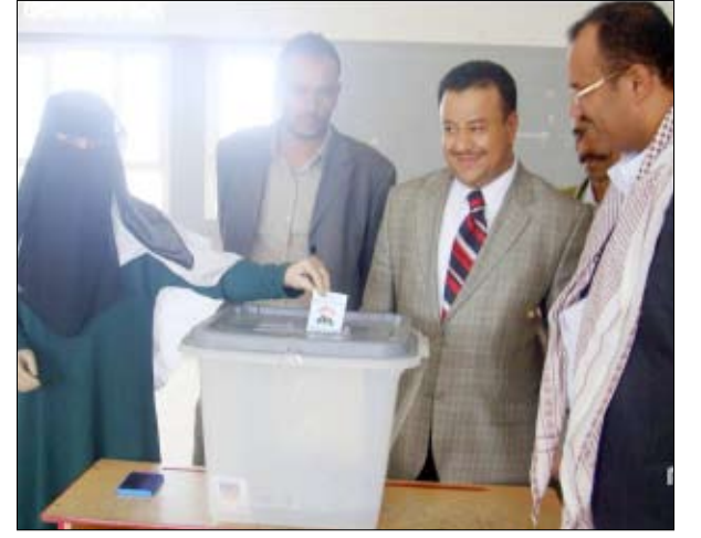
من انتخابات برلمان الأطفال في محافظات الجمهورية