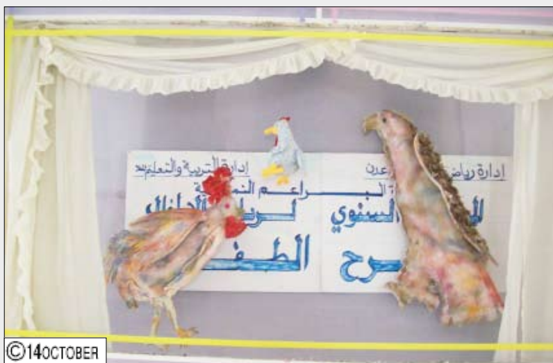
مشهد من مسرحية (الديك ذو القرن الأحمر) تعرض بواسطة العرائس المتحركة