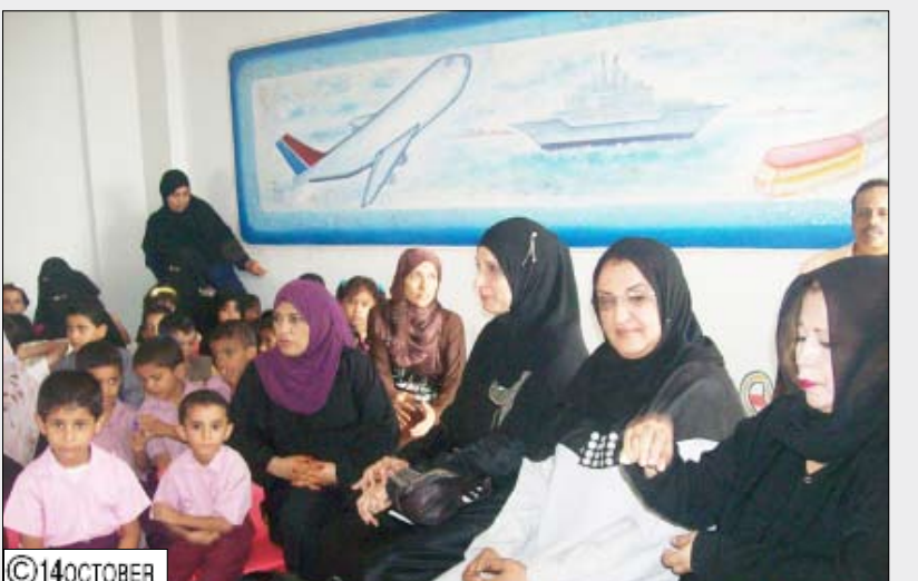
جانبة من الحضور