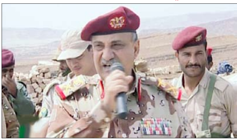
وزير الدفاع يلقي كلمته أثناء تفقده أحوال المقاتلين في بعض الوحدات العسكرية بصعده أمس