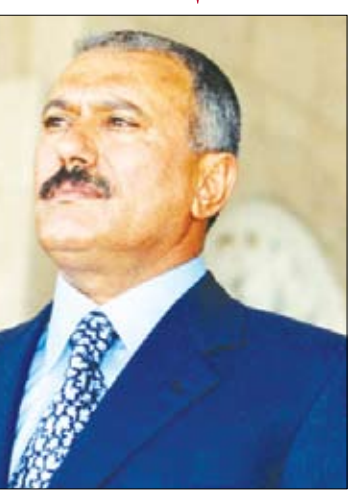
محافظ حضر موت في رسالة شكر وتقدير لفخامة رئيس الجمهورية:

رفع محافظ محافظة حضر موت رئيس المجلس المحلي بالمحافظة الأخ سالم أحمد الخنيسي بريقة شكر وعرفان وتقدير لفخامة الأخ الرئيس على عبدالله صالح رئيس الجمهورية بمناسبة اختتام زيارته الأخيرة للمحافظة وما حققته تلك الزيارة من نجاحات في مختلف المجالات الحياتية والاقتصادية والتنموية لمحافظة حضر موت.