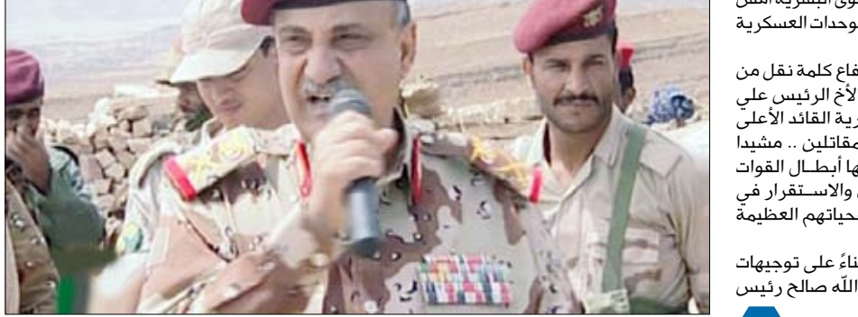
وزير الدفاع يلقي كلمته أثناء تفقده أحوال المقاتلين في بعض الوحدات العسكرية بصعده أمس