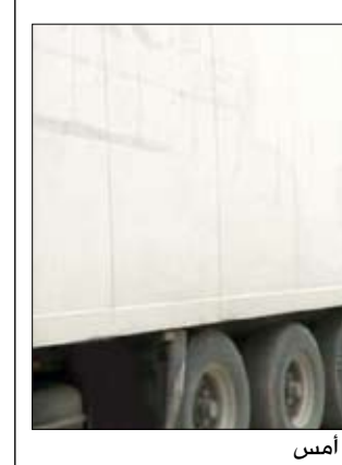
لدى وصول شحنة المساعدات الكويتية أمس

وأوضح مصدر أممي أن المدعو أنور العولقي هو أحد المطلوبين من قبل أجهزة الأمن اليمنية على خلفية اتهامه بالارتباط بتنظيم القاعدة وصلته بعدد من المتورطين في أعمال إرهابية، والتخريب على مثل هذه الأعمال. وأكد أن الأجهزة الأمنية تقوم حالياً بتعقب المذكور ومتابعته.