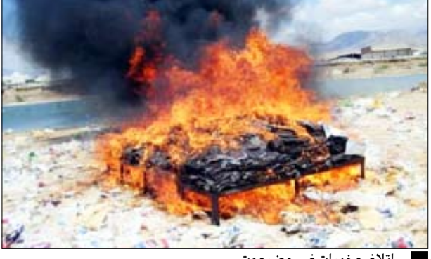
إتلاف مخدرات في حضرموت

المخدرات، متجاهلين أنها سموم قاتلة تهدد صحة الإنسان فضلاً عن كون ذلك يتنافى مع قيم ومبادئ ديننا الإسلامي الحنيف. وبعد خروجها على القانون الذي يحرم تعاطيها أو الاتجار بها نظراً لمخاطرها وأضرارها الكبيرة على الفرد والأسرة والمجتمع .. مؤكداً أن أجهزة الأمن والمواطنين