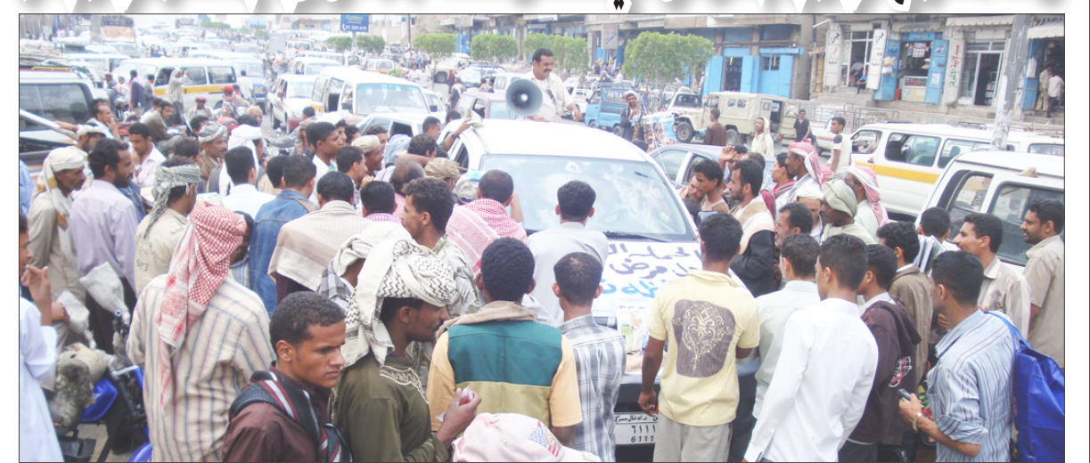
■ حملته توعية بمخاطر الأيدز بتغر

بهدف غرس معلومات جديدة عن المرض مع التركيز على واقع الأيدز باليمن والوصية المجتمعية، وأما المرحلة الثالثة فكانت مهرجاناً ختامياً للحملة. وأوضح أن الأيدز قد أصبح واقعاً بيننا وعلينا التسليم به، وأن الأيدز ليس له جنسية ولا يعرف كبيراً أو صغيراً يمينياً أو أجنبياً، وأن هناك أكثر من (2800) مصاب باليمن بحسب الأرقام المعلنة.