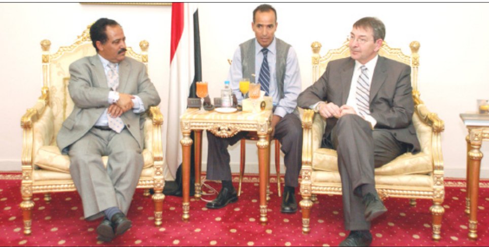
الراعي يلتقي الوفد البرلماني الألماني

ندعو رجال الأعمال الألمان إلى الاستثمار في اليمن والاستفادة من التسهيلات القانونية رئيس الوفد الألماني : الوحدة اليمنية شكلت منطلقاً قوياً لإعادة تحقيق الوحدة الألمانية