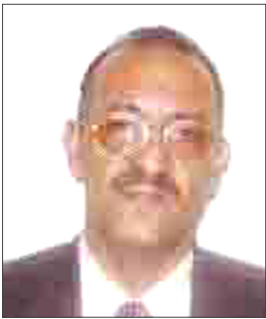
■ مجاهد الشعب

صحيفة 14 أكتوبر التقت على هامش الحملة عدداً من المختصين والتربويين والطلاب وتعرفت على وجهة نظرهم حول هذه الفعاليات ... فإلى التفاصيل :-