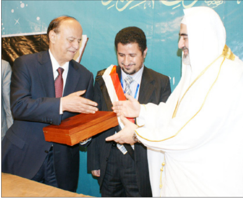
نائب الرئيس يكرم أحد الحفاظ