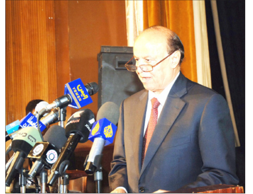
نائب الرئيس يلقي كلمة في افتتاح الملتقى