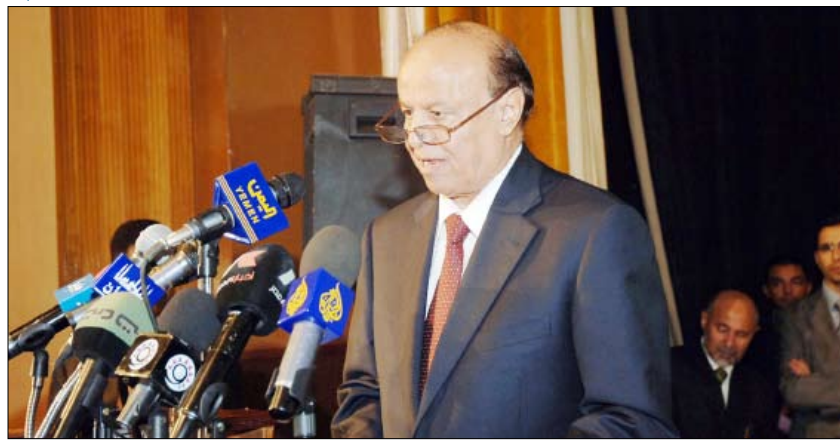
نائب الرئيس يلقي كلمته في افتتاح الملتقى أمس

واحياء لأزمات التعصب المذهبي والطائفي واضرار بالوطن الأمة بعد أن ارتهنوا للتأويلات والاجتهادات الخاطئة التي وصلت إلى تفكير الآخرين. وقال الأخ عبدربه منصور هادي " لقد حرصنا في القيادة السياسية بزعامة فخامة الأخ الرئيس علي عبدالله صالح، على ترسيخ نهج الوسطية والاعتدال وتحرير الخطاب الديني من الغلو والتطرف وتنقيته من شوائب التشدد الذي يقود إلى الإرهاب". وأضاف " إن اليمن ستبقى منهلًا صافيا ومباركا للعلوم الدينية الصحيحة والاجتهادات الفقيه السليمة وثقافة التسامح والاعتدال والمحبة والإخاء". وحدت المؤسسات الرسمية والشعبية المعنية بتحفيظ القرآن الكريم على الالتزام بالاعتدال والوسطية والاعتدال، وتجنب كل ما يترسخ نزعات الطائفية والمذهبية والعمل لها من شأنه جمع الصف والكلمة والإسهام في تصحيح الصورة المغلوطة عن الإسلام لدى الآخرين.