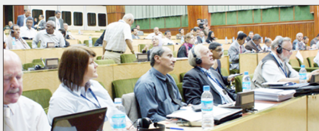
جانب من المشاركين