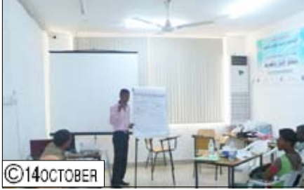
من فعاليات الدورة التدريبية في مهارات تنفيذ حملات التوعية