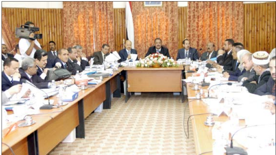
اجتماع مجلس الوزراء برئاسة د. مجور في سينون أمس

المماثلة. ووجه المجلس أثناء الاجتماع الذي شاركت فيه قيادات السلطة المحلية بمحافظة حضرموت والمهرة وأعضاء مجلس إدارة الصندوق وعدد من أعضاء مجلسي النواب والشورى والشخصيات الاجتماعية، وجه الإدارة التنفيذية للصندوق بالقيام خلال فترة أقصاها شهر من تاريخه باستكمال دفع بقية أقساط التعويضات للمتضررين جزئياً دفعة واحدة، وتعويض المتضررين كلياً على قسطين على أن يتم الانتهاء من دفع القسطين خلال ثمانية أشهر من تاريخه. وأقر المجلس إشراك الصندوق الاجتماعي للتنمية ومشروع الأشغال العامة في عملية إعادة بناء وتأهيل المدارس والوحدات الصحية المتضررة بما يكفل التسريع بإعادة بنائها. وكان الاجتماع قد ناقش تقرير الإنجاز لصندوق إعادة إعمار محافظتي حضرموت والمهرة من الإدارة التنفيذية وذلك للفترة من مارس 2009م، وحتى نهاية مارس 2010م، في مختلف المجالات التي تدرج في إطار اختصاصات الصندوق.