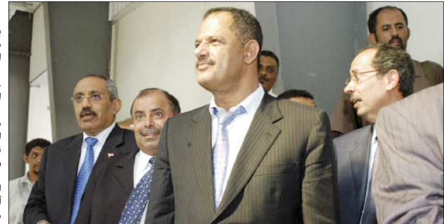
د. مجور يطلع على أعمال الترميم في مدينة تريم أمس

اطلع رئيس مجلس الوزراء الدكتور علي محمد مجور خلال زيارته يوم أمس الثلاثاء لمدينة تريم على ما شهدته هذه المدينة التاريخية من أعمال ترميم وتطوير للبنى التحتية باعتبارها عاصمة للثقافة الإسلامية للعام 1431 هـ الموافق 2010م. كما اطلع رئيس مجلس الوزراء على التجهيزات والترميمات التي جرت لعدد من القصور التاريخية في المدينة والتي تعتبر من روائع العمارة اليمنية. واستمع الدكتور مجور من وزير الثقافة ومحافظ حضرموت إلى ما يتضمنه برنامج فعاليات تريم عاصمة للثقافة الإسلامية للعام الجاري، من برامج ثقافية وندوات ومحاضرات عما تتميز به مدينة تريم وما تكتنزه من مآثر إسلامية والجهود المبذولة لحمايتها والحفاظ عليها. وأشار رئيس الوزراء إلى أهمية أن تكون الفعاليات عند مستوى اختيار مدينة تريم الغناء عاصمة للثقافة الإسلامية، والتعريف بدور أبنائها في نشر الثقافة الإسلامية في مختلف أصقاع المعمورة. متمنياً لفعاليات تريم عاصمة الثقافة الإسلامية النجاح في تحقيق الأهداف المنشودة منها في التعريف بما تزرخ به هذه المدينة من معالم عمرانية نادرة ورموز وتراث ثقافي وحضاري.