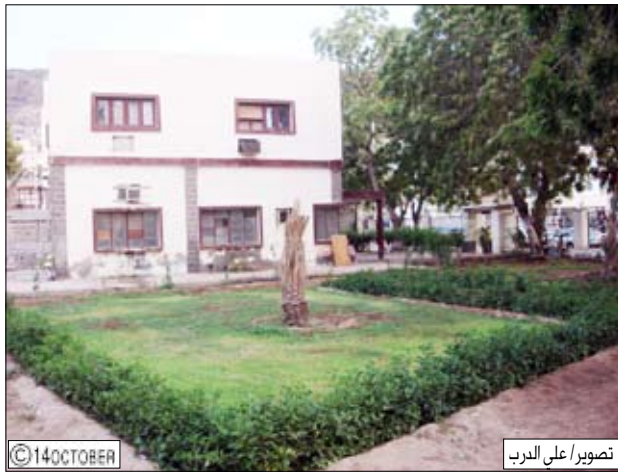
أعمال تشجير وتحسين حديقة نقابة الصحفيين

عقد صباح اليوم الأربعاء بقاعة نادي الميناء الرياضي في التواهي أعمال المؤتمر الفرعي الرابع لنقابة الصحافيين اليمنيين في عدن بمشاركة مائتين وواحد وخمسين عضواً يمثلون قوام الجمعية العمومية لمحافظة عدن.