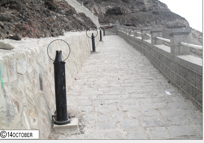
الطريق إلى قلعة صيرة و على جانب منه الإنارة مكسرة