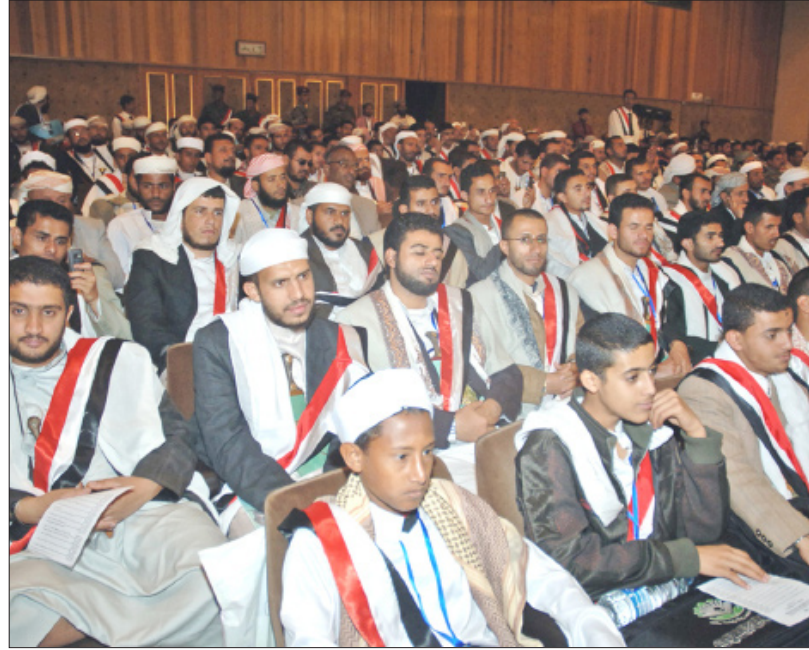
جانب من حفظة القرآن