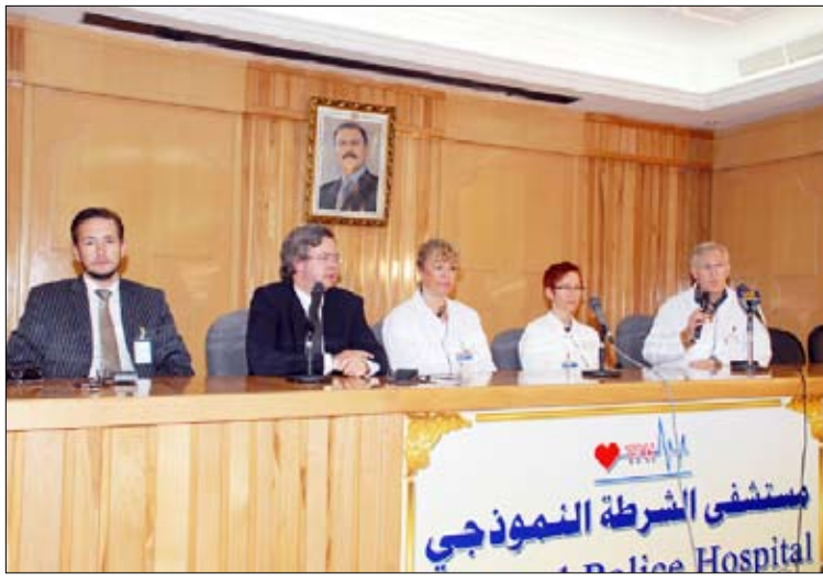
من فعاليات المؤتمر الصحفي