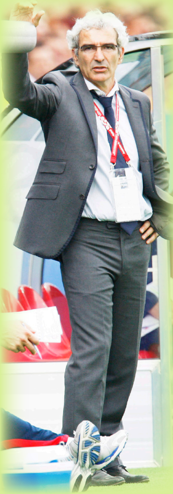
ريمون دومينيك مدرب المنتخب الفرنسي

باريس / 14 أكتوبر / متابعة : أكد ريمون دومينيك مدرب منتخب فرنسا لكرة القدم أنه «سيقضي على غرور اللاعبين الذين لن يضعوا الفريق في أولوياتهم»، وذلك خلال منافسات كأس العالم في جنوب إفريقيا. وذكرت صحيفة «ليكيب» الفرنسية يوم أمس الثلاثاء عن دومينيك قوله «يجب أن يتخطوا غرورهم ويفكروا بأن الفريق هو الأهم، وليس هم. إذا لم يفهموا ذلك، سيكون ردي عنيفاً». وأضاف دومينيك أنه لن يفضل لاعبا على آخر، وأن أي لاعب معرض للاستبعاد في حال كان سلوكه سيئاً. ومن المنتظر أن يعلن دومينيك قائمة اللاعبين الذين سيشاركون في كأس العالم في 11 أيار (مايو) المقبل.