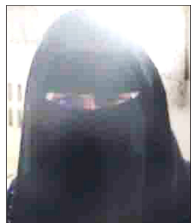
■ بغداد العرشي