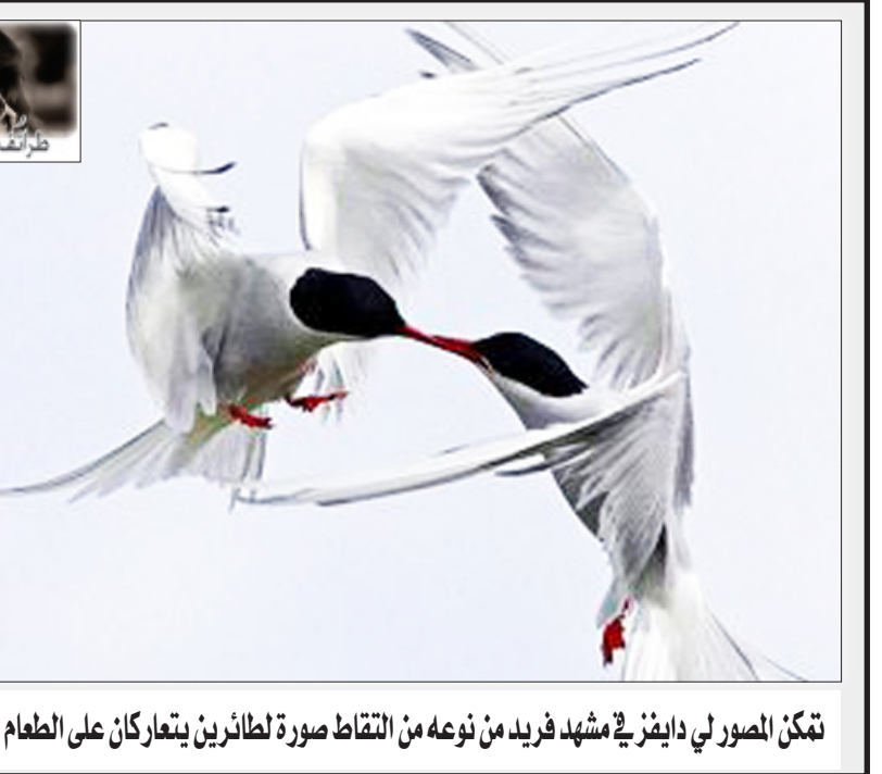
تمكن المصور لي دايفز في مشهد فريد من نوعه من التقاط صورة لطائرتين يتعاركان على الطعام في الجو

فوجئ زبائن مطعم في ألمانيا بشخص ينتزع قطع اللحم من أطباقهم ويضعها في صندوق، ثم ينصرف بها دون أن يقدم سبباً لتصرفه الغريب. وفسرت الشرطة التي تبحث عن تصنيف للموقف بأن الرجل الذي أخذ الطعام من أمام الزبائن هو مورد اللحم للمطعم الذي يقع بمدينة آخن الألمانية.