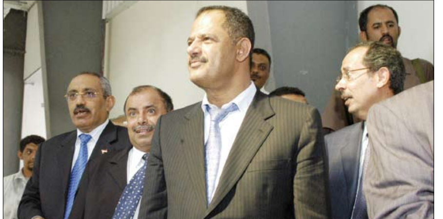
د. مجبور يطلع على أعمال الترميم في مدينة تريم أمس

اطلع رئيس مجلس الوزراء الدكتور علي محمد مجبور خلال زيارته يوم أمس الثلاثاء لمدينة تريم على ما شهدته هذه المدينة التاريخية من أعمال ترميم وتطوير للبنى التحتية باعتبارها عاصمة للثقافة الإسلامية للعام 1431 هـ الموافق 2010م. كما اطلع رئيس مجلس الوزراء على التجهيزات والترميمات التي جرت لعدد من القصور التاريخية في المدينة والتي تعتبر من روائع العمارة الطينية. واستمع الدكتور مجبور من وزير الثقافة ومحافظ حضرموت إلى ما يتضمنه برنامج فعاليات تريم عاصمة للثقافة الإسلامية للعام الجاري، من برامج ثقافية وندوات ومحاضرات عما تتميز به مدينة تريم وما تكتنزه من مآثر إسلامية والجهود المبذولة لحمايتها والحفاظ عليها. وأشار رئيس الوزراء إلى أهمية أن تكون الفعاليات عند مستوى اختيار مدينة تريم الغناء عاصمة للثقافة الإسلامية، والتعريف بدور أبنائها في نشر الثقافة الإسلامية في مختلف أصقاع المعمورة. متمنياً لفعاليات تريم عاصمة الثقافة الإسلامية النجاح في تحقيق الأهداف المنشودة منها في التعريف بما تزرخ به هذه المدينة من معالم عمرانية نادرة ورموز وتراث ثقافي وحضاري.