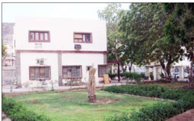
أعمال تشجير وتحسين حديقة نقابة الصحفيين

وتناقش اليوم الأربعاء بقاعة نادي الميناء الرياضي في التواهي أعمال المؤتمر الفرعي الرابع لنقابة الصحافيين اليمنيين في عدن بمشاركة مائتين وواحد وخمسين عضواً يمثلون قوام الجمعية العمومية لمحافظة عدن.