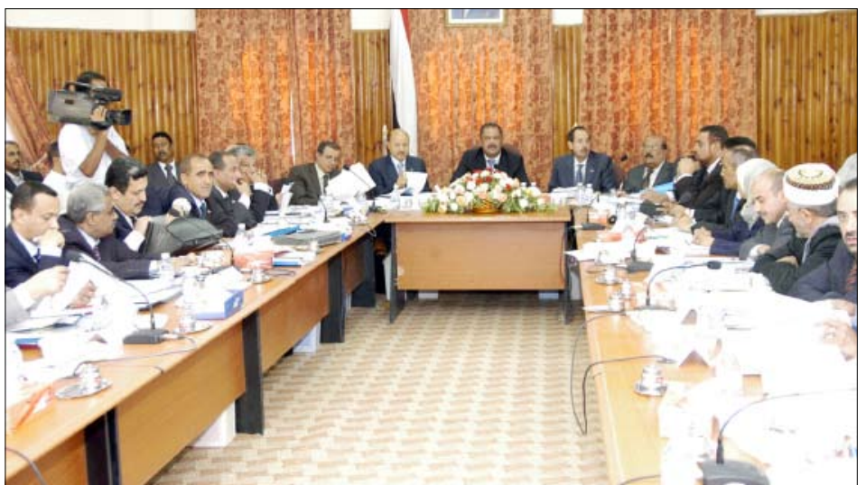
اجتماع مجلس الوزراء برئاسة د. مجور في سيئون أمس

المماثلة. ووجه المجلس أثناء الاجتماع الذي شاركت فيه قيادات السلطة المحلية بمحافظة حضرموت والمهرة وأعضاء مجلس النواب والشورى والشخصيات الاجتماعية، وجه الإدارة التنفيذية للصدوق بالقيام خلال فترة أقصاها شهر من تاريخه باستكمال دفع بقية أقساط التعويضات للمتضررين جزئياً دفعة واحدة، وتعويض المتضررين كلياً على قسطين على أن يتم الانتهاء من دفع القسطين خلال ثمانية أشهر من تاريخه. وأقر المجلس إشراك الصدوق الاجتماعي للتنمية ومشروع الأشغال العامة في عملية إعادة بناء وتأهيل المدارس والوحدات الصحية المتضررة بما يكفل التسريع بإعادة بنائها. وكان الاجتماع قد ناقش تقرير الإنجاز لصدوق إعادة إعمار محافظتي حضرموت والمهرة من الإدارة التنفيذية وذلك للفترة من مارس 2009م، وحتى نهاية مارس 2010م، في مختلف المجالات التي تدرج في إطار إختصاصات الصدوق.