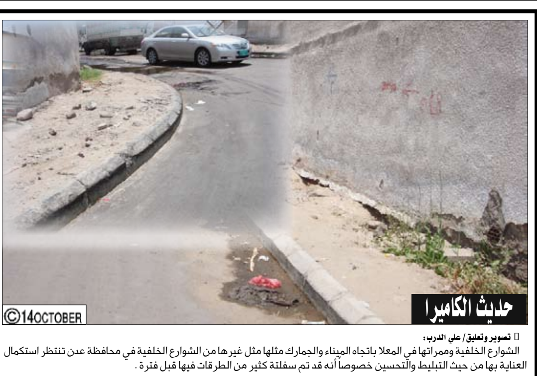
حديث الكاميرا تصوير وتعليق / علي الدرب: الشوارع الخلفية وممراتها في المعبأ بانجاه الميناء والجمارك مثلها مثل غيرها من الشوارع الخلفية في محافظة عدن تنتظر استكمال العناية بها من حيث التجميل والتحسين خصوصا أنه قد تم سفلتها كثير من الطرقات فيها قبل فترة .