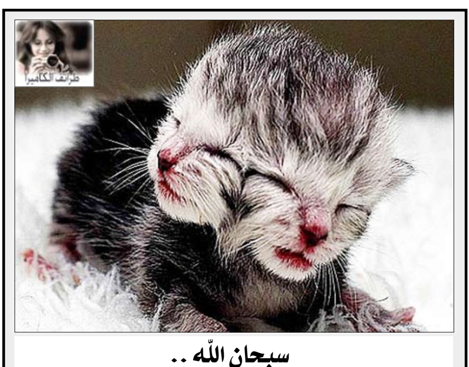
سبحان الله ..

في هنغاريا تم افتتاح المطعم «المعلق» وهو يقدم لزواره فرصة لتناول العشاء بين السماء والأرض ، على ارتفاع 50 مترا فوق بودابست .. والصعود إلى المقعد الخاص بالزائر يتم بطريقة خاصة وحيث يرفع الزائر عبر رافعة إلى مكانه ويجلس بمقعده المخصص المثبت بالطاولة بواسطة أربعة أحزمة أمان وفي خدمة كل طاولة 6 نوابل .