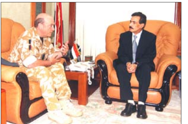
وزير الداخلية يلتقي قائد العمليات المشتركة في القوات البريطانية

♣ صنعاء / سبأ ، التقى وزير الداخلية اللواء الركن مطهر رشاد المصري يوم أمس الاثنين بصنعاء قائد العمليات المشتركة في القوات البريطانية المشير ستوربات بنش والوفد المرافق له والذي يزور اليمن حاليا. وناقش اللقاء مجالات التعاون الأمني بين اليمن والمملكة المتحدة. وفي اللقاء أنشأ معالي وزير الداخلية بالعلاقات المتينة التي تربط البلدين الصديقين وبالذم على تقدمه بريطانيا لليمن في مجال تطوير خفر السواحل وتقديم الخبرات التدريبية. وأشار إلي أن اليمن تطمح إلي تحقيق المزيد من التعاون مع بريطانيا بما يخدم مصالح البلدين المشتركة. كما تناول اللقاء موضوع الإرهاب كمشكلة عالمية تعاني منها جميع الدول.. مؤكدا ضرورة تعاون المجتمع الدولي في مواجهة هذه المشكلة.