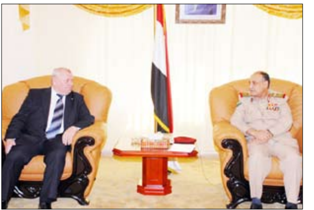
وزير الدفاع يلتقي الوفد العسكري الروسي

♣ صنعاء / سبأ ، التقى وزير الدفاع اللواء الركن محمد ناصر أحمد يوم أمس الاثنين بالوفد العسكري الروسي الذي يزور اليمن حاليا برئاسة الأدميرال مشرتكا نائب رئيس مؤسسة روس أيرون . وجرى خلال اللقاء بحث علاقات ومجالات التعاون المشترك بين البلدين والشعبين الصديقين وسبل تعزيزها وتطويرها خاصة في مجال مكافحة الإرهاب.