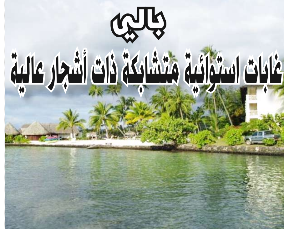
بيساجية وهي عاصمة جزيرة «بالي» القديمة، وهناك أيضا آثار ستقاراجا والقصر العائم الواقع بمنطقة الأجل «كاندي داسا».