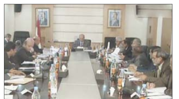
وزير الخارجية يلتقي ممثلي جهات إنفاذ القانون والجهات الأمنية

كرس اللقاء الذي عقد أمس في صنعاء برئاسة وزير الخارجية الدكتور أبو بكر الغربي وضم ممثلين عن جهات إنفاذ القانون، والجهات الأمنية، والبنك المركزي اليمني، ولجنة مكافحة غسيل الأموال، ووزارة حقوق الإنسان والأوقاف والإرشاد، كرس لمراسة وتقييم مستوى تنفيذ اليمن للاتفاقيات والبروتوكولات المتعلقة بمكافحة الإرهاب ومصادر تمويله. وناقش المشاركون في اللقاء الجهود التي تبذلها الحكومة في سبيل مكافحة الإرهاب ومصادر تمويله في إطار ترجمتها للالتزامات الدولية في هذا الشأن.