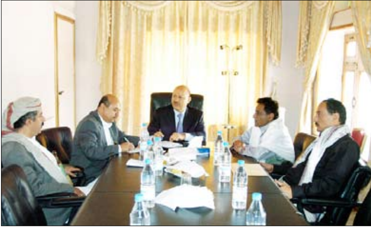
العلمي يلتقي رئيس وأعضاء اللجنة الوطنية لتنفيذ الشروط الستة في محور حرف سفيان