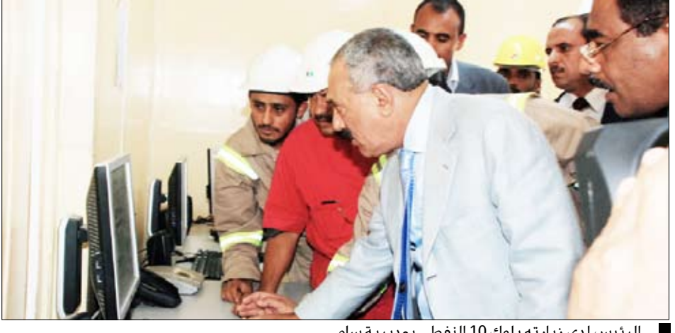
الرئيس لدى زيارته بلوك 10 النفطي بمديرية ساه

.. ويوجه بسرعة الاستفادة القصوى من الغاز الطبيعي المصاحب لإنتاج النفط وكان فخامة الأخ الرئيس قد قام صباح أمس بزيارة (البلوك 10) في منطقة خريز مديرية ساه حيث افتتح مشروع المرحلة الأولى من المحطة الكهربائية الغازية بقدرته 30 ميجاوات والتي تم إنشائها في البلوك النفطي 10 الذي تعمل فيه شركة توتال الفرنسية للاستفادة من الغاز الطبيعي المصاحب، فيما قامت الدولة بتمويل تنفيذ شبكة الكهرباء في منطقة المشروع وحتى مدينة سيئون. وقد وجه فخامة الأخ رئيس الجمهورية المعنية بسرعة الاستفادة القصوى من الغاز الطبيعي المصاحب لإنتاج النفط، وإنشاء محطة بقدرته 50 ميجاوات