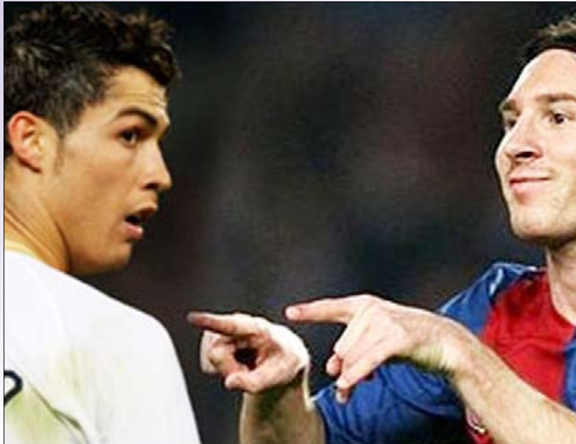
مباراة جانبية بين رونالدو وميسي