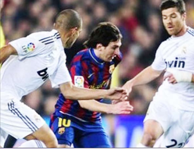
لقطة للريال وبرشلونة من الارشيف