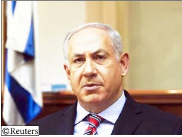
رئيس الوزراء الإسرائيلي بنيامين نتنياهو

سيكون في مؤتمر مراجعة الاتفاقية الذي تعقده الأمم المتحدة الشهر القادم.