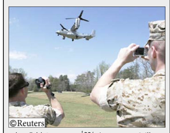
طائرة هجين من نوع في 22 أوسبري وهي تحاول الهبوط