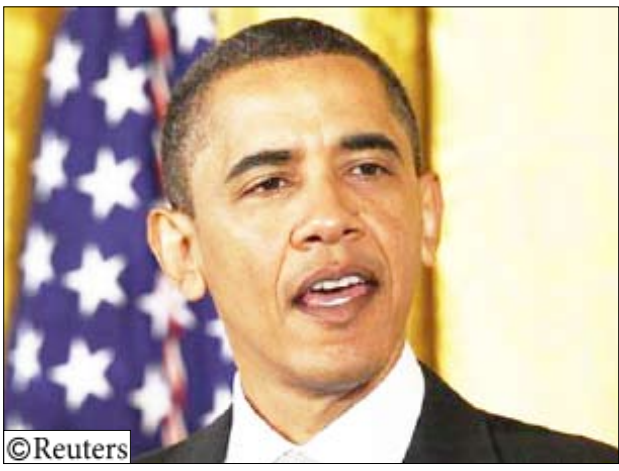
الرئيس الأمريكي باراك أوباما في واشنطن