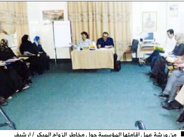
من ورشة عمل اقامتها المؤسسة حول مخاطر الزواج المبكر