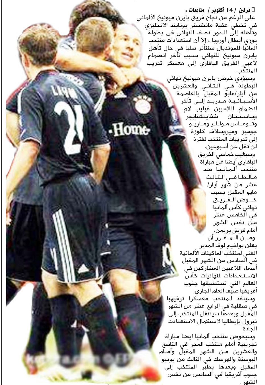
14 أبريل / متابعة: على الرغم من نجاح فريق بايرن ميونخ الألماني في تحطيم عقبة مانشستر يونايتد الإنكليزي وتأهله إلى الدور نصف النهائي في بطولة دوري أبطال أوروبا، إلا أن استعدادات منتخب ألمانيا للمونديال ستتأثر سلباً في حال تأهل بايرن ميونخ للنهائي بسبب تأخر انضمام لاعبي الفريق البافاري إلى معسكر تدريب المنتخب.

وسيفدى خوض بايرن ميونخ نهائي البطولة في الثاني والعشرين من أيار/مايو المقبل بالعاصمة الأسبانية مدريد إلى تأخر انضمام اللاعبين فيليب لام وباستيان شفابينشتايجر وتوماس مولر وهارويو جوميز وميروسلاف كلوزه إلى تدريبات المنتخب لفترة لن تقل عن أسبوعين.