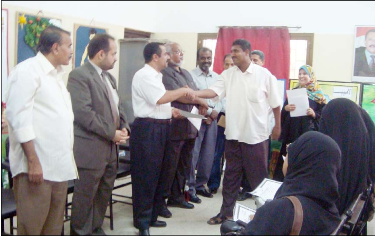
خلال تكريم المشاركين في الورشة

المفلس : على الجميع استيعاب أهمية الوسيلة التعليمية ومحو أمية الحاسوب