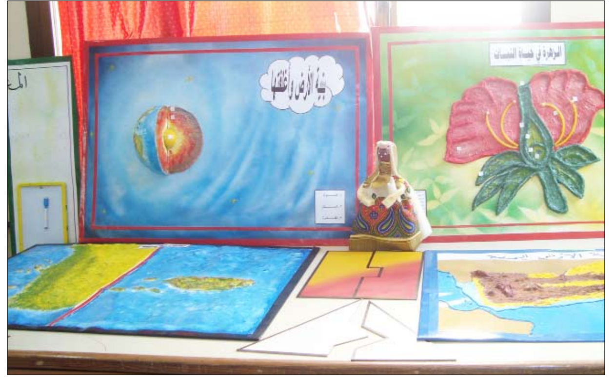
بعض الوسائل التعليمية