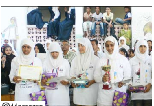
من فعاليات التكريم