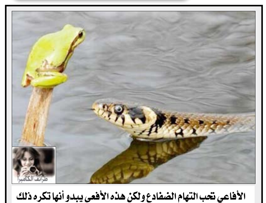
الأفاعي تحب التهام الضفادع ولكن هذه الأفعى يبدو أنها تكره ذلك

بشكل طريف .. عبر الشعب الإنجليزي عن غضبه إزاء أزمة الصرف الصحي التي تعاني منها البلاد عن طريق الاصطفاك حول مرحاض عملاق انتظارا لقضاء الحاجة مرتدين قناعاً لرئيس وزراء بريطانيا جوردون براون مطالبين بضرورة اتخاذ موقف بمناسبة يوم الماء العالمي.