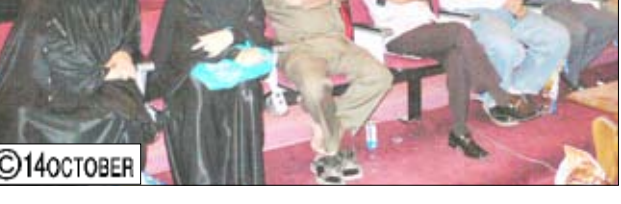
من احتفال مدرسة الطويلة باليوم المدرسي وتكريم المعلمين