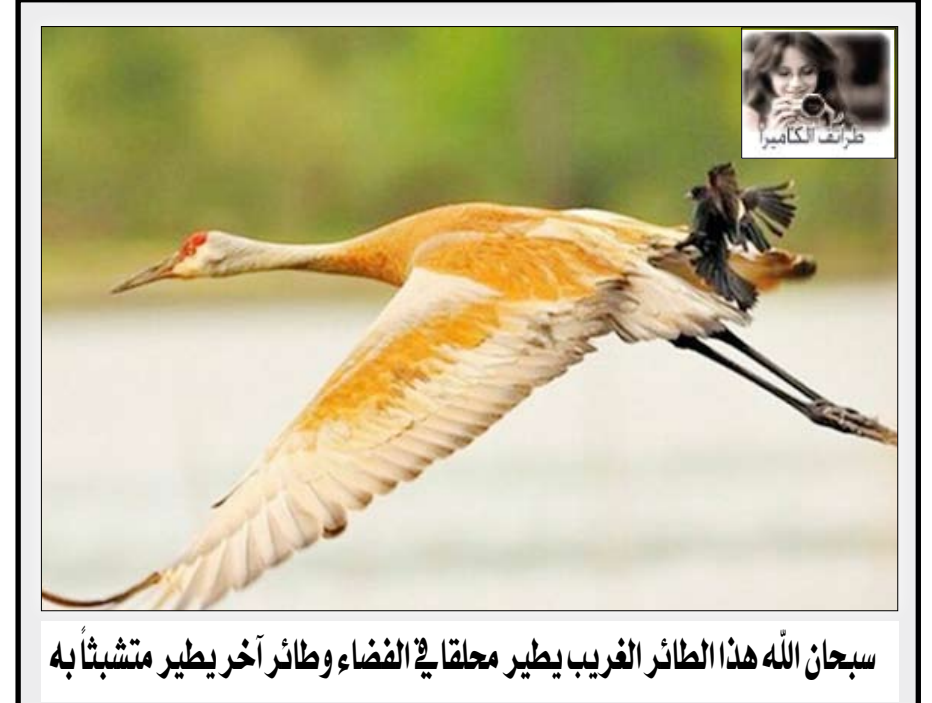
سبحان الله هذا الطائر الغريب يطير محلقاً في الفضاء وطائر آخر يطير متشبهاً به