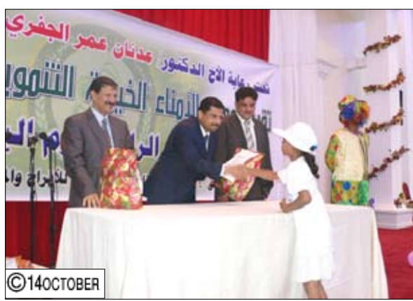
من فعاليات تكريم عدد من الأيتام