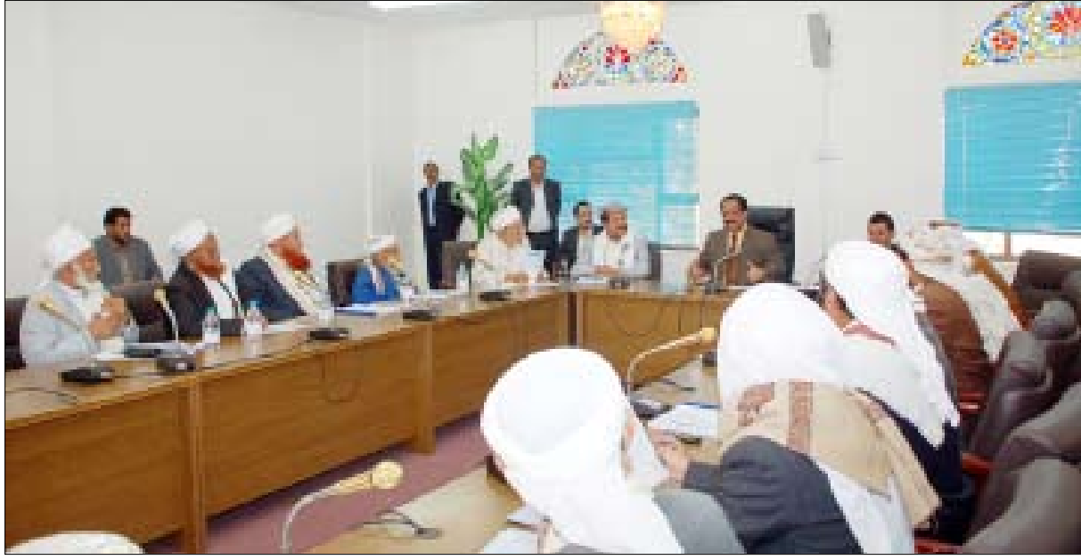
الراعي لدى لقائه فضيلة العلماء

رأيهم في هذا الخصوص. من جانبه عبر رئيس مجلس النواب عن ترحيبه بالعلماء الأفاضل مقدرًا تقديرًا عاليًا جهودهم المبذولة في تقديم النصح والإرشاد بما يحقق مصلحة الأمة. وأوضح أن مجلس النواب يسن ويشعر بالقوانين بالاستناد إلى نصوص وأحكام دستور الجمهورية اليمنية... مبيّنًا أن التعديلات المقترحة على المادة الخامسة عشرة من قانون الأحوال الشخصية معروضة على المجلس للنقاش وقال فيها رأيها ووفقًا للعرف البرلماني والإجراءات المنصوص عليها في اللائحة المنظمة لعمل المجلس ولجانته، تم طلب إعادة المداولة فيها فقبل الطلب وأحيل إلى لجنة تقنين أحكام الشريعة الإسلامية التي تعكف حاليًا على دراسته بعناية وإمعان وتحديد المخارج اللازمة لهذه المادة بما لا يخالف إجماع الأمة. ودعا رئيس مجلس النواب بعض العلماء وخطباء المساجد والعاملين في حقل الإرشاد والتوجيه والوعظ والتوعية إلى ترشيح الخطاب الديني والنأي به عن التحريض السياسي والإعلامي والابتعاد عن التعصب والتطرف والإثارة والتأجيج وتشويش وعي الناس، والحرص دومًا على جعله خطابًا موضوعيًا ومتوازنًا يخدم المقاصد النبيلة للشريعة الإسلامية السمحاء ويزرع الطمأنينة بين الناس ويقرب بينهم ويشجعهم أكثر على التراحم والتكافل، ويرسخ السكينة العامة في المجتمع. حضر اللقاء رئيس لجنة تقنين أحكام الشريعة الإسلامية العلامة عبد الملك أحمد الوزير وعدد من أعضاء مجلس النواب.