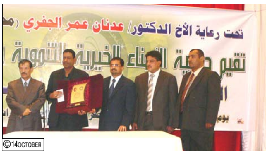
لدى تكريم أسرة الفنان الكبير فيصل علوي