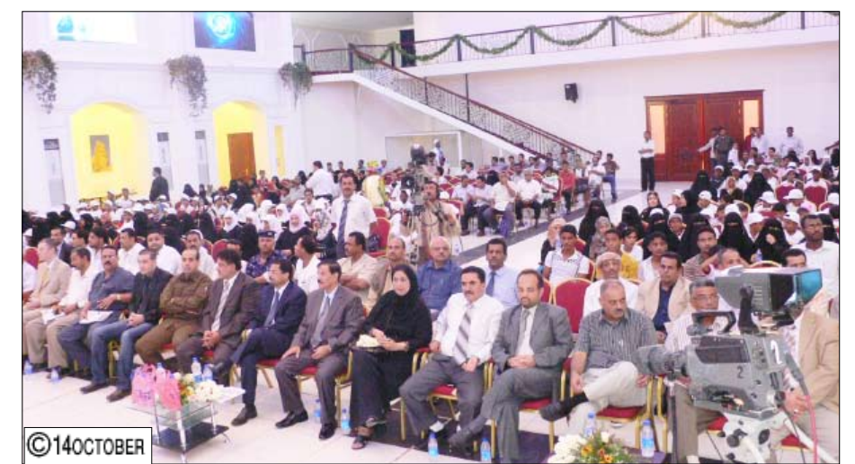
جانب من حضور الفعالية