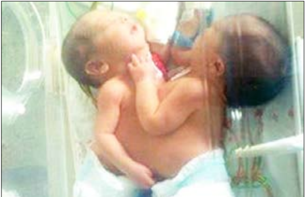
التوأم اللذان سيخضعان لعملية الفصل في السعودية

وكالات الأنباء السعودية أن «هذه الفتنة الإنسانية والبادرة الكريمة تجسد الدور الفاعل والرائد لمملكة الإنسانية في خدمة أبناء الوطن والشعوب العربية والإسلامية والصديقة». وأضاف أن التوأمن ستخضعان للفحوصات الطبية المعتادة في مثل هذه الحالات وسيتم اتخاذ كافة الإجراءات الطبية قبل القيام بعملية فصلهما. وصرح وزير الصحة السعودي الدكتور عبد الله بن عبدالعزيز الربيعة