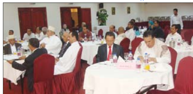
الضلاعي في اللقاء الترويجي الإندونيسي بعدن أمس

من تجار وعلماء في نشر الإسلام في إندونيسيا نتيجة لما تميزوا به من أخلاق حسنة أثارت إعجاب من ألقوا بهم في إندونيسيا. ولفت إلى الروابط الأخوية والتواصل الدائم بين أبناء اليمن وإندونيسيا مع أشقائهم في إندونيسيا. داعياً المستثمرين الإندونيسيين ومن خلال سعادة سفير إندونيسيا في صنعاء إلى الاستثمار في عدن وفي المنطقة الحرة فيها وبما من شأنه تعزيز العلاقات المتميزة والتبادل التجاري بين البلدين الشقيقين، مؤكداً أن زيارة فخامة رئيس الجمهورية إلى إندونيسيا عام 2009م كان لها دلالات على عمق العلاقات التي تربط الشعبين الشقيقين. وكان سعادة سفير إندونيسيا في صنعاء السيد / نور الأولياء قد قدم صورة عن العلاقات الثنائية التي تربط اليمن وإندونيسيا ومنها العلاقات التجارية بينهما وخاصة مع وكالات السفر في البلدين وبالذات في مجال السياحة، لافتاً