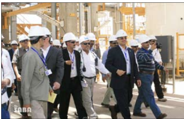
وزير النفط لدى تدشينه الخط الثاني لمشروع الغاز الطبيعي

دشن وزير النفط والمعادن أمير العيروس أمس الإنتاج التجريبي في خط الإنتاج الثاني لمشروع الغاز الطبيعي المسال في لحاف بمحافظة شبوة أكبر مشروع اقتصادي في تاريخ اليمن المعاصر البالغ كلفته الإجمالية 4.5 مليار دولار. وبدخول خط الإنتاج الثاني تصل كمية الإنتاج الكلية للمشروع إلى 6.7 مليون طن متري سنوياً. ولمف وزير النفط والمعادن بمكونات المشروع الذي يعمل على ضخ الغاز الطبيعي المسال من منشآت المنبع في القطاع 18 في مارب عبر أنبوب يصل طوله إلى 320 كيلو متراً وصولاً إلى محطة التسييل في لحاف. واستمع من المسؤولين إلى شرح حول سير العمل بمنشآت المشروع منها محطة التحكم ووحدات التسييل وخط الإنتاج الثاني الذي بدأ عملية الضخ إلى الخزانات والتي وصلت اليوم إلى حوالي سبعة آلاف متر مكعب، وسير العمل في ميناء التصدير.