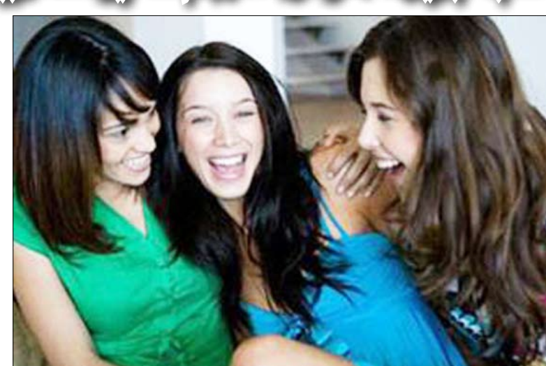
الكذبة تعود إلى قرون مضت لكن أصلها لا يزال غير واضح

وقد عاصم 14 أكتوبر / رويترز: طرح حق تسمية "سنترال بارك" في نيويورك للبيع وجوجل تغير اسمها وسلسلة ستاركس تطرح أقفاص قهوة عملاقة، كلها تنويحات لكذبة نيسان (أبريل) التي صادفت أمس الأول الخميس. وكما جرت العادة مع أول من شهر نيسان (أبريل) ابتدعت الصحف ومواقع الانترنت في شتى أنحاء العالم كذبات مختلفة لهذا العام تراوحت بين الكذب الصريح والإغراق في الغرابة. وانضمت جوجل صاحبة محرك البحث العملاق إلى المزاح بالقول أنها ستطلق خدمة جديدة تتمثل في "الترجمة للحيوانات" وستغير اسمها إلى "تويبيكا" وهو اسم مدينة في "كانسو" غيرت اسمها مؤقثاً إلى جوجل حيث أنها تهدف إلى تعميم استخدام الألفاظ الصوتية بها كمجتمع تكنولوجي تجريبي. وفي محاولة لسد العجز في موازنة مدينة نيويورك أعلن مكتب رئيس بلدية المدينة في موقع تويتر أن رئيس البلدية مايكل بلومبرج قرر حق تسمية سنترال بارك وأبست ريفر وحتى رئيس البلدية السابق أيد كوتش. وقال كوتش عبر الهاتف مازحاً "أقدر لرئيس البلدية هذا الشرف الذي أولاني إياه بوضع اسمي مع اثنين من الأصول الرئيسية للمدينة أدعو إلى بدء