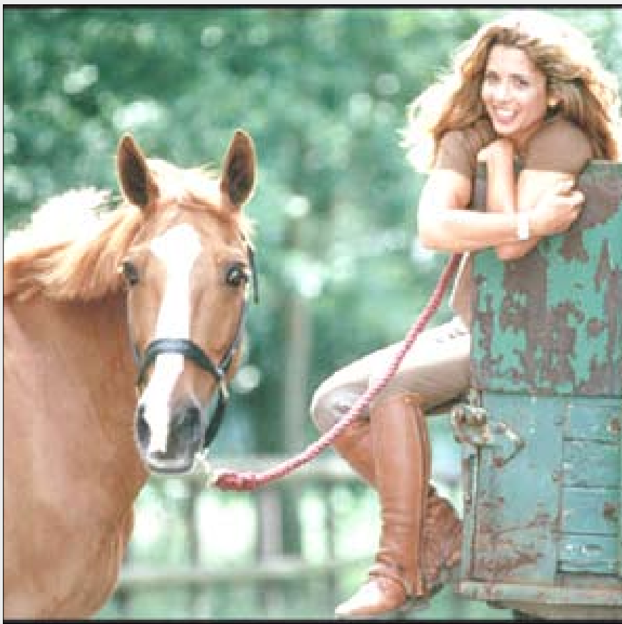
الاميرة هيا بنت الحسين