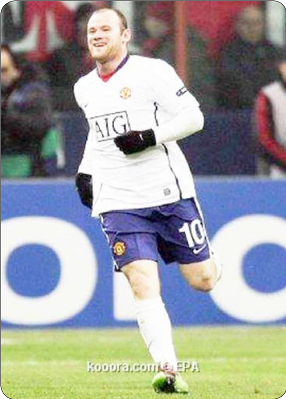
المهاجم واين روني