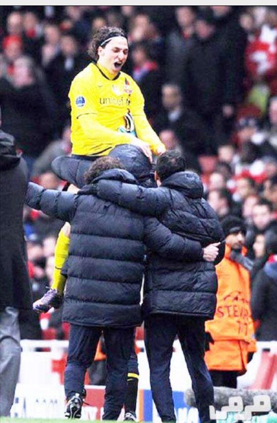
إبراهيموفيتش محمول على الاعناق

على الكرة، صنع الحالات الخطيرة أمام مرمرى الخصم، فمن لا يخاطر بالتقدم للأمام لا يملك حظوظاً كبيراً».