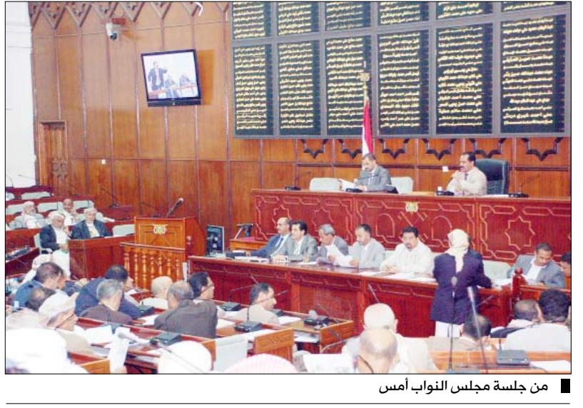
من جلسة مجلس النواب أمس

صنعاء / سبأ : أقر مجلس النواب في جلسته المنعقدة أمس برئاسة رئيس المجلس يحيى علي الراعي محضر الاجتماع المشترك لهيئة رئاسة المجلس مع رؤساء ومقرري اللجان. وأشار التقرير إلى ضرورة التزام اللجان بانجاز المواضيع المتأخرة لديها خلال فترة الانعقاد الحالية وخاصة اتفاقية الفروض ومشروع القوانين المدرجة في جدول أعمال المجلس التي طلبت الحكومة الاستعجال في إقرارها، منبها أي لجنة ترى أنها غير قادرة على سرعة إنجاز أي مواضيع متأخرة لديها إلى ضرورة إبلاغ هيئة رئاسة المجلس ليتم إحالته إلى لجنة أخرى لانجازها وفقا للائحة.