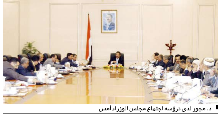
د. مجور لدى ترؤسه اجتماع مجلس الوزراء أمس

صنعاء / سبأ : ثمن مجلس الوزراء في اجتماعه الأسبوعي أمس برئاسة رئيس المجلس الدكتور علي محمد مجور النتائج الإيجابية التي أثمرتها القمة العربية الـ 22 التي عقدت في مدينة سرت بالجمهورية العربية الليبية الشعبية الاشتراكية العظمى . وأشاد المجلس بالدور القيادي الحكيم والمسؤول والمخلص الذي قام به فخامة رئيس الجمهورية ورئيس القمة العربية الـ 22، وإخواتهما من القادة العرب ورؤساء الوفود العربية من أجل الوصول إلى هذه النتيجة المباركة. وناقش المجلس مذكرة وزير الخيمة المدنية والتأمينات رئيس اللجنة الرئاسية لاستكمال المعالجات الخاصة بقضايا الأراضي والمسكن في محافظات عدن، لحج، وأبين وأقر إحالة المقترحات والمعالجات الواردة في تقرير اللجنة للدراسة المتكاملة والرفع إلى المجلس بالنتائج للمناقشة النهائية وإقرار مايلزم.