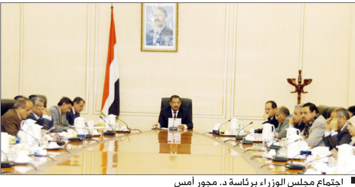
اجتماع مجلس الوزراء برئاسة د. مجور أمس

أخذ مجلس الوزراء في اجتماعه الاستثنائي يوم أمس الأحد برئاسة رئيس المجلس الدكتور علي محمد مجور مجموعة من الإجراءات للتخفيف من الأضرار التي يتعرض لها الاقتصاد الوطني من خلال ميزان المدفوعات والميزان التجاري. وأقر المجلس منع استيراد أية سلعة من غير بلد المنشأ وشهد على الجهات المعنية وفي المقدمة وزارة المالية التطبيق الصارم للقرار ومنع دخول أي سلعة من غير بلد المنشأ والعمل على إعادتها أو إتلافها في حال دخولها البلاد وفرض رسوم إضافية على 71 سلعة غير أساسية من بينها السلع ذات الطابع الترفيهي، بنسب تتراوح ما بين 5 - 15 بالمائة.