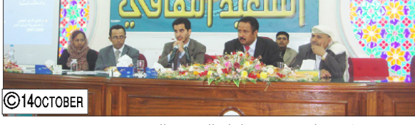
من ورشة برنامج دعم منظمات المجتمع المدني في تعز

على الكثير من الأولويات والمقترحات للسير في عملية التنمية. من جانبه أشار وكيل وزارة الإدارة المحلية أكرم الشيخ إلى أن الوزارة شكلت فرق عمل من موظفيها لمساعدة المجالس المحلية في إعداد مشاريعها التي ستقدم للاتحاد الأوروبي، مؤكداً ضرورة تقديم برامج ومشاريع تلبي احتياجات الفئات المستهدفة في المناطق والمديرية. فيما استعرض مسؤولون برنامج تعزيزيز الحكم الديمقراطي والأمن بالسفارة الفرنسية بصنعاء حسين دهمان أهداف برنامج دعم منظمات المجتمع المدني والسلطة المحلية واليات تقديم المشاريع، لافتاً إلى ضرورة التعاون من قبل الجميع لإنجاح البرنامج وتعزيز قدرات السلطة المحلية ومنظمات المجتمع المدني، مؤكداً أن الدعم الأوربي يعتمد على عدة مشاريع ومعرفة السلطة المحلية والمنظمات