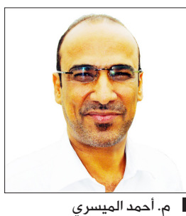
م. أحمد الميسري

زنجبار/ عبد الله بن كذا: أكد محافظ أبين المهندس/ أحمد بن أحمد الميسري ضرورة رفع وتيرة العمل وتسخير كل الإمكانيات المتاحة للتسريع بانجاز المشاريع والأعمال التي تدخل في إطار الاستعدادات لخليجي "20" في المحافظة. جاء ذلك في الاجتماع الموسع الذي ترأسه الميسري يوم أمس بحضور الوكيلين المساعدين المهندس/ ناصر أحمد الياغعي وعلي صالح جبران وأعضاء الهيئتين الإداريتين للمجلس المحلي بالمحافظة ومديرية زنجبار وعموم الأشغال والطرق والكهرباء وصندوق التحسين والنظافة، والذي كرس لمناقشة وتقييم مستوى تنفيذ المشاريع