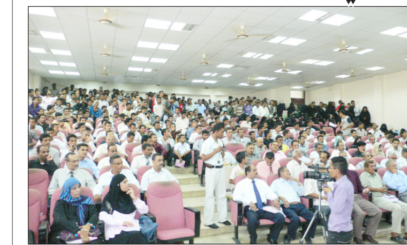
جانب من الحضور في الحفل التكريمي