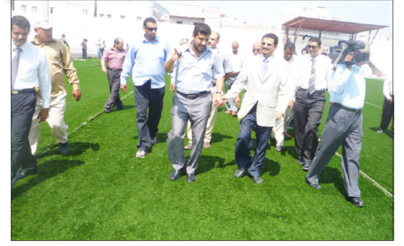
■ شائف ومرافقوه لدى تفقدهم ملعب شمسان