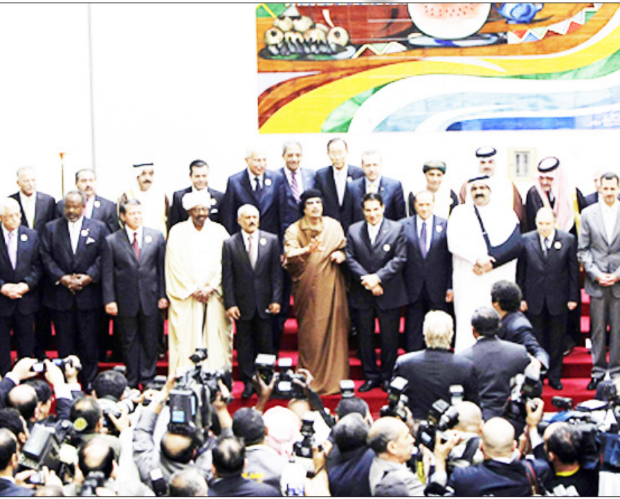
القادة العرب ناقشوا خطر تهويد القدس والعملية السلمية بالمنطقة

كما اتفق القادة على إنشاء مفوضية عامة تعنى بشؤون القدس وتدعم صمود أهلها بالأمانة العامة للجامعة، وطلبوا من الأمانة دراسة إمكانية عقد مؤتمر دولي بمشاركة جميع الدول العربية والمؤسسات والهيئات ومنظمات المجتمع المدني المعنية خلال الشهر