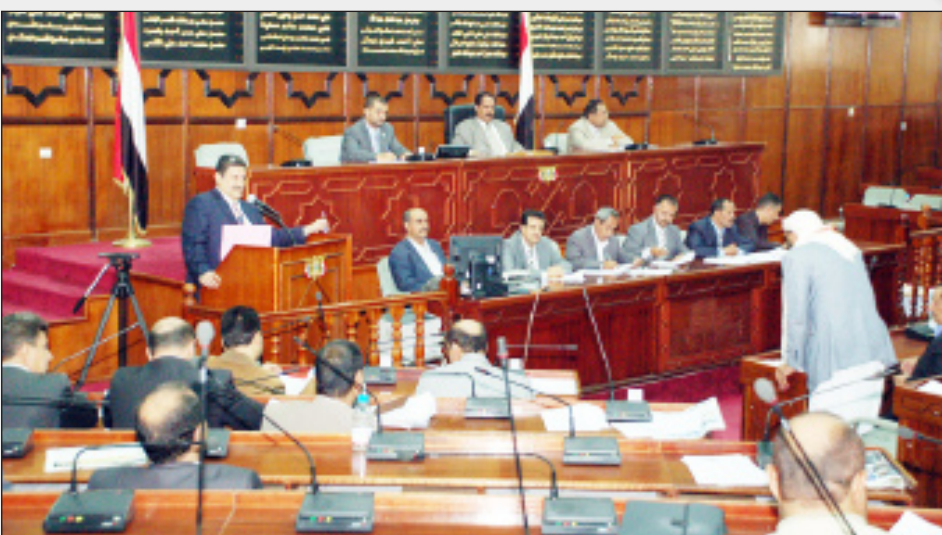
من جلسة البرلمان (أمس)

المصلحة العامة ومصحة المواطنين، وأن يكون تقييم المركز بشكل علمي وسليم. وعن توقف بنك الدم بمحافظة عدن بسبب عدم وجود المحاليل الطبية اللازمة والموازنة المخصصة لذلك ما حرم المرضى في هذه المحافظة من الحصول على الدم الذي يحتاجونه.. أجاب الوزير أنه بالفعل كان هناك خلل في إدارة المركز الوطني لنقل الدم وأبحاثه نتيجة فشل مديره العام ولذلك فقد تم تغييره. وكان الجلسة وزير شئون مجلسي النواب والشورى احمد محمد الكلثاني ووزير العدل الدكتور غازي شائف الاغبري. وكان المجلس قد استهل جلسته باستعراض محضره السابق ووافق عليه وسبواصل أعماله صباح اليوم الاثنين بمشيئة الله تعالى.