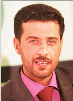
للشاعر العراقي ميثم العنابي

وحدي هناك يطفاني الضياء وحدي فانكبت كما رصاصه اقتحمت عين الماء أنا انكسار الضراع في الأزقة والزوايا أنا الضراع أنا الشعر المريض بالقوايل أنا اليكأنا أنا الحرب الوشبكة على اليكأنا اقتات التورد والنجوم وانساء اتفهم من لضى الشمس لاختصار نفسي نحو مسافة لهذي الحرب (سأبث يوما) أو بعضه، في فلك العتمة من يغربني باقدا الميخطة صوب الرحلة؟ وفقا مسرات الحزن مشغول كنت برسم الطين على كتف الحلم