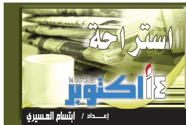
إعداد / إنسام العسيري

واشطن / متابعة: من أفضل السبل التي يمكن إتباعها لحماية البيانات والوثائق المهمة على ذاكرة الكمبيوتر هي تقسيم القرص الصلب إلى أكثر من قطاع. ويتعين تخصيص قطاع من القرص الصلب لتنزيل نظام تشغيل الكمبيوتر والتطبيقات الموجودة على الجهاز. أما باقي القطاعات على القرص الصلب، فيمكن الاستفادة منها في تخزين البيانات والوثائق على