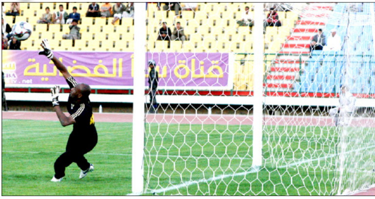
■ هدف اليمن في توجو

ثابت في ضربة جزاء لمنتخب توجو أحرز منها هدف التعادل الذي ساهم في تحسين أداء لاعبيه، فيما أعتمد لاعبونا على المرتدات السريعة دون فائدة. وسيلعب المنتخب الوطني مباراة ودية ثانية أمام منتخب توجو الأربعاء القادم على ملعب المريسي بصنعا.