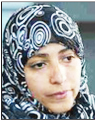
توكل عبد السلام كرمان

سيجري توظيف العلم لخدمة الامعقول وستسمعون من يسرد اكتشافاته في علم وظائف الأعضاء للقول إن المرأة القاصرة جاهزة للحياة الاسرية المتكافئة مع الزوج الراشد، إن الاستجابة العمياء لهذا الهوس غير المعقول سيجعل حياتنا كلها تدور في حلقة مفرغة لاتغادرها ابداً. العفاف لا يكفله مجرد الزواج هكذا كيفما اتفق ، ازعم ان العلاقة الزوجية إن لم تكن قائمة على أساس راسخ من المعرفة والالتزام بحقوق الآخر ، وبحيث تتسع لتسبيح كل ماله علاقة بالاستقرار والتفاهم الأسري وفي جو من التشارك والود والرحمة المتبادلة ، إن لم تكن كذلك فإن الحياة الزوجية ستتقلب الي جحيم تكون العفة اول ضحاياها. ازعم ثانياً ان الراغبين في الزواج المبكر والمدافعين عن زواج القاصرات محرومون معرفياً على الاقل من كل تلك المعاني ولا سبيل لان تعد إحدى مكونات ادعتهم الجامدة !!