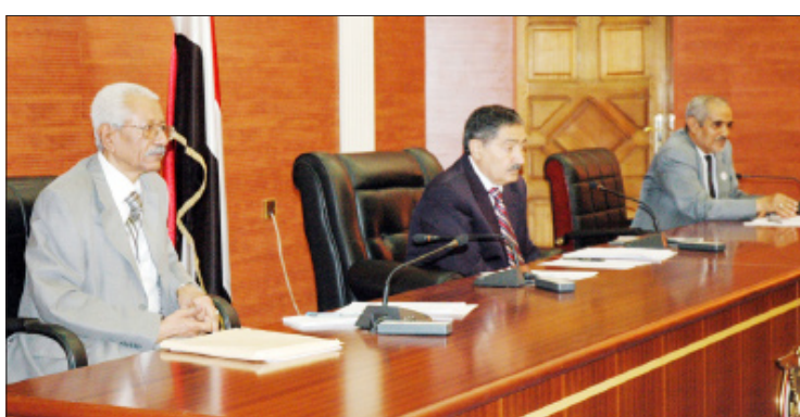
هيئة رئاسة مجلس الشورى

عبرت هيئة رئاسة مجلس الشورى، عن أحر تهانيتها لفخامة الأخ الرئيس علي عبدالله صالح رئيس الجمهورية، بنجاح مساعيه لتطوير العمل العربي المشترك، من خلال المبادرة التي تقدم بها فخامته باسم الجمهورية اليمنية، إلى مؤتمر القمة العربية الثانية والعشرين التي اختتمت أعمالها أمس في مدينة سرت الليبية. جاء ذلك في بيان أصدرته هيئة رئاسة مجلس الشورى عقب اجتماعها الدوري أمس برئاسة رئيس مجلس الشورى عبد العزيز عبد الغني. وحيث الهيئة، باسم مجلس الشورى، الموقف القوي الذي عبر عنه فخامة الأخ الرئيس، في كلمته التاريخية أمام إخوانه