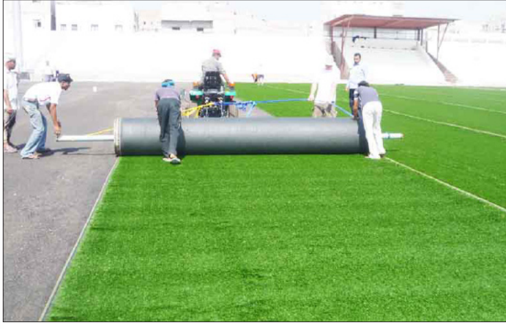
■ أثناء تركيب العشب الصناعي في ملعب شمسان