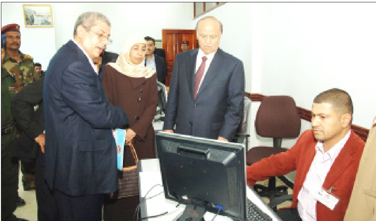
نائب رئيس الجمهورية لدى تفقده ادارة المعلومات

التي يقوم بها الصندوق من خلال خرائط المسح وتقديم القروض للتخفيف من الفقر في مجالات تربية النحل والمواشي وصناعات سعف النخيل بمختلف الأشكال وبصورة ميسرة ومدروسة بدقة. وفي صالة الاجتماعات أيضا تم استعراض نماذج مصورة للتقنية التي يتم بها المسح الميداني وتقديم تلك المشاريع على مستوى كل المحافظات والمناطق. وقد أكد الأخ نائب رئيس الجمهورية أن صندوق الرعاية الاجتماعية يمثل أهمية استثنائية في تقديم المساعدات وشبكات الضمان الاجتماعي من أجل التخفيف من الفقر وخلق المزيد من فرص العمل من خلال النوافذ التي يفتتحها الصندوق أمام المحتاجين. وأشار إلى الدور الحيوي والبناء الذي قام ويقوم به الصندوق مؤكداً أن القيادة السياسية ممثلة بفضامة الرئيس علي عبدالله صالح رئيس الجمهورية تؤكد باستمرار ضرورة تطوير أداء الصندوق الذي تبلغ موازنته السنوية أكثر من أربعين مليار ريال.. متمنياً للكوادر العاملة في الصندوق المزيد من التوفيق والنجاح.