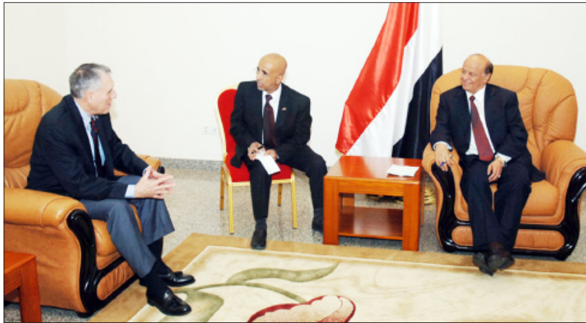
نائب الرئيس لدى استقباله وفد مجلسي الكونغرس والنواب الأمريكي أمس

استقبل الأخ عبدربه منصور هادي نائب رئيس الجمهورية يوم أمس الأحد وفد مجلسي الكونغرس والنواب الأمريكي برئاسة السناتور جون كابل. وبعد أن رحب نائب رئيس الجمهورية بالوفد الأمريكي أشاد بالعلاقات الودية الأمريكية وصفها بالعلاقات الممتازة وتناول الكثير من القضايا المتصلة بالوضع على الساحة الوطنية خصوصاً منذ قيام وطن الثاني والعشرين من مايو وقيام الجمهورية اليمنية الفتية في مطلع العقد الأخير من القرن العشرين. وأشار إلى أن اليمن بهذا الميلاد الجديد كان أول من استفاد من نهاية الحرب الباردة في إعادة وحدته ولحمته الوطنية.. منوهاً إلى أن النهج الديمقراطي والتعددية السياسية كان الخيار الوطني لدولة الوحدة وهو ما أدى بالتالي إلى الكثير من الإغتمالات بكل السبلات والإيجابيات. كما أشار إلى أن الإرادة الوطنية قد انتصرت للوحدة والديمقراطية وأسقطت المشاريع الصغيرة