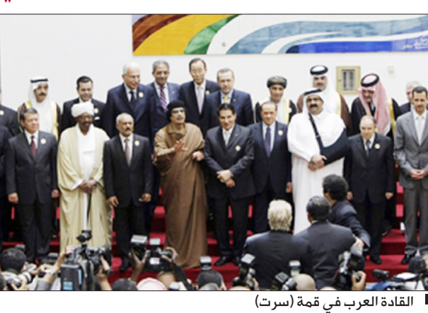
القادة العرب في قمة (سرت)

أعلن الرئيس السوري بشار الأسد تأييد الجمهورية العربية السورية لمبادرة اليمن الخاصة بتفعيل العمل العربي المشترك. وقال في تصريح: "إن المبادرة اليمنية كمبدأ جيدة ونحن مع أي مبادرة تهدف لتفعيل العمل العربي المشترك". وأضاف: "ولكن المبادرة تحتاج كأي مبادرة أخرى إلى دراسة وإلى تفاصيل أكثر ومن هنا جاء تشكيل لجنة خاصة لدراستها". كما أشاد وزير خارجية مملكة البحرين سمو الشيخ خالد بن محمد آل خليفة بالمبادرة اليمنية الرامية إلى تفعيل العمل العربي المشترك.