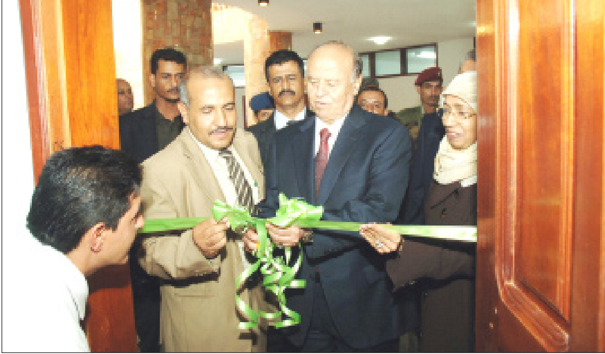
لدى افتتاحه الإدارة العامة لتقنية المعلومات