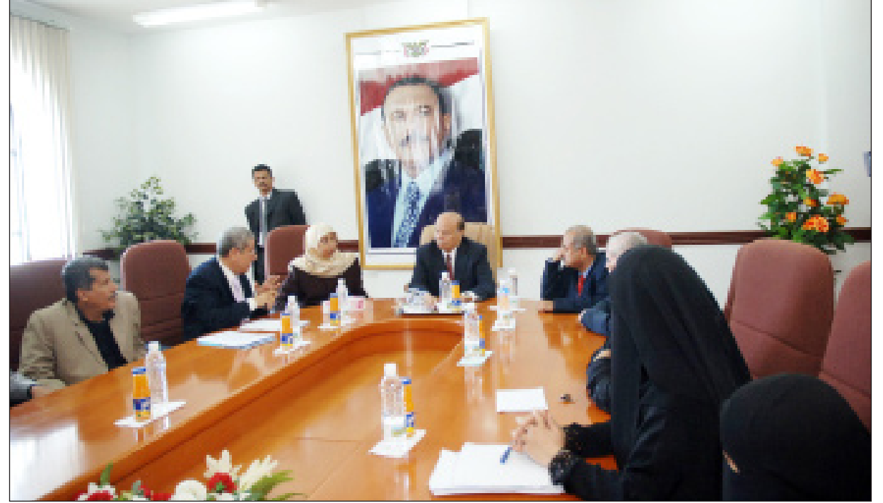
نائب الرئيس مع قيادة صندوق الرعاية الاجتماعية