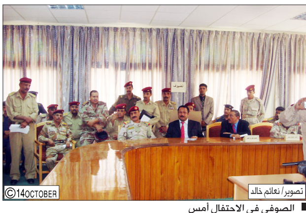
الصوفي في الاحتفال أمس

من جانبه أوضح العميد الركن حسين المقداد قائد المحور أن فخامة الأخ الرئيس علي عبدالله صالح القائد الأعلى للقوات المسلحة يولي المؤسسات العسكرية والأمنية كل الرعاية والاهتمام إيماناً منه بأهمية دور أبطال القوات المسلحة والأمن البواسل في الدفاع عن سيادة الوطن ومنجزاته العظيمة وتضحياتهم الجسيمة ومواقفهم الوطنية الشجاعة. كما استعرض قائد المحور خارطة مشروع قيادة الأركان في المحافظة. حضر التدشين وكيل المحافظة علي عبد اللطيف راجح.