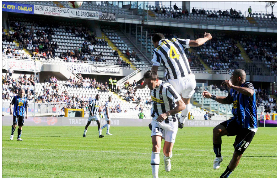
لقطعتان من الدوري الإيطالي