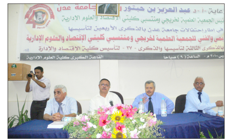
د. بن حبتور يلقي كلمته في الحفل التكريمي

على تنظيمهم هذا الحفل التكريمي الذي يدل على الاهتمام بالطلاب المتميزين والمتفوقين، مشيراً إلى أن هذا التكريم يمثل لفظة كريمة لأوائل الخريجين للدفع التاسعة والعاشر و عشرة كما شكل حفراً كبيراً للمكرمين يدفعهم لتقديم الأفضل وبذل أقصى الجهود في عصر المنافسة على المعرفة وفي ظل اهتمام الدولة ورئيس جامعة عدن بتحفيز الأداء المتميز وتوفير التجهيزات الحديثة والربط الحالي للكلية بشبكة الانترنت وإصدار مجلة خاصة بالجمعية والقيام بالعديد من الأنشطة المتعلقة باكتساب المعرفة. بعد ذلك قام الدكتور/ عبد العزيز بن حبتور رئيس جامعة عدن رئيس الجمعية العلمية بترسيم أوائل الدفع التاسعة والعاشر والحادية عشرة للأعوام 85-87م بدروع الجامعة والجمعية العلمية لخريجي كلية الاقتصاد والعلوم الإدارية. وفي ختام الحفل قدمت عدد من الأغاني أداها الفنان/ فضل سعود حيث أتحف الحاضرين بأغنيات من التراث اللحي الأصيل . حضر حفل التكريم الدكتور/ خليل إبراهيم محمد الأمين العام للجامعة والدكتور/ أحمد محمد مقبل عميد كلية الاقتصاد والأستاذ/ عبد القادر الكاف عميد كلية المجتمع بسبوتين محافظة حضرموت وعدد من نواب العمداء ومدراء المراكز العلمية ومسؤولي الجامعة.