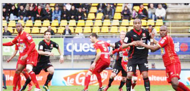
لقطة من الدوري الفرنسي