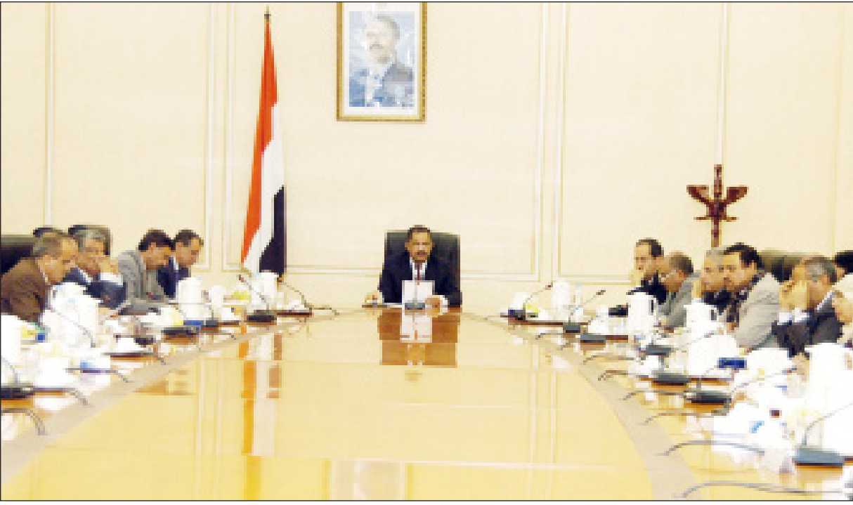
مجلس الوزراء في اجتماعه أمس