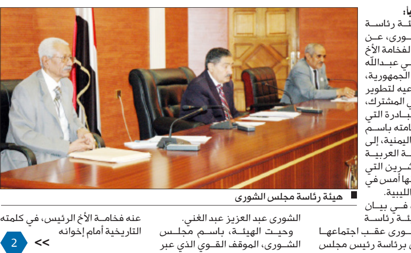
هيئة رئاسة مجلس الشورى

عبرت هيئة رئاسة مجلس الشورى، عن أحر تهانيتها لفخامة الأخ الرئيس علي عبدالله صالح رئيس الجمهورية، بنجاح مساعيه لتطوير العمل العربي المشترك، في خلال المبادرة التي تقدم بها فخامته باسم الجمهورية اليمنية، إلى مؤتمر القمة العربية الثانية والعشرين التي اختتمت أعمالها أمس في مدينة سرت الليبية. جاء ذلك في بيان أصدرته هيئة رئاسة مجلس الشورى عقب اجتماعها الدوري أمس برئاسة رئيس مجلس الشورى عبد العزيز عبد الغني. وحيث الهيئة، باسم مجلس الشورى، الموقف القوي الذي عبر عنه فخامة الأخ الرئيس، في كلمته التاريخية أمام إخوانه