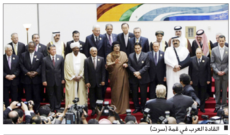
القادة العرب في قمة (سرت)

أعلن الرئيس السوري بشار الأسد تأييد الجمهورية العربية السورية لمبادرة اليمن الخاصة بتفعيل العمل العربي المشترك. وقال في تصريح: "إن المبادرة اليمنية كهدأ جيدة ونحن مع أي مبادرة تهدف تفعيل العمل العربي المشترك". وأضاف: "ولكن المبادرة تحتاج كأي مبادرة أخرى إلى دراسة وإلى تفاصيل أكثر ومن هنا جاء تشكيل لجنة خاصة لدراستها". كما أشاد وزير خارجية مملكة البحرين سمو الشيخ خالد بن احمد بن محمد آل خليفة بالمبادرة اليمنية الرامية إلى تفعيل العمل العربي المشترك.