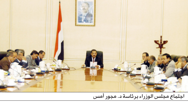
اجتماع مجلس الوزراء برئاسة د. مجور أمس

أخذ مجلس الوزراء في اجتماعه الاستثنائي يوم أمس الأحد برئاسة رئيس المجلس الدكتور علي محمد مجور مجموعة من الإجراءات للتخفيف من الأضرار التي يتعرض لها الاقتصاد الوطني من خلال ميزان المدفوعات والميزان التجاري. وأقر المجلس منح استيراد أية سلعة من غير بلد المنشأ وشهد على الجهات المعنية وفي المقدمة وزارة المالية التطبيق الصارم للقرار ومنع دخول أي سلعة من غير بلد المنشأ والعمل على إعادتها أو إتلافها في حال دخولها البلاد وفرض رسوم إضافية على 71 سلعة غير أساسية من بينها السلع ذات الطابع الترفيهي، بنسب تتراوح ما بين 5 - 15 بالمائة.