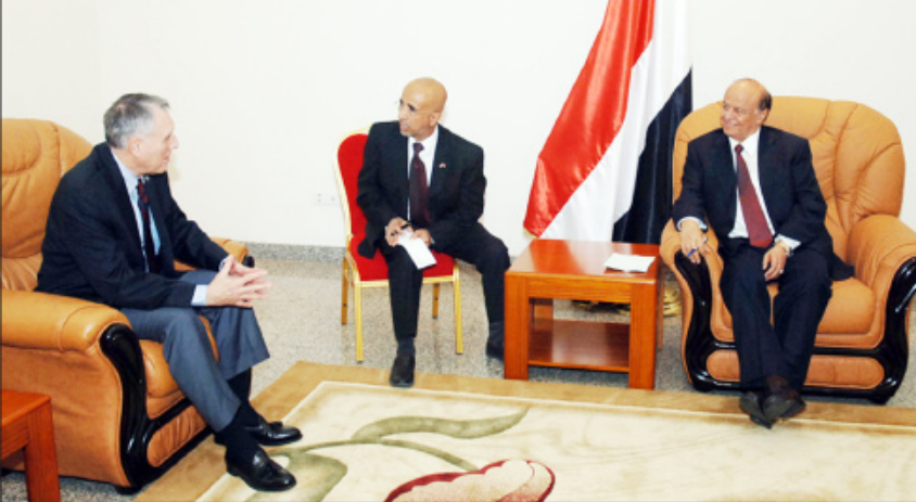
نائب الرئيس لدى استقباله وفد مجلسي الكونغرس والنواب الأمريكي أمس

استقبل الأخ عبدربه منصور هادي نائب رئيس الجمهورية يوم أمس الأحد وفد مجلسي الكونغرس والنواب الأمريكي برئاسة السيناتور جون كابل. وبعد أن رحب نائب رئيس الجمهورية بالوفد الأمريكي أشاد بالعلاقات اليمنية الأمريكية ووصفها بالعلاقات الممتازة وتناول الكثير من القضايا المتصلة بالوضع على الساحة الوطنية خصوصاً منذ قيام وطن الثاني والعشرين من مايو وقيام الجمهورية اليمنية الفتية في مطلع العقد الأخير من القرن العشرين. وأشار إلى أن اليمن بهذا الميلاد الجديد كان أول من استفاد من نهاية الحرب الباردة في إعادة وحدته ولحمته الوطنية.. منوهاً إلى أن النهج الديمقراطي والتعددية السياسية كان الخيار الوطني لدولة الوحدة وهو ما أدى بالتالي إلى الكثير من الإغتمالات بكل السبلات والإيجابيات. كما أشار إلى أن الإرادة الوطنية قد انتصرت للوحدة والديمقراطية وأسقطت المشاريع الصغيرة