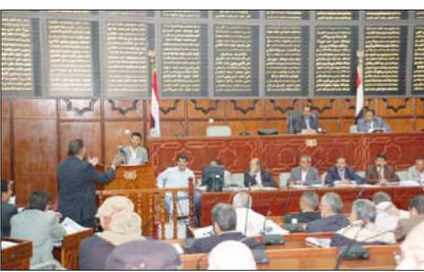
جلسة من جلسات مجلس النواب

صنعاء / سيا : ناقش مجلس النواب في جلسته أمس برئاسة رئيس المجلس يحيى علي الراعي التقرير المقدم من لجنة العدل والأوقاف حول مشروع قانون بشأن التحكيم. وأشار مشروع القانون إلى أنه مع عدم الإخلال بأحكام الاتفاقيات الدولية التي تكون اليمن طرفاً فيها تسري أحكام هذا القانون على أي تحكيم يجري في الجمهورية اليمنية، كما تسري على أي تحكيم يجري خارجها إذا اتفق أطرافه على إخضاعه لأحكام هذا القانون، ويعتبر التحكيم دولياً وإن جرى في الجمهورية اليمنية إذا كان