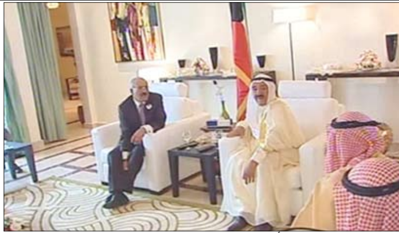
رئيس الجمهورية يلتقي أمير الكويت

سرت / سيا : قام فخامة الأخ الرئيس علي عبدالله صالح رئيس الجمهورية أمس بزيارة لأخيه سمو الشيخ صباح الأحمد الصباح أمير دولة الكويت في مقر إقامته بمدينة سرت الليبية. وجرى خلال اللقاء بحث العلاقات الأخوية ومجالات التعاون المشترك والقضايا المدرجة على جدول أعمال القمة العربية العادية الثانية والعشرين المنعقدة حالياً بمدينة سرت، وتنسيق مواقف البلدين بما يكفل نجاحها والخروج منها بنتائج تلبى طموحات أبناء الأمة العربية وتفعيل العمل العربي المشترك. وقد عبر سمو الشيخ صباح الأحمد الصباح مجدداً عن وقوف الكويت إلى