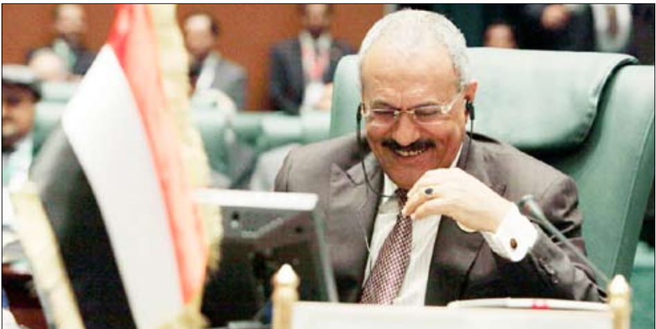
رئيس الجمهورية يلقي كلمة بلادنا في القمة العربية

العربية، وفي ضوءها انتظمت دورات انعقاد القمم العربية بعد أن كانت في الماضي منذ آخر قمة منتظمة عقدت في تونس، تعقد قمم استثنائية، وجاء انتظام الانعقاد لدورات القمة الاعتيادية ليصب في خدمة العمل العربي المشترك. وأشار إلى أن اليمن تقدمت أيضاً بمشروع متواضع آخر لإنشاء الاتحاد البرلماني العربي والذي تم إقراره وأنشئ هذا الاتحاد بعضوية متساوية من كل الأقطار العربية بغض النظر عن تعدادها السكاني. وقال: «الآن تقدمت الجمهورية اليمنية بمبادرة لتفعيل العمل العربي من خلال إنشاء اتحاد للدول العربية، وتبناها الاتحاد البرلماني العربي، وتم رفع مشروع قرار بشأنها إلى أعمال هذه القمة.» وأضاف: «إن هذه المبادرة انطلقت من رؤية موضوعية لمعالجة الاختلالات في العمل العربي المشترك والتحديات الراهنة والمستقبلية؛ باعتبار أن الانتقال من مؤسسة جامعة الدول العربية إلى اتحاد الدول العربية يمثل اليوم ضرورة قومية ملحة.»