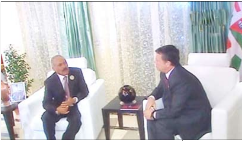
.. ويلتقي العاهل الأردني