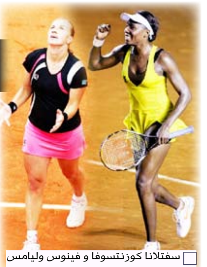
سفتلانا كوزنتسوف و فينوس وليامس

ثانية عشرة بفوزها على البريطانية إيلينا بانالشا 6 - 1 و 6 - 3، والروسية ناديا بتروفا السادسة عشرة بفوزها على اليابانية كيميكو داتي كروم 6 - 3 و 7 - 9 (9 - 7). والأرجنتينية جيزيلا دولكو بفوزها على الأوكرانية لونا بوندارنكو الحادية والعشرين 7 - 5 و 6 - 2، والسلوفاكية دانييلا هانتوتشوفافوزها على السويسرية باتي شنايدر 6 - 1 و 6 - 4. وخرجت من الدور الثاني الصينية لي نا المصنفة ثامنة اثر خسارتها أمام السويسرية تيميا باشينسكي 4 - 6 و 6 - 4 و 6 - 7 (3 - 7) والإيطالية غلافيا بينيتا المصنفة عشرة لخسارتها أمام الألمانية اندريا بيتكوفيتش 3 - 6 و 6 - 3 وصفر - 6.