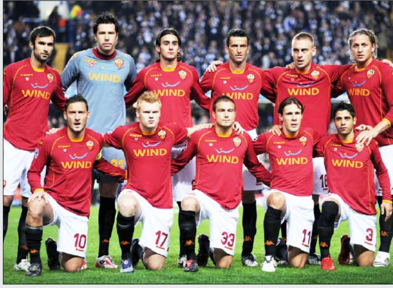
فريق روما الإيطالي

يخوض روما صاحب المركز الثاني برصيد 59 نقطة، مباراة مصيرية على الملعب الأولمبي في العاصمة الإيطالية عندما يستضيف اليوم السبت إنتر ميلان الذي يتقدمه بفارق أربع نقاط في المرحلة الـ 31 من الدوري الإيطالي لكرة القدم. ويعتقد النقاد في إيطاليا أن روما وحده قادر على منع إنتر ميلان من إحراز اللقب للمرة الخامسة على التوالي، لأن فريق العاصمة نجح في قلب تخلفه عن إنتر في مطلع الموسم الحالي من 14 نقطة إلى 4 نقاط فقط.