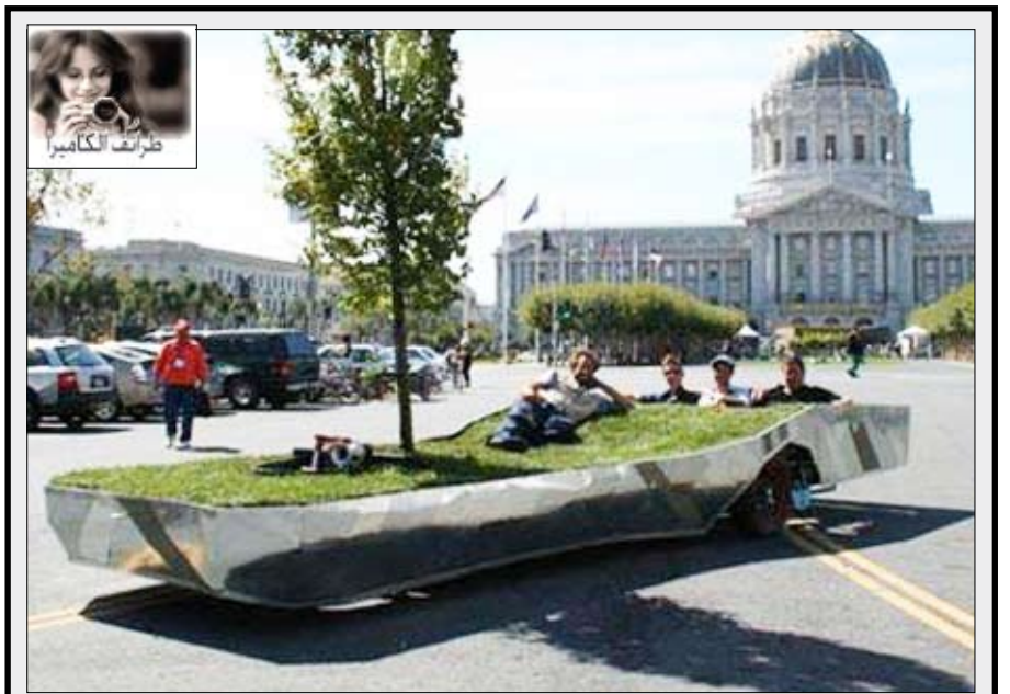
حديقة على سيارة متنقلة

ابتكرت شركة «جنرال موتورز» الشهيرة لصناعة السيارات مركبة كهربائية كرونية الشكل تتمتع بإمكانات هائلة وبسيطة تجعلها في متناول الجميع. ويعتبر التصميم البسيط والصغير أهم مميزات السيارة «EN-V»، حيث أنها لا تأخذ حيزاً كبيراً أمامها لن تفكر بعد اليوم في مكان تخزينها إذ تستطيع أن تضعها في منزلك. وتمتيز السيارة بقدرتها على الحد من التلوث الذي تسببه السيارات الأخرى مثل «الهامر» إذ يمكن القول إنها سيارة صديقة للبيئة. وقد عرضت شركة جنرال موتورز وشريكها الصيني «سايبك» السيارة للأمن في جناح مشترك في معرض اكسبو شانغهاي، الذي سيفتح رسمياً في الأول من شهر مايو المقبل لمدة 6 أشهر.